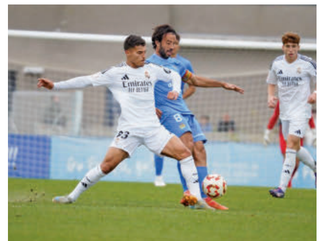
El derbi en el Torres se cerró con tablas (2-2)

Dos horas después, el Atlético de Madrid B también actuará como local, en su caso ante el Marbella, con el objetivo de resarcirse del tropiezo de la semana pasada ante el Villarreal B (3-2).