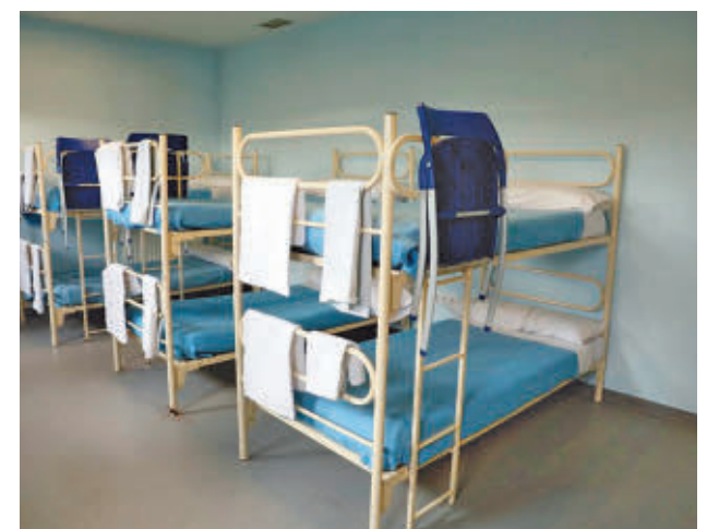
El Centro de Acogida Pinar de San José, en el distrito de Latina

Fuentes municipales explican que la Campaña del Frío garantiza a los usuarios el alojamiento, la manutención (cena y desayuno), el aseo e higiene personal y el servicio de lavandería, ropero y consigna. Este año, la novedad viene de la mano de una alimentación más saludable, con platos calientes en las cenas, en lugar de la comida de línea fría (bocadillos) que se distribuía hasta ahora.