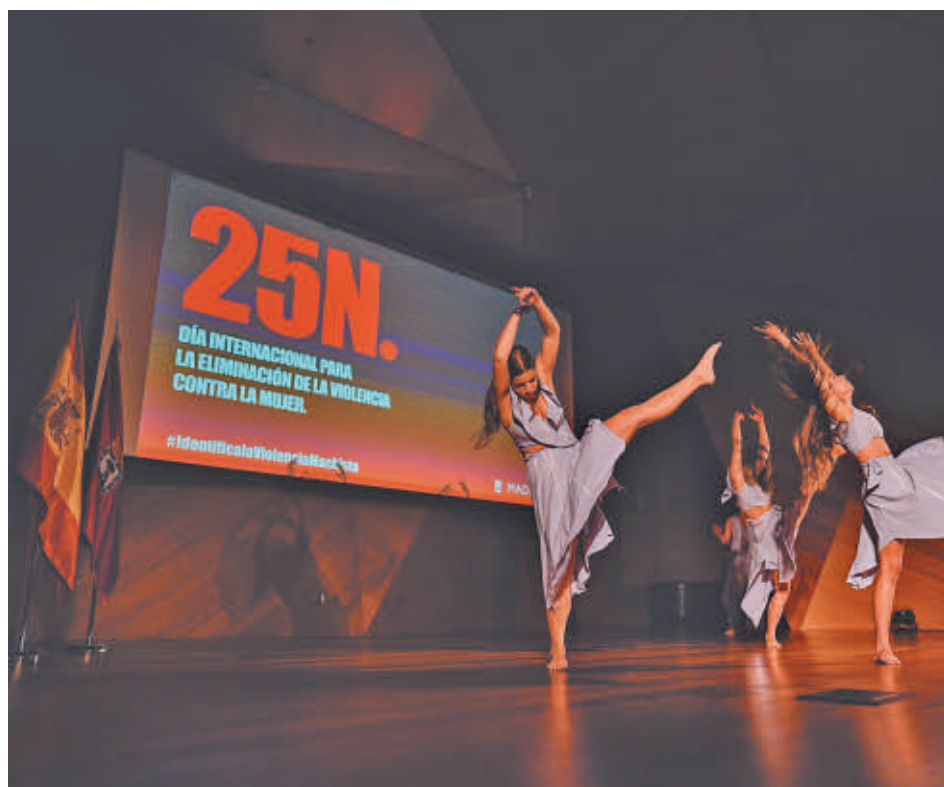
El espectáculo ‘Miradas en blanco’ de la Compañía de Danza de Castilla y León

GenteMadrid.es Consulte la actualidad regional y local en nuestra página web