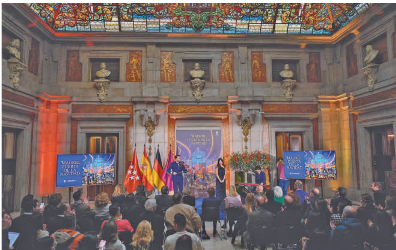
El Patio de Cristales de la Plaza de la Villa fue el escenario de la presentación oficial de la programación municipal navideña