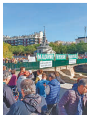
Un momento de la protesta

bajo el lema ‘Por un río vivo, ¡no a las luces!’, contra la iluminación de un tramo de 560 metros en el cauce del río Manzanares a su paso por Madrid Río. Esta protesta llega después de que fuera admitido a trámite el recurso de ambos colectivos al considerar que el alumbrado orna-