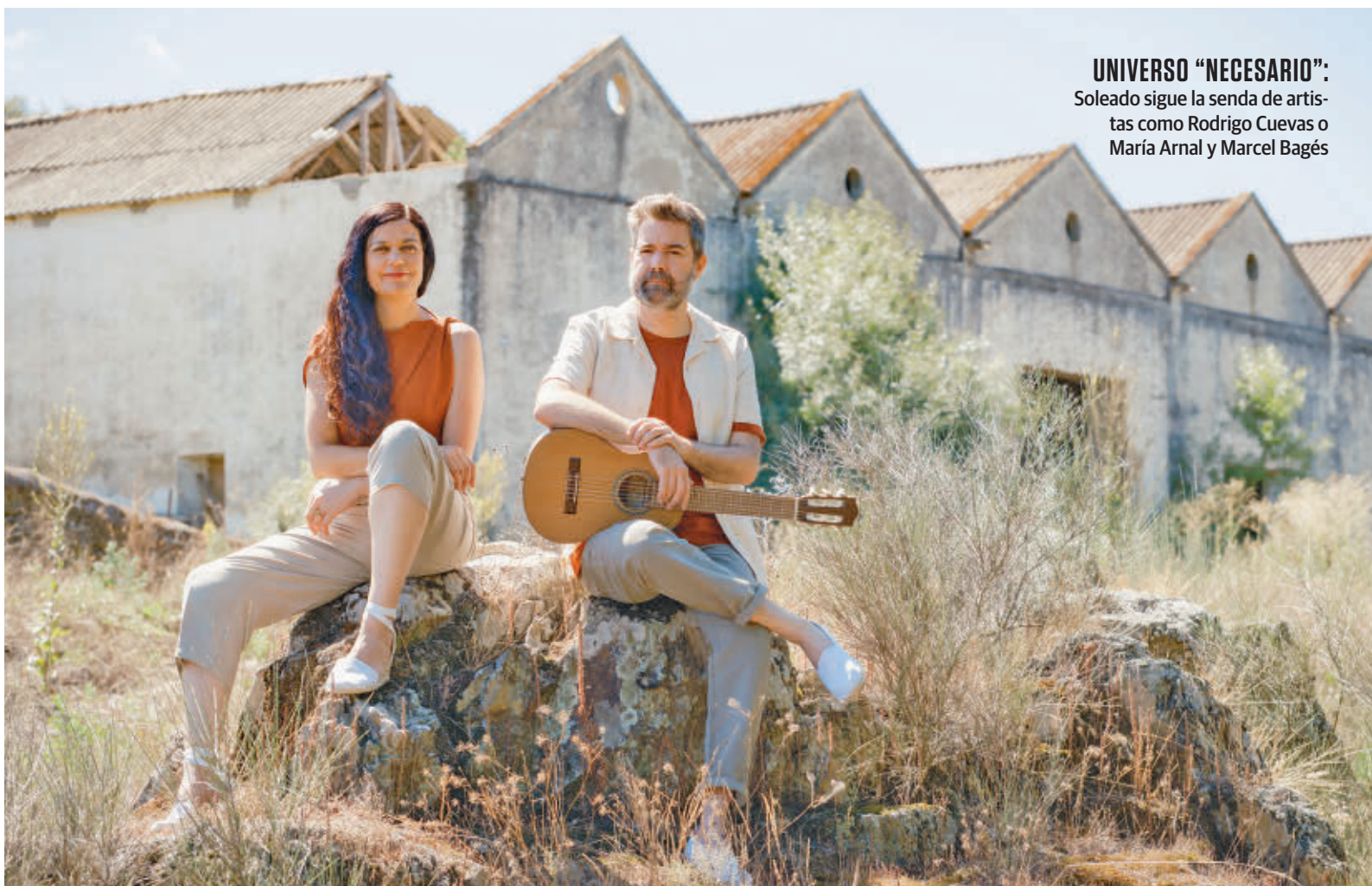
UNIVERSO “NECESARIO”: Soleado sigue la senda de artistas como Rodrigo Cuevas o María Arnal y Marcel Bagés

“VISTO CON PERSPECTIVA, ‘VESTIDA DE DOMINGO’ ES UNA BUENA TARJETA”