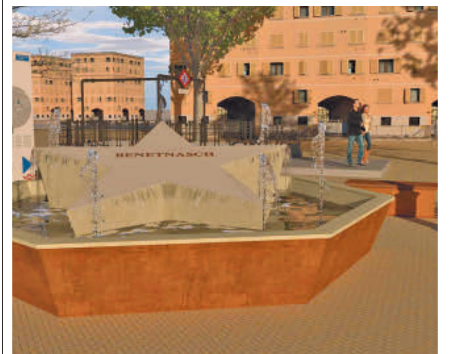
Recreación de la fuente de Benetnasch AYUNTAMIENTO DE MADRID

Estas dos entidades alertan de un impacto en los ciclos vitales de la fauna y en la fotosíntesis de la flora, “pudiendo perjudicar incluso la calidad del agua, amén de generar plagas de mosquitos con los perjuicios que supondrán para los miles de residentes”, señalan.