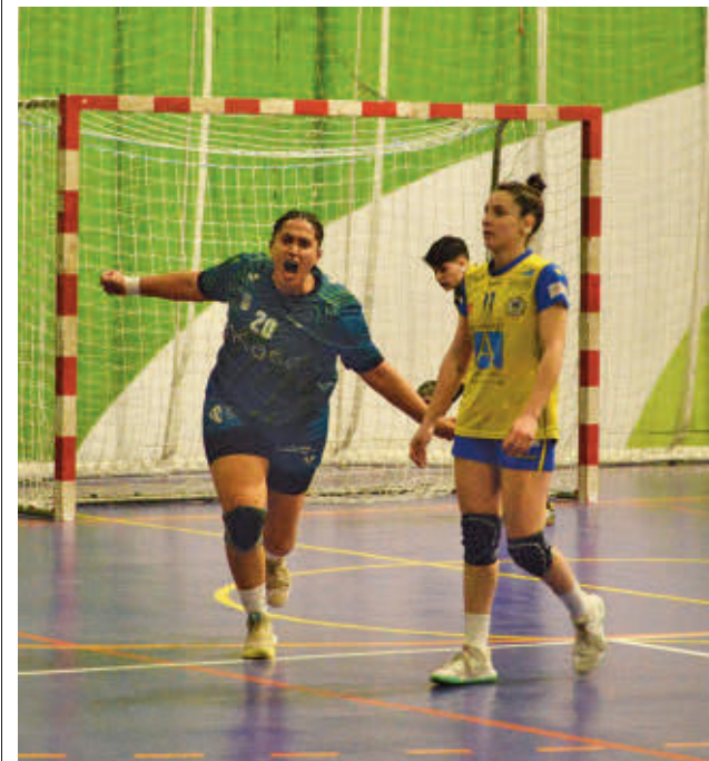
Gran arranque de curso del Ikasa FRANCIS IGUACEL

Los otros dos inquilinos de las primeras posiciones también se medirán a rivales de la zona baja. El Bolaños recibe a un Carballal que es penúltimo y el Lanzarote visitará al Mislata.