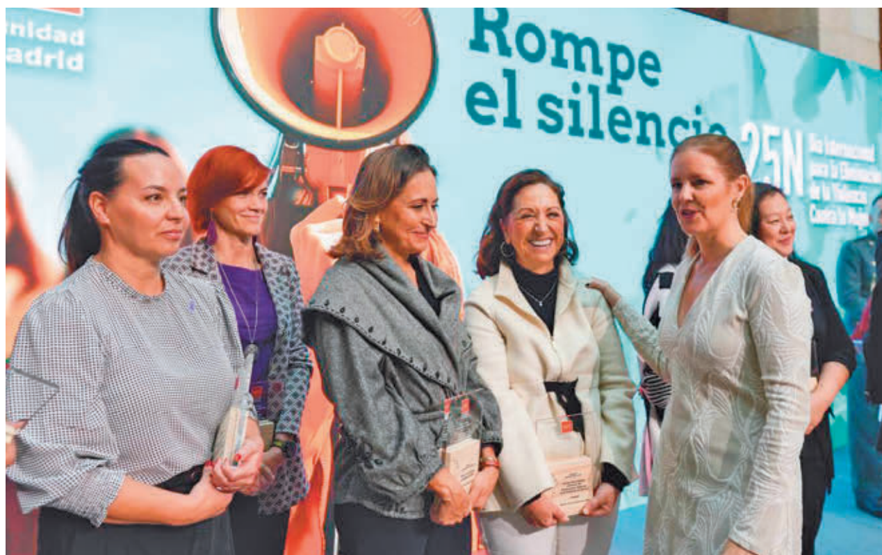
La consejera y algunas de las personas premiadas por la Comunidad de Madrid