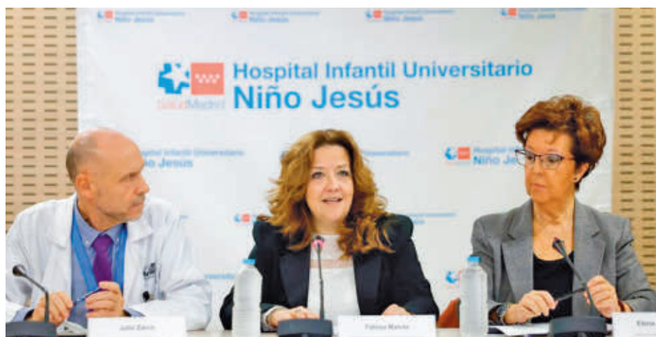
La consejera presentó esta semana el nuevo protocolo

Los fondos estatales a los que se refirió Dávila acabarían por completar los 20 millones restantes hasta los 60 totales.