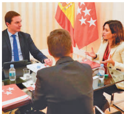
Lobato en una reunión con Díaz Ayuso

EL PERIÓDICO GENTE NO SE RESPONSABILIZA NI SE IDENTIFICA CON LAS OPINIONES QUE SUS LECTORES Y COLABORADORES EXPONGAN EN SUS CARTAS Y ARTÍCULOS