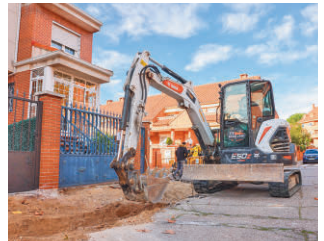
Los trabajos ya han dado comienzo

"El objetivo es eliminar barreras arquitectónicas para generar itinerarios que mejoren la accesibilidad de los peatones que necesiten desplazarse por estas calles", ha añadido el edil. Además, se va a renovar el alumbrado.