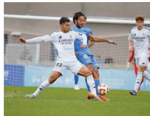
El derbi en el Torres se cerró con tablas (2-2)

Dos horas después, el Atlético de Madrid B también actuará como local, en su caso ante el Marbella, con el objetivo de resarcirse del tropiezo de la semana pasada ante el Villarreal B (3-2).