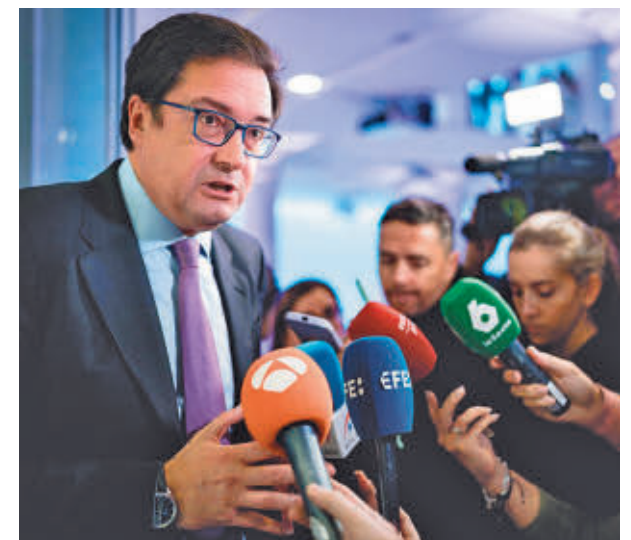
El ministro Óscar López

Aunque nació en Madrid hace 51 años, la única experiencia de Óscar López en la política regional la vivió en Castilla y León, la tierra de sus padres. Allí fue nombrado secretario general en 2008 y fue cabeza de lista en las autonómicas de 2011. Perdió con claridad ante el popular Juan Vicente Herrera y solo unos meses más tarde regresó a la política nacional.