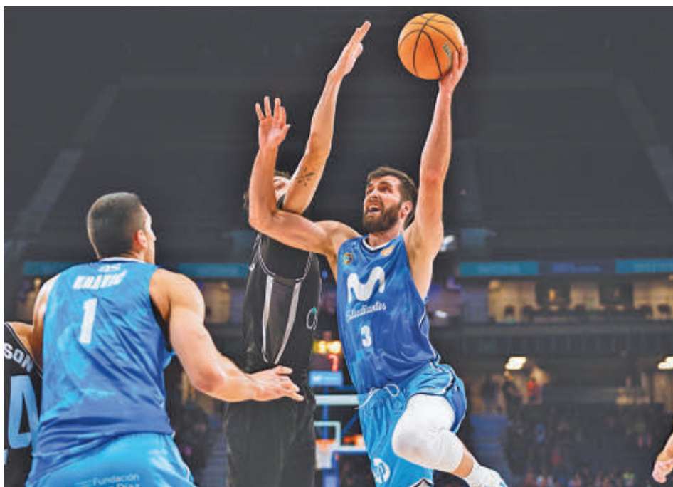
Los colegiales superaron al Odilo Cartagena en la última jornada MOVISTAR ESTUDIANTES