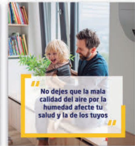
CALIDAD DEL AIRE