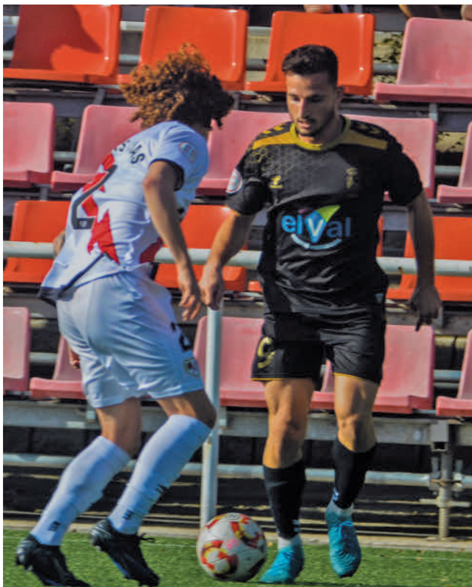
Triunfo clave del Alcalá en la Ciudad Deportiva del Rayo RSD ALCALÁ

Tercero en discordia aparece un Rayo Vallecano B que se