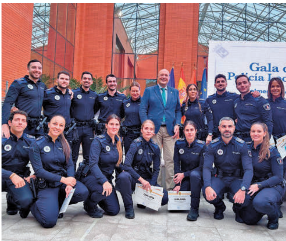
Presentación de los nuevos agentes