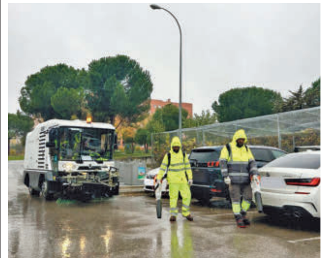
Los trabajos se realizan por la mañana y por la tarde

El Ayuntamiento pone a disposición de los vecinos el WhatsApp municipal para que puedan enviar notificaciones para la mejora del servicio. Basta con agregar el número 644 59 44 93 a la agenda del teléfono móvil.