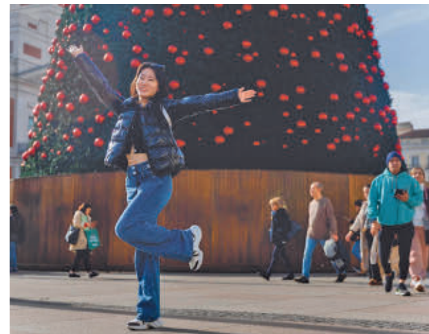
Turistas en la Puerta del Sol

En términos mensuales, 864.513 turistas internacionales han visitado la región en octubre, un 5,1% más respecto al mismo mes del año 2023, y dejaron un gasto de 1.651 millones de euros, una cifra que supone una subida del 14,6%.