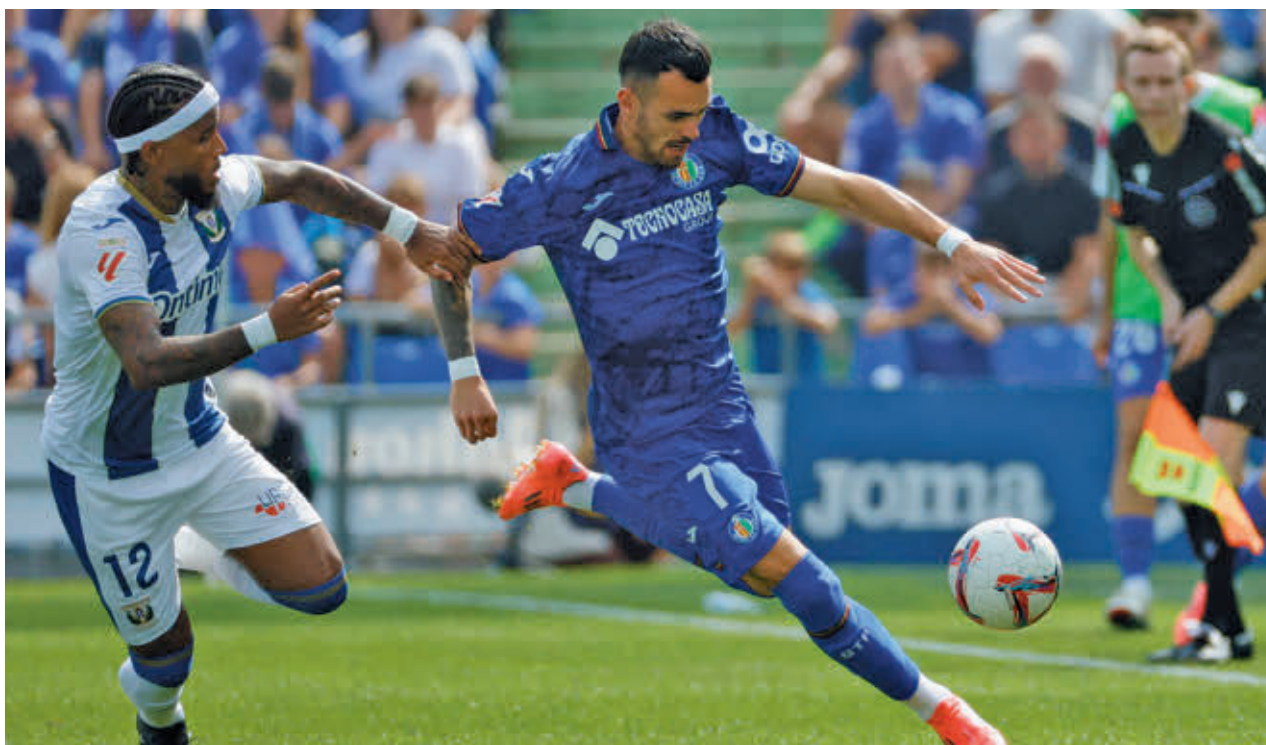
Imagen del derbi disputado en septiembre en el Coliseum entre Getafe y Leganés