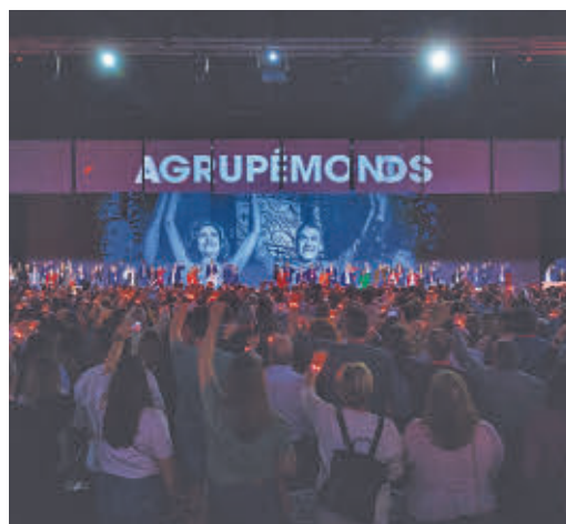
Imagen del Congreso de Sevilla

EL PERIÓDICO GENTE NO SE RESPONSABILIZA NI SE IDENTIFICA CON LAS OPINIONES QUE SUS LECTORES Y COLABORADORES EXPONGAN EN SUS CARTAS Y ARTÍCULOS