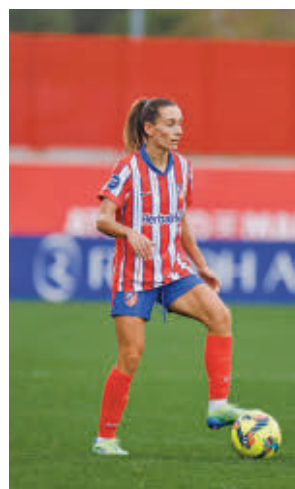
El Atlético es segundo

Por su parte, el Madrid CFF buscará su quinto triunfo de la temporada. Será en casa (domingo, 16 horas) ante un Levante metido en problemas clasificatorios.