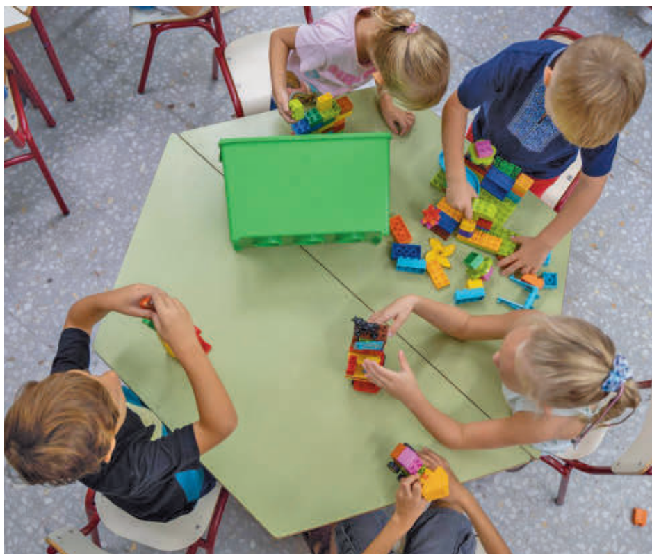
Los gastos derivados de la crianza son cada vez más elevados

Por edades, el coste para la etapa de 0-3 años en la Comunidad ha aumentado un 12% con respecto a 2022, por encima del aumento del coste medio. El gasto más elevado en esta etapa es el de conciliación (la escuela infantil), más de un tercio del total. Entre los 7 y los 18 años, la alimentación ha pasado a ser el segundo gasto para las familias en lugar del tercero (entre los 13 y los 18 años ocupa un 20% del presupuesto familiar) con el correspondiente impacto en el bien-