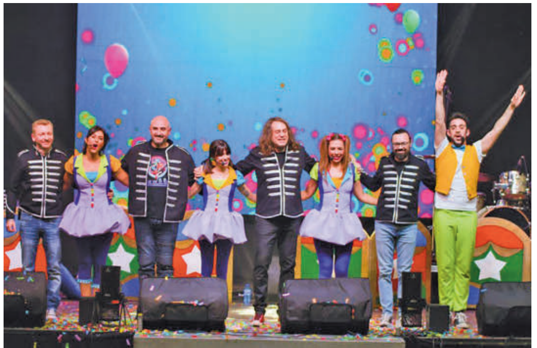
Musilocos actuará el sábado 14 de diciembre

da por el Ayuntamiento de y la asociación empresarial ACENOMA, con la colaboración del Banco Sabadell. Además, el concurso de escaparates establece tres premios de 1.000, 500 euros y 100 euros, un certamen que también lleva aparejada la campaña 'Premio al comprador'