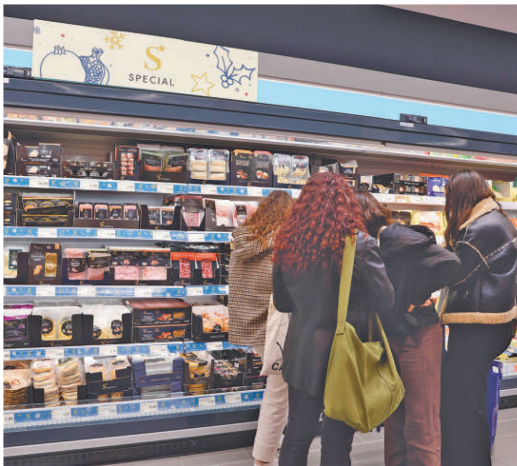
Los supermercados adaptan su oferta a las fechas navideñas

Otra vía de ahorro que se mantiene año tras año es la elección del supermercado para las compras navideñas, siendo el lugar donde ya realiza sus compras de estas fechas cuatro de cada diez familias madrileñas. La principal razón para optar por estos establecimientos es su buena relación calidad-precio (55%),