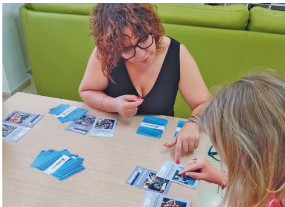
Proyecto para formar a las personas con discapacidad

La organización pretende poner el foco "sobre las bajas tasas de empleo de este colectivo, el incremento de la discapacidad adquirida durante la vida laboral y el mayor riesgo de pobreza y exclusión so-