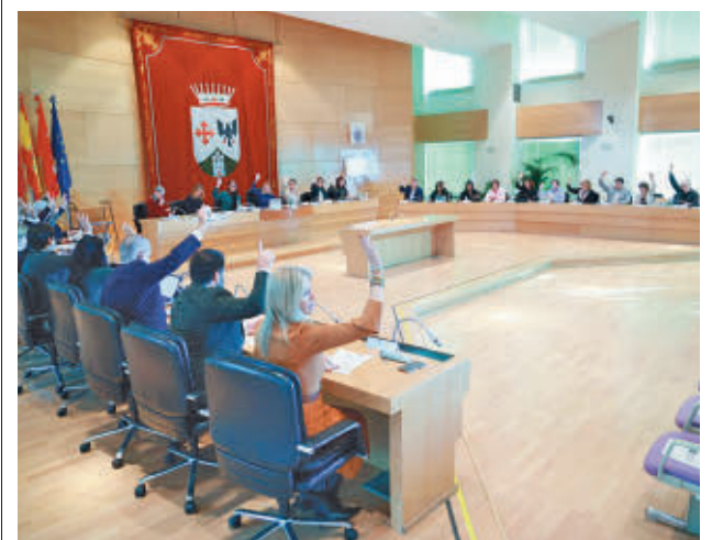
Imagen correspondiente al último pleno

El incremento en los servicios que ha asumido el Ayuntamiento, como es el caso de la limpieza viaria en las urbanizaciones, unido al aumento de las ayudas a las Entidades de Conservación, permitirá optimizar el mantenimiento de las infraestructuras en las propias zonas de aplicación, así como llevar a cabo algunas inversiones que beneficien directamente a todos los residentes, según ha destacado el Consistorio en un comunicado.