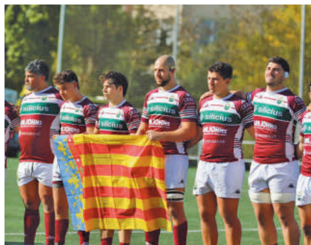
El Alcobendas rindió un homenaje a la Comunidad Valenciana

A esa misma hora, pero en el Valle de las Cañas, el Pozuelo Unión Rugby se ve las caras con otro de los 'gallitos' de la competición, el histórico Club de Rugby El Salvador, que actualmente ocupa la cuarta posición. Los locales son pe-