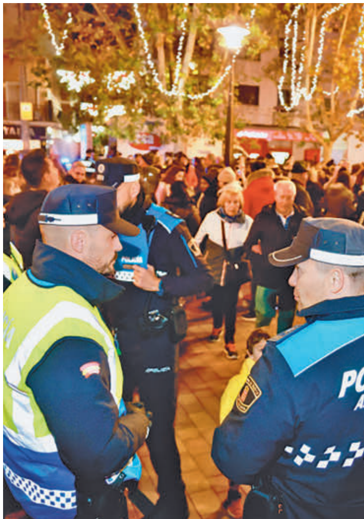
Los agentes vigilarán y controlarán zonas comerciales

HABRÀ APOYO DE POLICÍA NACIONAL Y SEGURIDAD PRIVADA