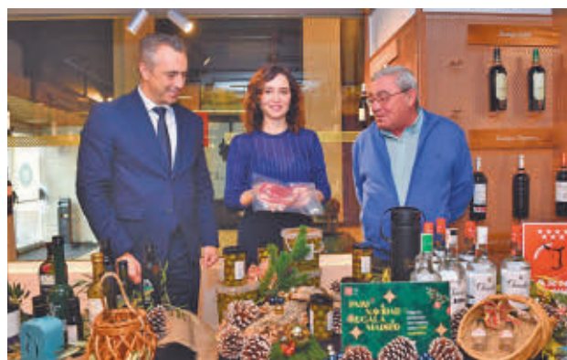
Acto de presentación de la campaña

Incluyen 45 productos diferentes con precios que oscilan entre los 25 y los 95 euros. Su contenido se puede con-