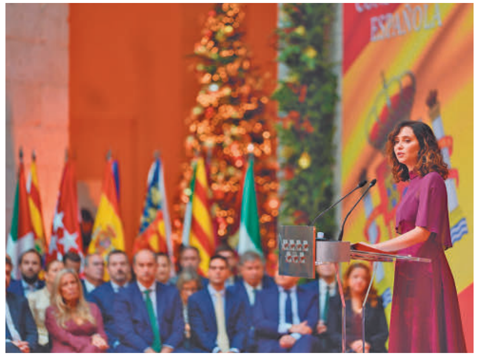
Isabel Díaz Ayuso, durante su intervención

"NO SE PUEDE ESTAR GOBERNANDO A CUALQUIER PRECIO"