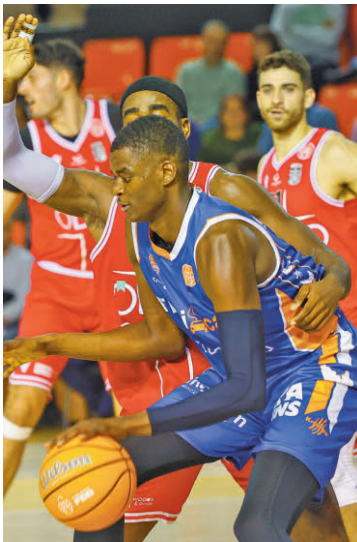
Nzosa, en el partido ante Cartagena

Bien distinta es la situación de un Ourense Baloncesto que se presentará este domingo 8 (12:30 horas) en