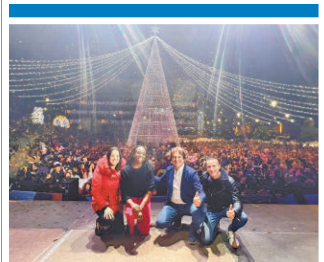
Cientos de vecinos acudieron al encendido AYTO DE FUENLABRADA

‘Juventud informada y derechos van de la mano contra el SIDA’ es el lema de la campaña que, con motivo del Día Mundial del SIDA, ha llevado a cabo el Ayuntamiento de Fuenlabrada a través de la Concejalía de Juventud e Infancia y en colaboración con entidades juveniles del municipio. El objetivo que se persigue con ello es el de impulsar la formación, la sensibilización, la detección precoz, así como el asesoramiento preventivo especialmente entre el colectivo de jóvenes, del VIH y de otras enfermedades de transmisión sexual. El alcalde, Javier Ayala, ha subrayado su compromiso con la promoción de “acciones y políticas municipales que protejan a las comunidades más vulnerables”, promulgando la igualdad, la prevención y la atención al VIH.