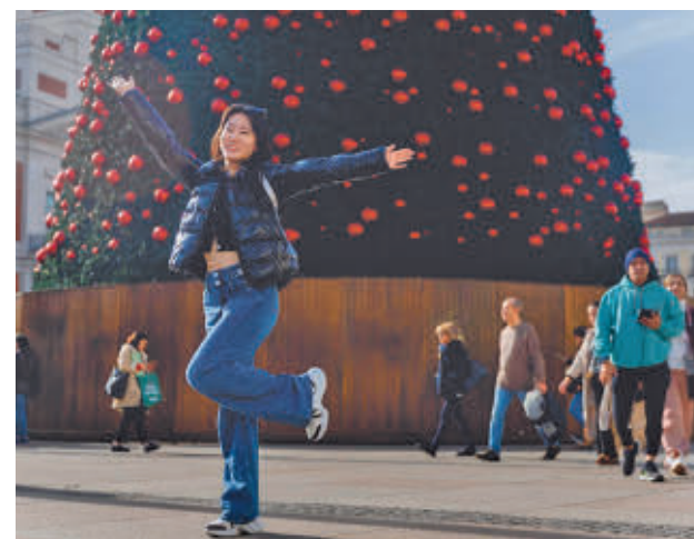
Turistas en la Puerta del Sol

En términos mensuales, 864.513 turistas internacionales han visitado la región en octubre, un 5,1% más respecto al mismo mes del año 2023, y dejaron un gasto de 1.651 millones de euros, una cifra que supone una subida del 14,6%.