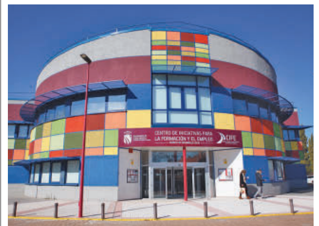
Se organizarán 6 itinerarios de formación AYTO DE FUENLABRADA

En cuanto al primero, 'Sirena', el artista muestra a una mujer tocando el arpa y mirando directamente "a todas las personas que transiten por esta vía y alcen la vista hacia ella", han explicado fuentes municipales. El otro mural 'Discóbolo', representa la icónica obra del griego Mirón, pero en lugar de lanzar un disco, en esta ocasión tiene entre sus manos un ramo de flores como 'arma arrojadiza'. El MAUF se puso en marcha en 2019 con el fin de que artistas reconocidos expongan su obra utilizando fachadas de diferentes edificios, para que la ciudadanía pueda disfrutar del arte urbano.