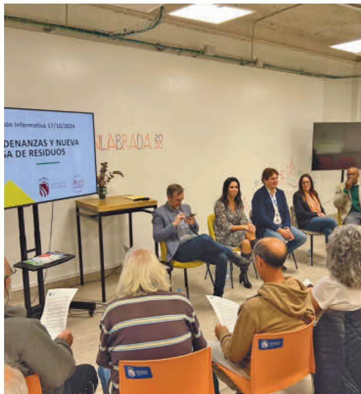
El Ayuntamiento ha impulsado reuniones informativas con los vecinos

Es por este motivo que, desde este pasado lunes y hasta finales de la próxima