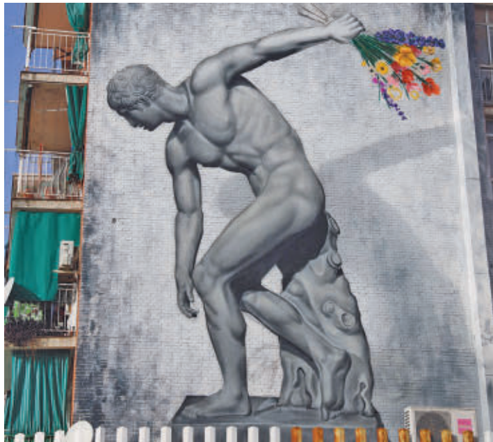
El MAUF se puso en marcha en 2019 AYUNTAMIENTO DE FUENLABRADA

De forma paulatina incrementan las piezas que se enmarcan dentro de este Mu-