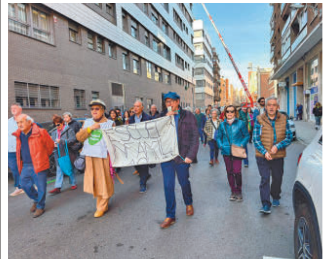
La cabecera de la manifestación vecinal @AVPINOSRETIRO