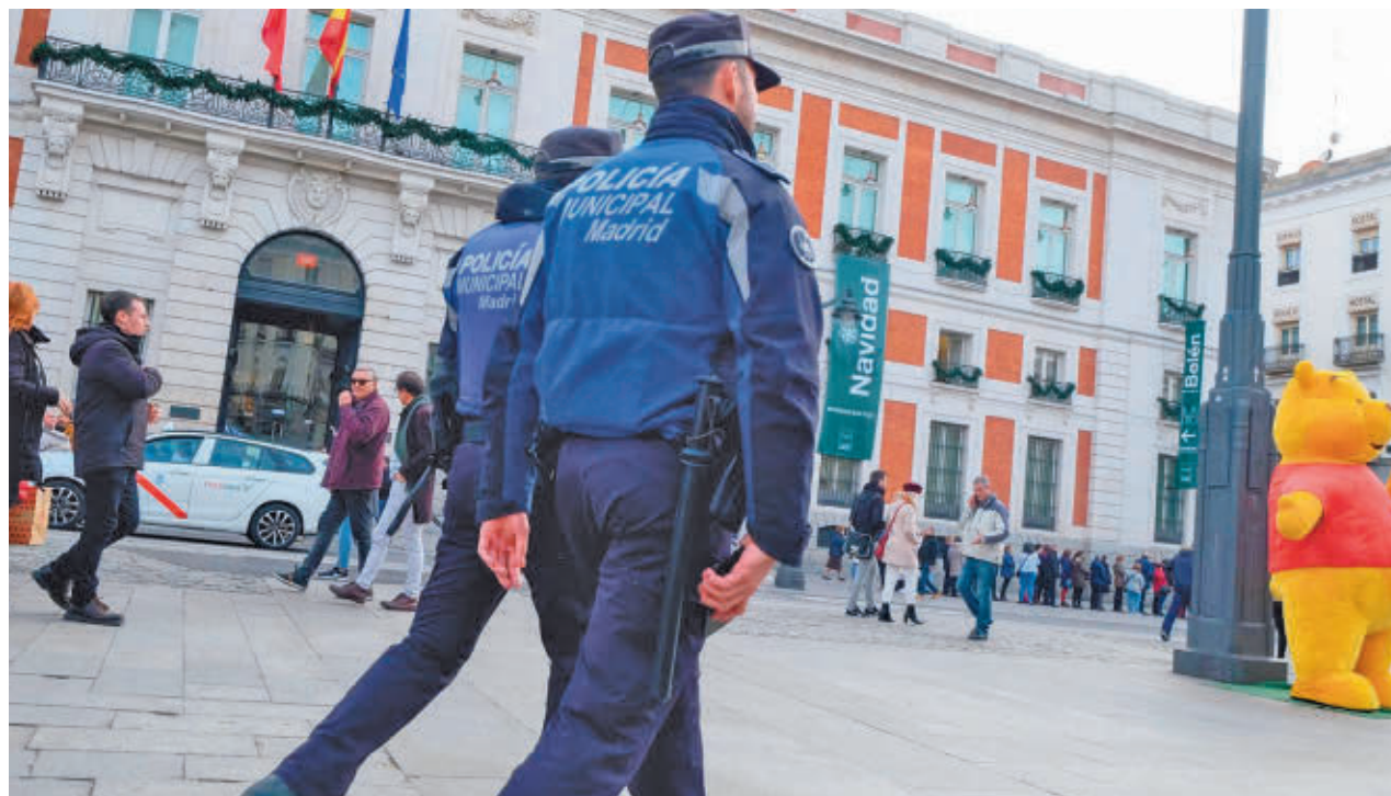
Una pareja de policías municipales patrullan por la Puerta del Sol