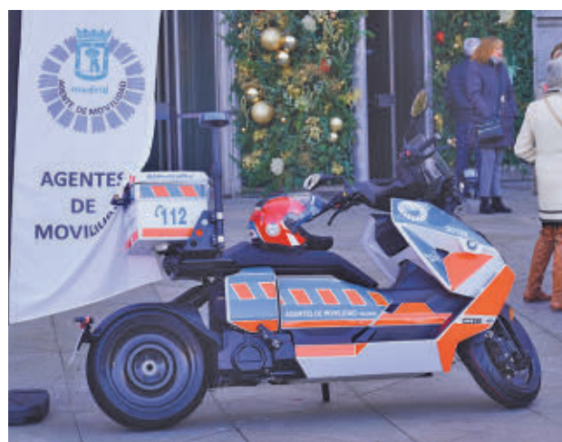
Una de las nuevas motos de los Agentes de Movilidad

No obstante, con el fin de optimizar su uso, se han adquirido también 17 cargadores eléctricos que, sumados a los 12 ya existentes, permiten a este cuerpo disponer de un total de 29 distribuidos en