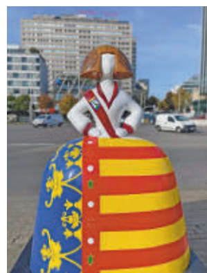
La menina fallera

Gallery 2024', organizada por la Asociación Nacional del Comercio Textil, Complementos y Piel (Acotex) con el apoyo del Ayuntamiento. La nueva figura, que luce la bandera de Valencia y una banda con el escudo de la ciudad, representa a una fallera y simboliza la solidaridad y el apo-