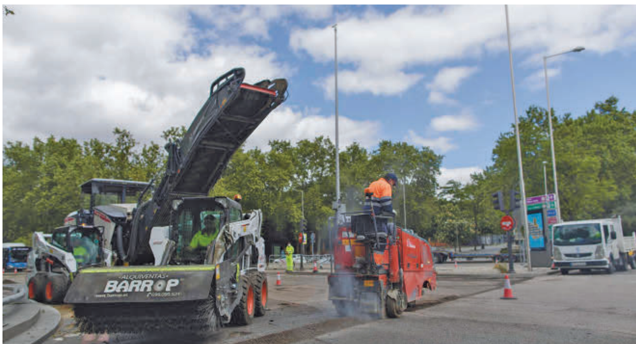
Varios operarios trabajan en el entorno de la Plaza del Emperador Carlos V