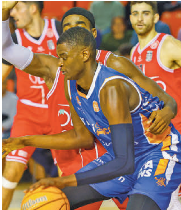
Plantilla actual del Innova-tsn Leganés

Suma y sigue. Tanto Flexicar Fuenlabrada como Movistar Estudiantes continúan con su particular pulso a tres bandas con el Silbó San Pablo Burgos por el liderato de la Primera FEB, una competición que intensifica su actividad en estos primeros compases de diciembre. Para empezar, este fin de semana se celebra la jornada 10, con partidos a priori de dificultad di-