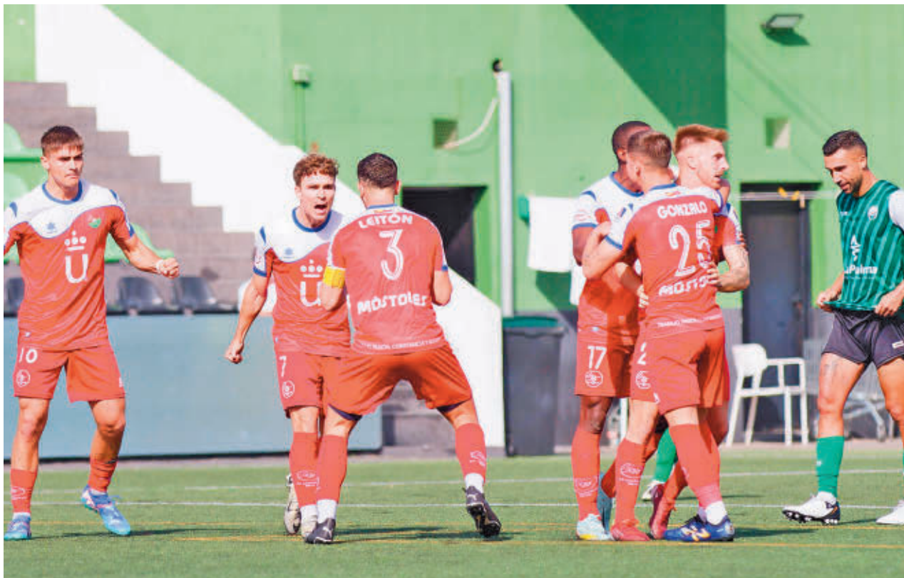
El conjunto azulón mantuvo la racha de victorias con la remontada en la isla de La Palma