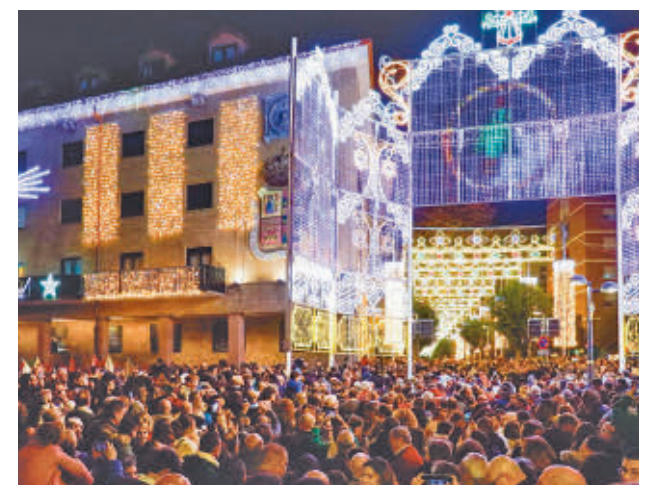
La Galería de la Navidad ilumina la ciudad con 700.000 luces

Con este acto, la ciudad dio la bienvenida a un diciembre de magia navideña.