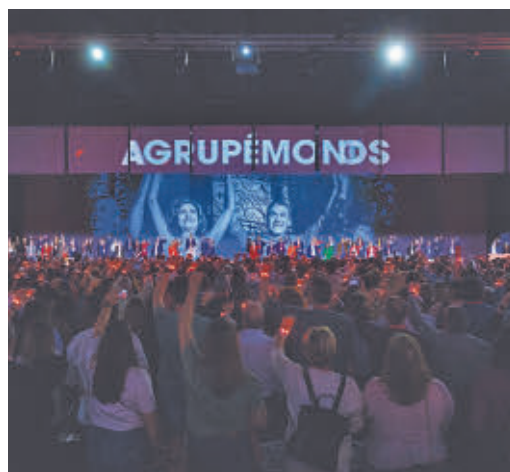
Imagen del Congreso de Sevilla

EL PERIÓDICO GENTE NO SE RESPONSABILIZA NI SE IDENTIFICA CON LAS OPINIONES QUE SUS LECTORES Y COLABORADORES EXPONGAN EN SUS CARTAS Y ARTÍCULOS