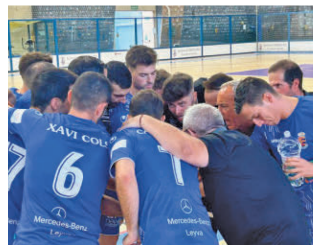
Los mostoleños siguen sin conocer la derrota en liga