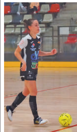
El equipo suma 12 puntos

Tras ese doble refuerzo moral, el CD Móstoles URJC regresa este domingo 8 (12 horas) a El Soto para verse las caras con otro rival directo, el Melilla cuarto por la cola con 14 puntos.