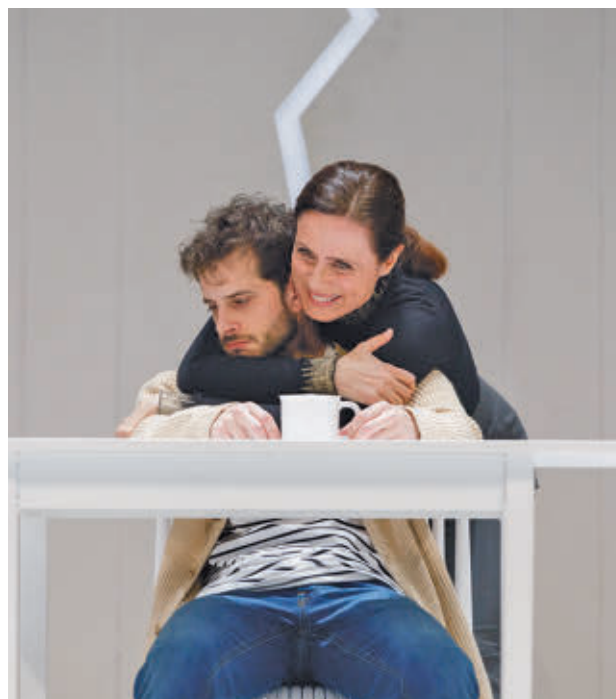
La obra abarca temas sociales como la soledad y la cordura

El viernes 6 de diciembre en el Teatro del Bosque se podrá disfrutar de 'Vano fantasma de niebla y luz', un homenaje a Gustavo Adolfo