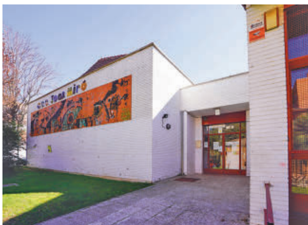
Diversión navideña en El Soto, Joan Miró y Norte-Universidad