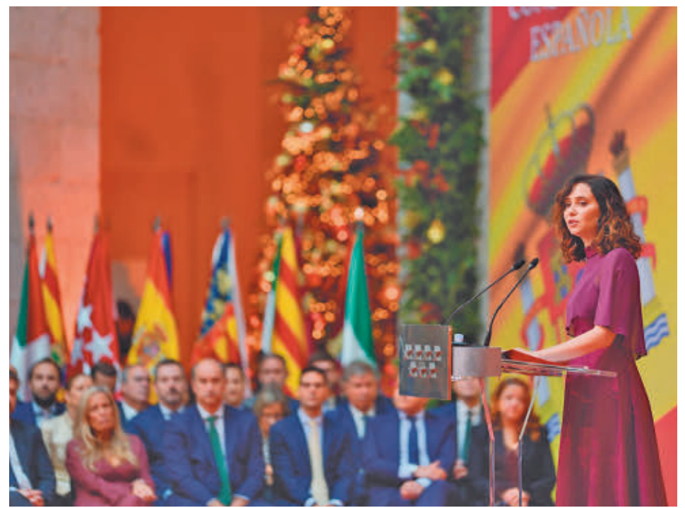
Isabel Díaz Ayuso, durante su intervención

"NO SE PUEDE ESTAR GOBERNANDO A CUALQUIER PRECIO"