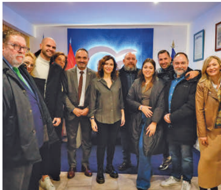
La sede se sitúa al lado de la ermita de Nuestra Señora de los Santos

La presidenta madrileña visitó Móstoles este martes • La ciudad acogió el último Comité Ejecutivo Autonómico del PP • Ayuso denunció "una operación de Estado" contra su persona