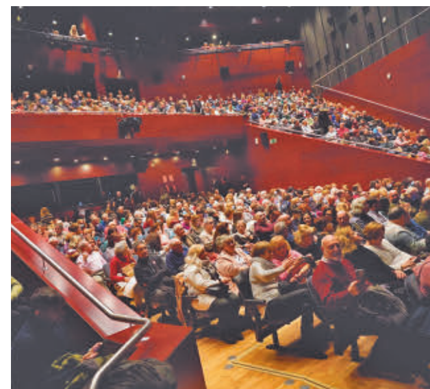
Los teatros de la ciudad recibirán a los participantes del Foro

Este foro será un espacio de aprendizaje, convivencia y consolidación para el teatro amateur, que atrae cada año a casi dos millones de espectadores en España.