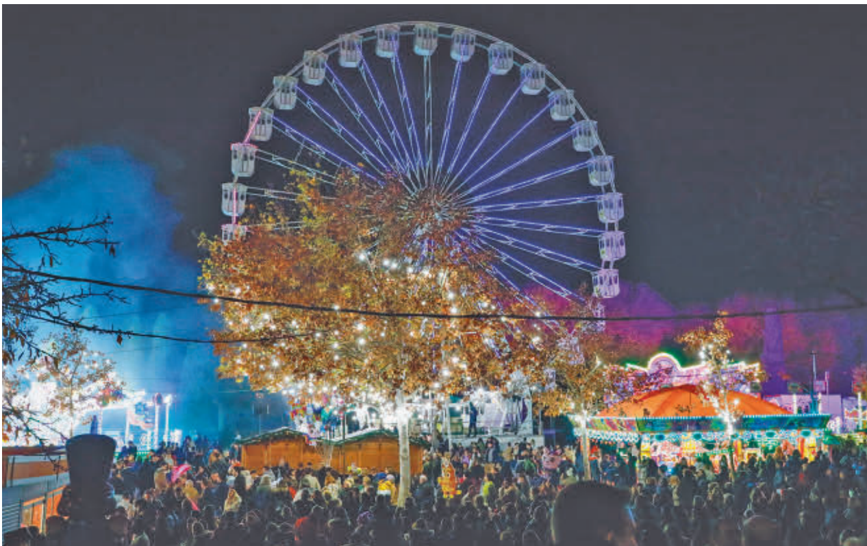
Navipark, con más de 100.000 metros cuadrados, ofrecerá actividades y acceso facilitado durante las fiestas