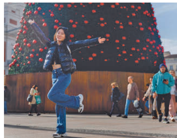
Turistas en la Puerta del Sol

En términos mensuales, 864.513 turistas internacionales han visitado la región en octubre, un 5,1% más respecto al mismo mes del año 2023, y dejaron un gasto de 1.651 millones de euros, una cifra que supone una subida del 14,6%.