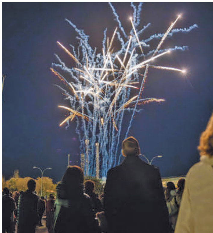
Los fuegos artificiales serán protagonistas este sábado

Después de esta apertura por todo lo alto, Colmenar se prepara para vivir un mes lleno de magia y eventos, como el mercadillo navideño que se instalará en las plazas del Pueblo y de Luis Gutiérrez y en las calles de la Iglesia y del Viento. Se celebrará del 13 al 15 de diciembre con los siguientes horarios: viernes, de 17:30 a 22 horas; sábado, de 11 a 14:30 y de 17:30 a 22; y domingo, de 11 a 14:30 y de 17:30 a 21:30 horas. También ese fin de semana, concretamente el sábado 14 (desde las