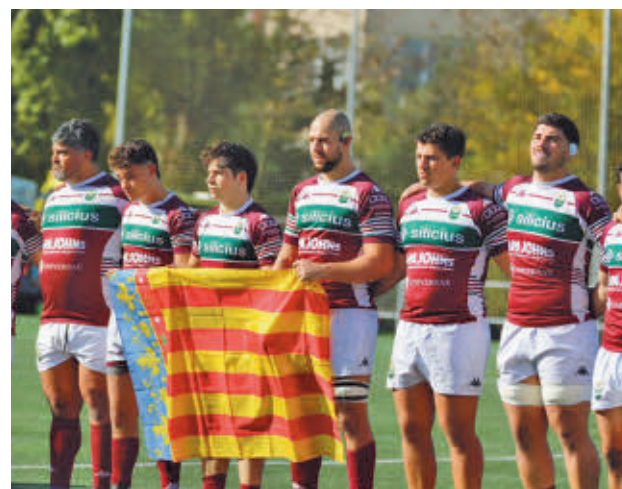
El Alcobendas rindió un homenaje a la Comunidad Valenciana

A esa misma hora, pero en el Valle de las Cañas, el Pozuelo Unión Rugby se ve las caras con otro de los 'gallitos' de la competición, el histórico Club de Rugby El Salvador, que actualmente ocupa la cuarta posición. Los locales son pe-