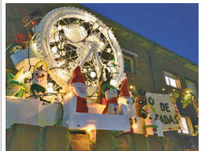
Obra de una edición anterior