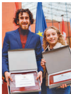
Dos de los premiados