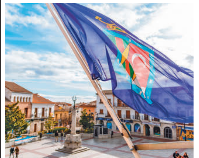
La votación de los presupuestos tuvo gran consenso