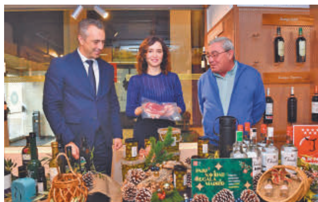
Acto de presentación de la campaña

Incluyen 45 productos diferentes con precios que oscilan entre los 25 y los 95 euros. Su contenido se puede con-