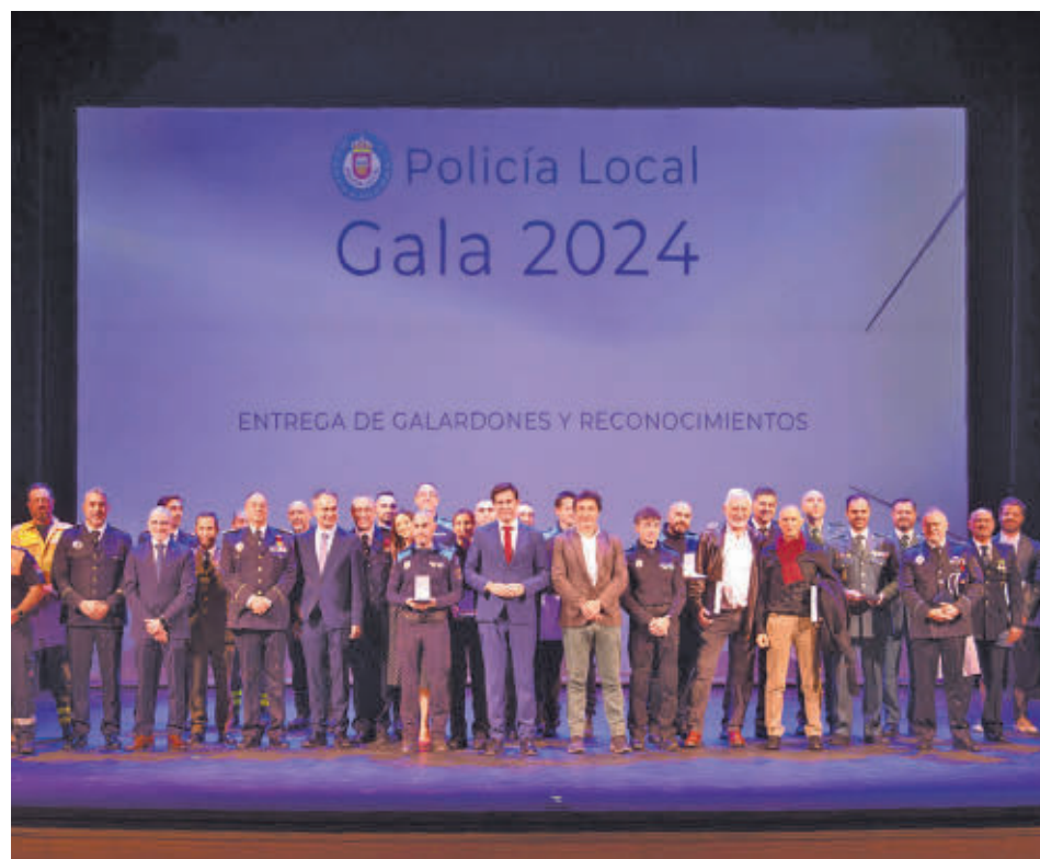
Foto de familia de los premiados

Dentro de los gastos anuales que se contemplan se encuentran, por un lado, la tasa de bomberos, que supone un pago anual de 1,8 millones de euros y que año tras año se ve incrementada ante el crecimiento poblacional. Y, por otro lado, la aportación municipal al Consorcio de Transportes para cubrir el déficit del transporte urbano que, tras la regularización del pasado ejercicio, hay un incremento de algo más de 27.000 euros, cifra que se verá incrementada en el futuro por la configuración de líneas y los servicios en el municipio.