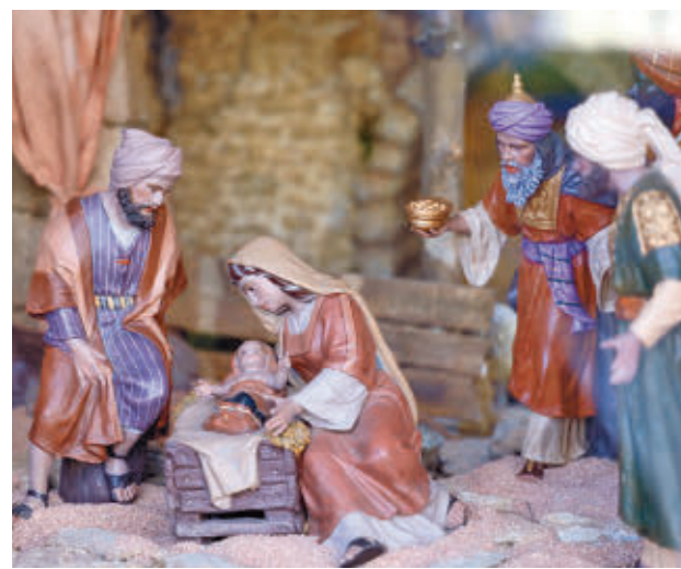
Es obra de la Asociación de Belenistas de Madrid