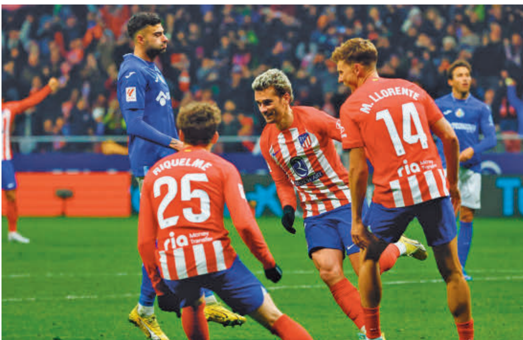
Griezmann le metió la pasada temporada cinco goles al Getafe