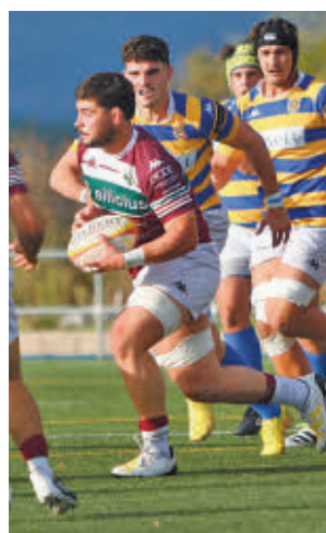
El Alcobendas es colider