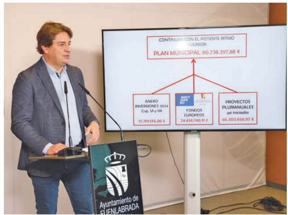
El regidor presentando el presupuesto del presente año 2024 AYUNTAMIENTO DE FUENLABRADA

Por partidas, las políticas de la agenda social aumentan en todos sus capítulos. La promoción social “consolida su crecimiento sostenido” tras la pandemia con más de un 25% de subida acumulada desde entonces, y las políticas de apoyo educativo crecen