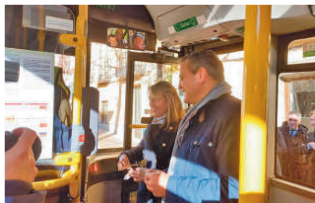
Presentación del sistema de pago digital

De esta forma, los clientes podrán pagar el billete