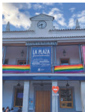
Espacio La Plaza

emergente e independiente. Organizado por la Asociación Juvenil fuenlabreño 'Ya veremos', junto al Ayuntamiento, ha sido difundido especialmente entre las universidades madrileñas con estudios audiovisuales. El Festival constó de dos secciones: una oficial y otra amateur. A la