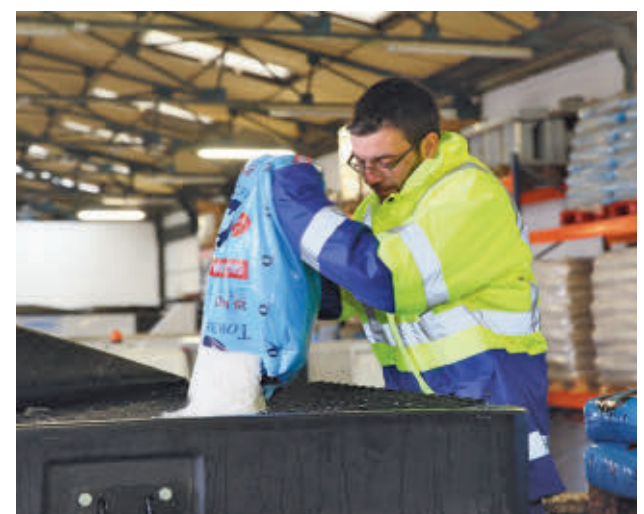
AYTO DE FUENLABRADA

Con la llegada del frío se activa el plan contra las heladas, en el que se incluye el reparto gratuito de sal para que las comunidades puedan esparcirlo en sus accesos, previniendo caídas o accidentes. Se han habilitado varios espacios, que pueden consultarse en la web municipal.