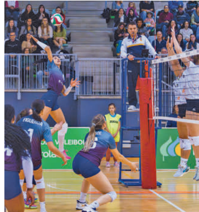
Triunfo por 3-0 ante el CV Sayre Centro