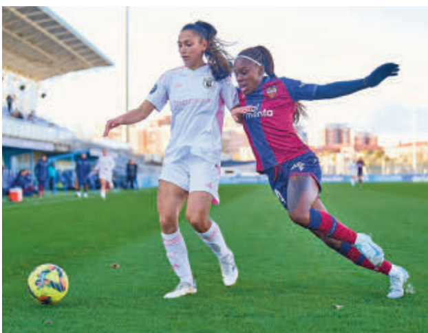
El Madrid CFF sigue escalando posiciones

Lejos de los últimos números del Fuenlabrada, el Alcorcón sigue asomándose al abismo del descenso tras encajar una nueva derrota, esta vez como local frente al Antequera (1-2). Quintos por la cola con 17 puntos (dos menos que el Recreativo, equipo que marca la salvación), los alfareros visitan este sábado el campo de un rival directo como el Atlético Sanluqueño, con el que están igualados a puntos.