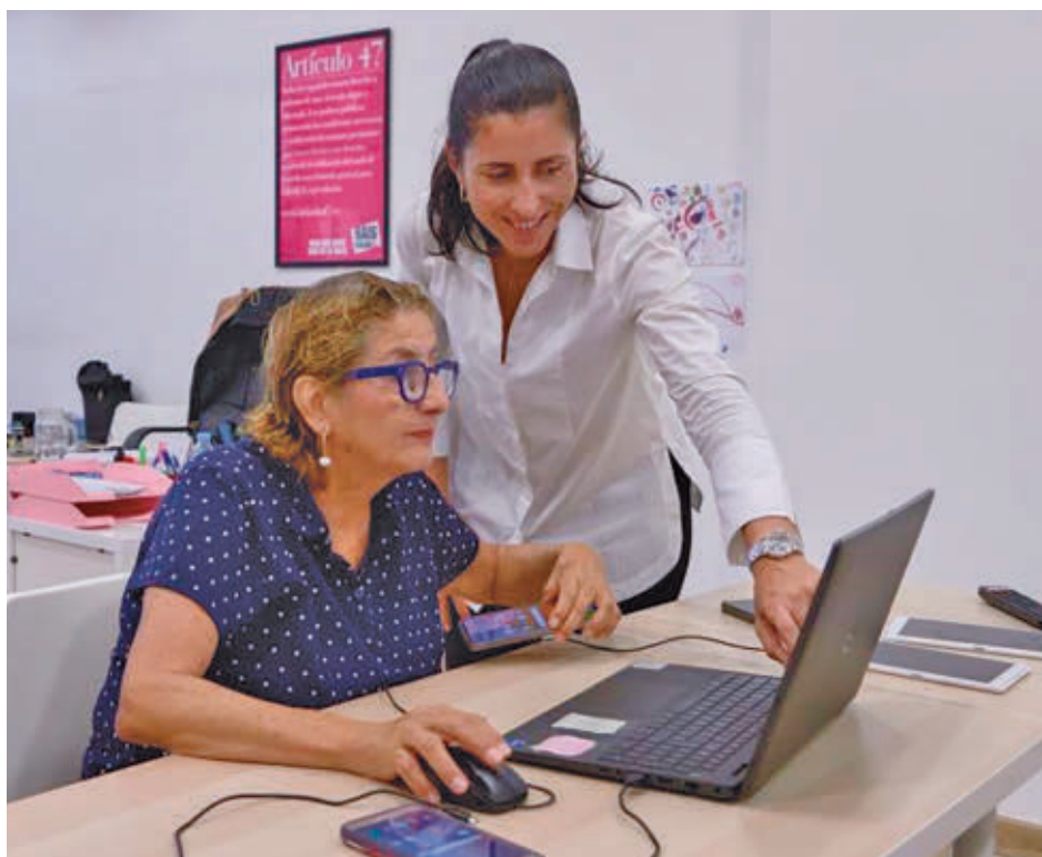
Una de las acciones del programa FUNDACIÓN LA CAIXA

Giró recordó que hay 1.200 millones de personas con discapacidad en el mundo, más de 4 millones en España, y reclamó a las empresas y a la sociedad española que "no les pongan límites". La fundación explica que los técnicos de inserción sociolaboral del programa Incorpora diseñan itinerarios personalizados que valoran el potencial de cada persona y pro-