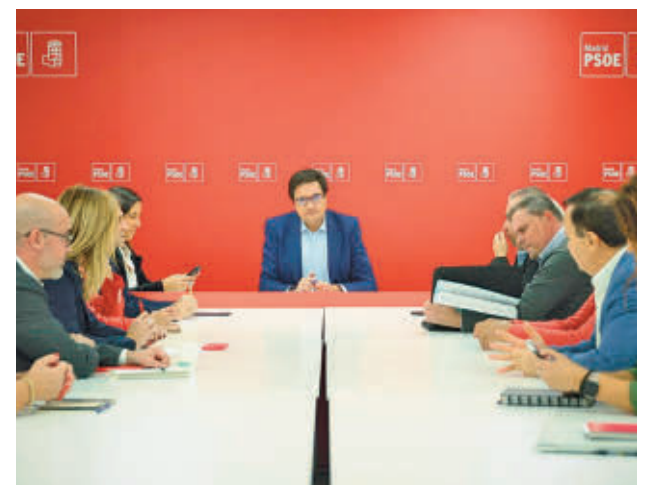
Óscar López se reunió con los alcaldes

López agradeció "el gran trabajo que día a día realizan los alcaldes, alcaldesas, portavoces y concejales en la Comunidad de Madrid, desplegando políticas progresistas y de defensa de los servicios públicos para más de un millón de madrileños" e insistió en que su objetivo es "coordinar nuestra acción de gobierno y oposición en Madrid y plantear una alternativa seria" en la región.