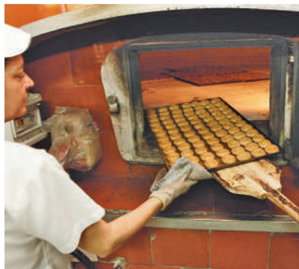
Los mantecados, un clásico de estas fechas

dos en los que nunca pueden faltar las hojadrinas de Alcaudete pequeños bocados de placer con aroma a vino que, desde sus orígenes en 1949, forman parte de la cultura gastronómica an-