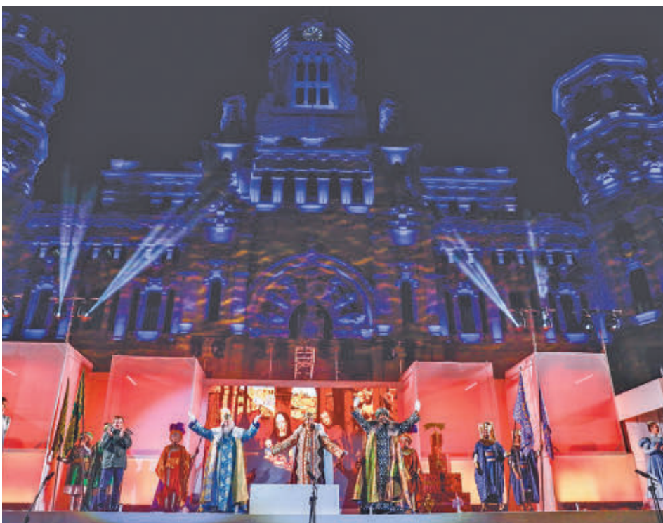
Los Reyes Magos volverán un año más a la capital en la noche "más mágica del año"