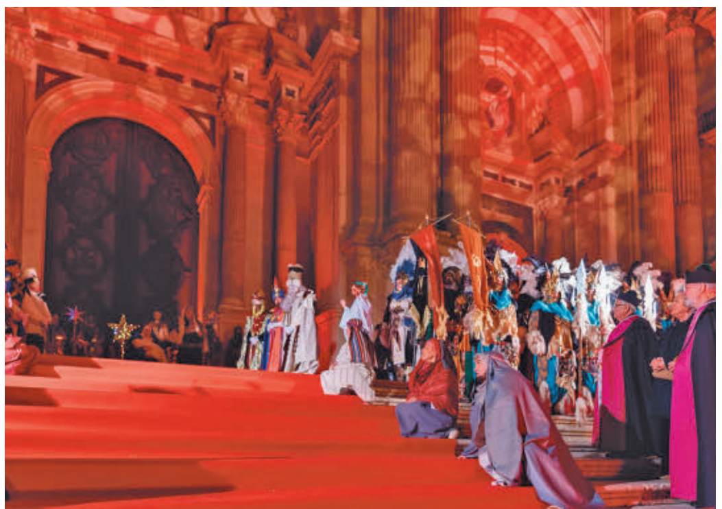
El cortejo recorrerá las calles de la ciudad, haciendo su tradicional parada en la Plaza del Obispo

La ciudad de Vigo, declarada la más navideña del país en 2023, cuenta con una Cabalgata de Reyes que es estática por la mañana y dinámica por la tarde. Los precios de alquiler oscilan entre los 720 y los 1.220 al mes en zonas como Camelias, Praza América o Porta do Sol. Sin embargo, en Alicante para disfrutar de esta tradición en áreas como Plaza de Baix o Corredora, habrá que pagar de 620 a 740.