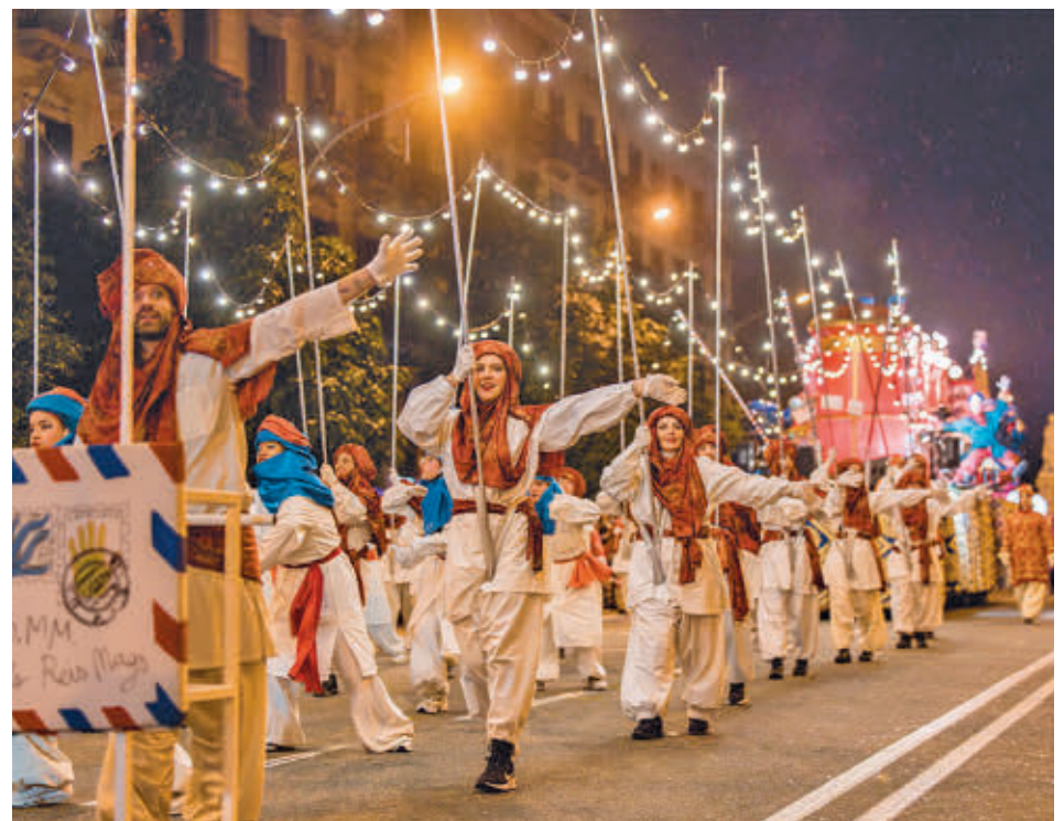
La comitiva real dará color y animará durante todo el recorrido de Melchor, Gaspar y Baltasar