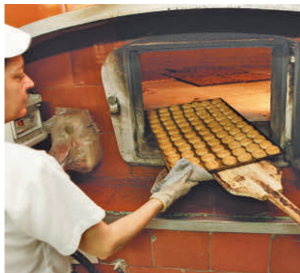
Los mantecados, un clásico de estas fechas

dos en los que nunca pueden faltar las hojadrinas de Alcaudete pequeños bocados de placer con aroma a vino que, desde sus orígenes en 1949, forman parte de la cultura gastronómica an-