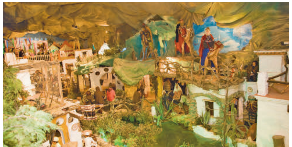
El Belén Viviente de Beas es uno de los más populares