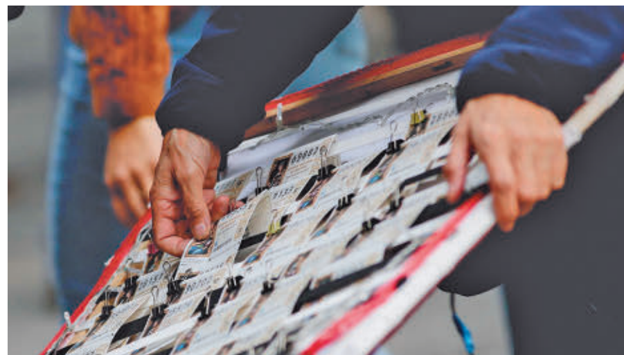
Décimos de Lotería de Navidad E. P.

Síguenos en cadenadial.com y en nuestra app.