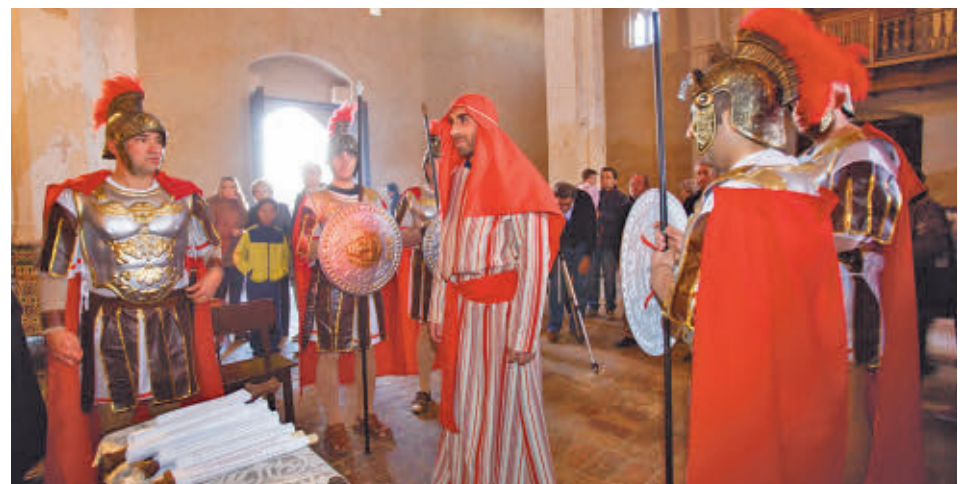
Sanlúcar la Mayor, otra de las localidades de interés turístico