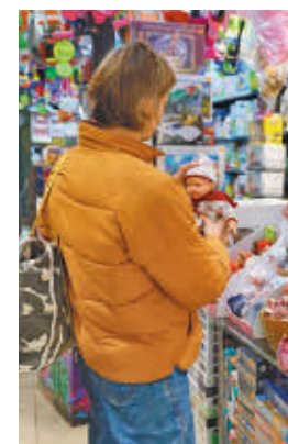
Compras en un negocio

ra la empresa de trabajo temporal Randstad, que añade que entre los perfiles más demandados en estas fechas destacan lo empaquetadores, los carretilleros, los mozos de almacén, los transportistas, los profesionales de atención al cliente,