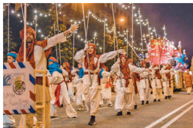
La comitiva real dará color al recorrido de Barcelona

De historia es de lo que puede presumir la Cabalgata de Granada, una de las más antiguas del país. Si se quiere la experiencia completa en un apartamento en zonas como Gran Vía o Reyes Católicos, el coste mensual podría estar entre los 740 y 890 euros.