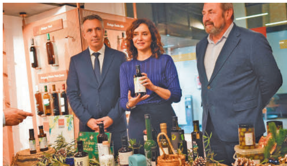
Isabel Díaz Ayuso posa con algunos de los productos de las cestas

ciudadanos a emplear en sus menús festivos la variada y rica oferta de alimentos kilómetro cero, cuya calidad avalan siete figuras específicas: la Denominación de Origen Protegida Aceite de Madrid, la Indicación Geográfica Protegida (IGP) Carne de la Sierra de Guadarrama, la Denominación Geográfica Anís Chinchón, la Etiqueta de Agricultura Ecológica, la Denominación de Origen Vinos de Madrid, la Marca de Garantía Huerta de Villa del Prado y la Denominación de Calidad Aceitunas de Campo Real. "Los madrileños somos muy dados a tener un gran interés por lo internacional, por las corrientes de fuera, por las novedades y tenemos que saber mirar a los lados y conocer nuestros pueblos madrileños: 179 municipios que van desde lo muy local y chiquitito, con maravillosas plazas, fuentes, viñedos, a por supuesto los grandes centros de