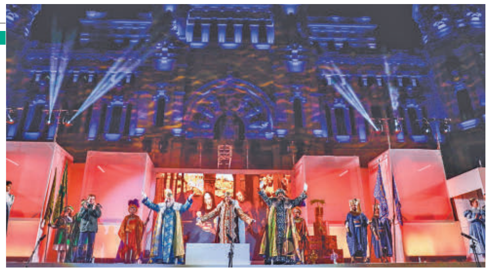
Los Reyes Magos volverán un año más a la capital en la noche "más mágica del año"

De toda la agenda de fiestas, la llegada de los Reyes Magos y sus Cabalgatas son de los eventos más multitudinarios y deseados ● Disfrutarlo desde primera línea, y sin aglomeraciones, tiene un precio