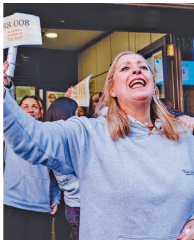
Celebración por el premio Gordo del pasado año EUROPA PRESS

No abonarlo puede significar quedarse sin el premio, ya que, aunque una persona adquiriera siempre con la misma pena o grupo de amigos un décimo de lotería, si este año ese décimo no le ha sido entregado porque no lo abonó, luego no podrá reclamar el premio independientemente