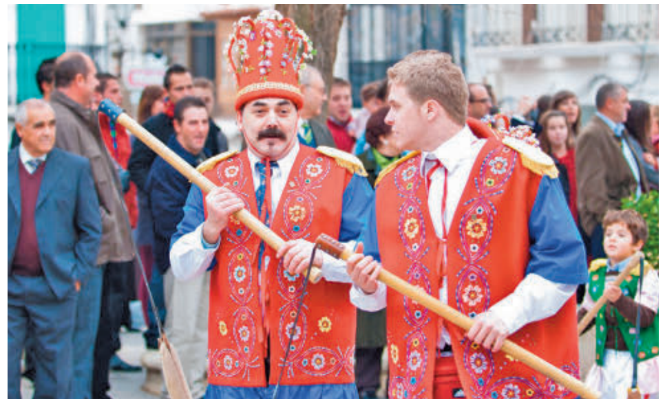
Las Fiestas de Pascua de Puebla de Don Fadrique se celebran el día 25

La oferta cultural también reserva fiestas de gran interés para el 25 de diciembre. La Fiesta del Día de Jeva, en Antequera, y las Fiestas de Pascua de Puebla de Don Fadrique, son dos claros ejemplos.