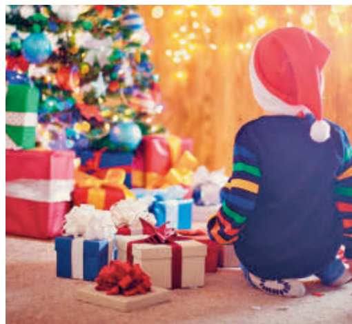
Los regalos, protagonistas navideños

EL PERIÓDICO GENTE NO SE RESPONSABILIZA NI SE IDENTIFICA CON LAS OPINIONES QUE SUS LECTORES Y COLABORADORES EXPONGAN EN SUS CARTAS Y ARTÍCULOS