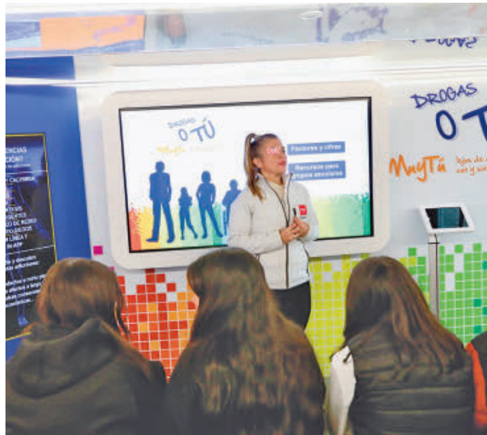
Un momento de la visita al autobús regional

Este pasado miércoles 8 de enero los alumnos de este instituto recibieron una visi-