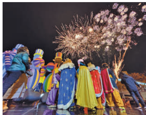
Los fuegos artificiales pusieron el broche final

El buen tiempo contribuyó al gran éxito de la cabalgata donde se repartieron más de 5.000 kilos de caramelos y que puso el broche final al programa navideño más extenso celebrado nunca en Al-