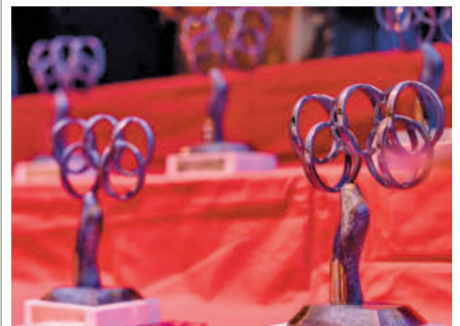
Las aportaciones económicas van de los 300 a los 1.200 €

Los jóvenes de Alcobendas pudieron participar en actividades de promoción de la salud y positivas frente al no consumo, conocer de primera mano un programa de prevención de adicciones y, fundamentalmente, recibir charlas por parte de profesionales para concienciar sobre los peligros que conlleva el consumo de drogas.