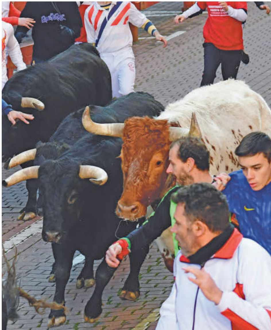
Las reses volverán a las calles las mañanas del sábado 18 y el domingo 19

Desde el equipo de Gobierno municipal aseguran que la programación aunará tradición, cultura, pasión y gastronomía con propuestas para todos los públicos hasta el próximo 26 de enero, aunque uno de los platos fuertes llegará con los Encierros Blancos. En esta ocasión serán protagonistas los astados de las ganaderías Hermanos García Jiménez (18 de enero) y de Ribera de Campocerrado (19 de enero) en un año muy especial para San Sebastián de los Reyes, ya que la localidad conmemora el 500 aniversario de sus tradicionales encierros. El recorrido se iniciará a