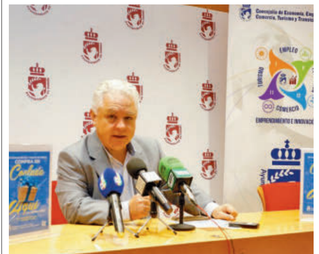
Presentación de la campaña