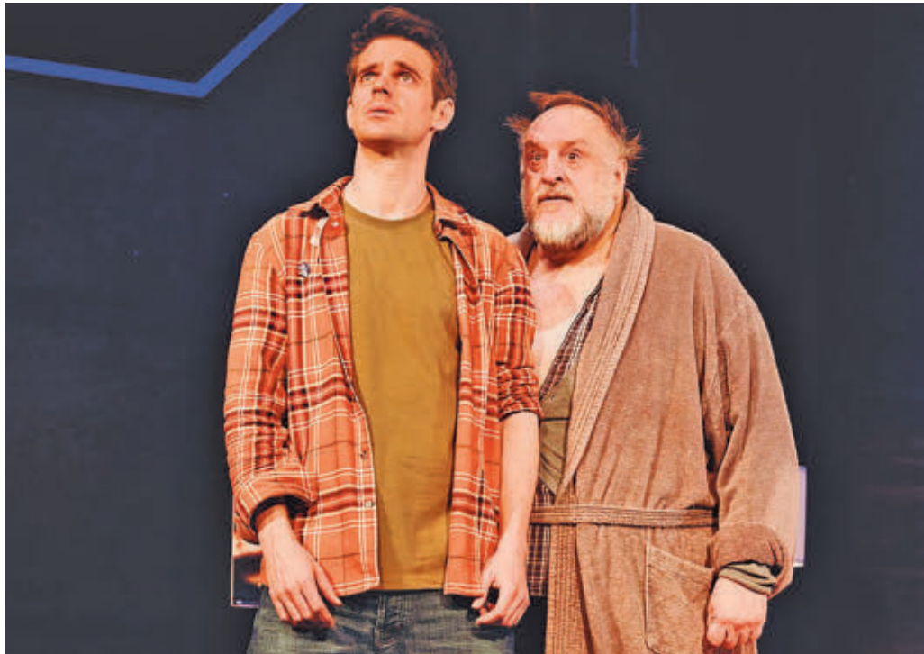
Una escena de la obra de teatro 'Goteras'

HABRÁ UNA ADAPTACIÓN TEATRAL DE LA PELÍCULA 'EL VERDUGO'