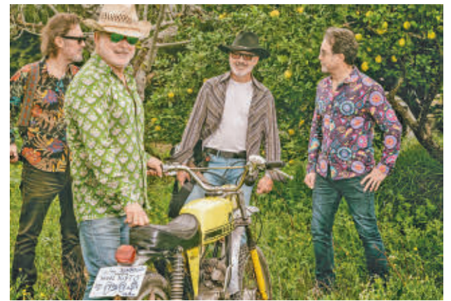
La banda cuenta con el reconocimiento de otros colegas

El líder de No Me Pises Que Llevo Chanclas habla del momento que atraviesa la banda, que celebra su 35 aniversario y mira con ilusión al futuro y a este 2025 ● Se congratula de la gran comunión con el público