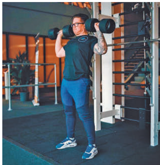
Pesos y posturas adecuadas: Para comenzar con un entrenamiento de fuerza, es fundamental empezar poco a poco con el peso de las barras o las mancuernas. También es imprescindible cuidar las posturas para evitar lesiones indeseadas.

de lograr. Y esas victorias, grandes o pequeñas, te dan un impulso enorme. Además, las endorfinas (hormonas de la felicidad) se liberan durante el ejercicio, por lo que te sientes mejor después de un entrenamiento de fuerza con pesas”.