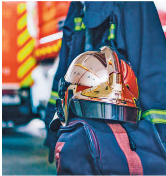
La Comunidad pasará a ser titular de todos los medios materiales CAM

EL GOBIERNO REGIONAL ASUME LOS GASTOS DE FUNCIONAMIENTO Y DE PERSONAL