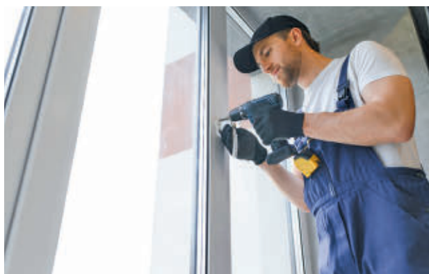
El Instituto Municipal de la Vivienda ha gestionado las ayudas

Se han concedido 413 por importe superior a 190.400