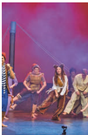
Hubo espectáculos variados