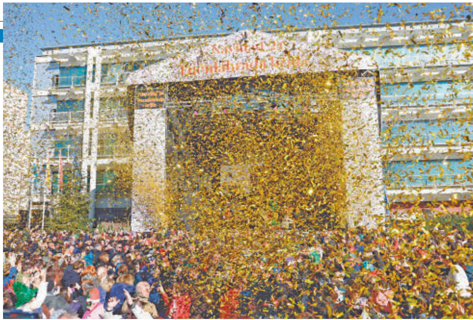
Muchos de los actos han contado con multitud de asistentes

En el recorrido se concentraron miles de personas para saludar a Melchor, Gaspar y Baltasar y disfrutar con ellos de un ambiente muy festivo