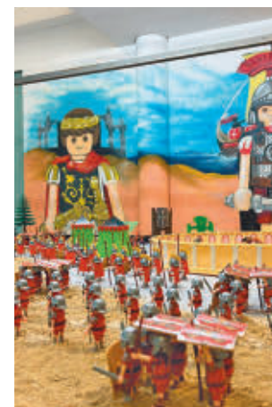
La muestra de Playmobil