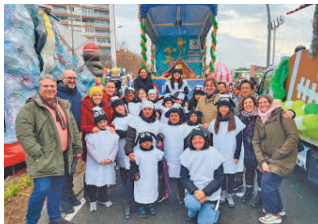
La Cabalgata hizo su habitual recorrido AYUNTAMIENTO DE FUENLABRADA

GenteMadrid.es Consulte la actualidad regional y local en nuestra página web