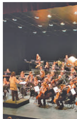
Concierto de Año Nuevo