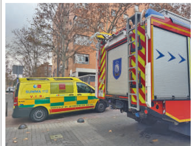
Los Bomberos de Fuenlabrada extinguieron las llamas 112

El año arranca con presupuestos. El pleno dio luz verde a las cuentas que ascienden a 220 millones de euros "y que consolida el crecimiento y la apuesta por la agenda social y la transformación de la ciudad, iniciada hace ya un lustro". Según han asegurado desde el Ayuntamiento, "esto supone un refuerzo a las políticas de apoyo a las familias y los sectores más vulnerables, como las personas mayores, la promoción de una cultura de calidad y la práctica del deporte, la igualdad de género y el apoyo al comercio local y el talento emprendedor". De igual forma, han insistido en que, además, se continúa así con el proyecto de transformación de la ciudad con un plan plurianual de inversiones que supera los 65 millones de euros.