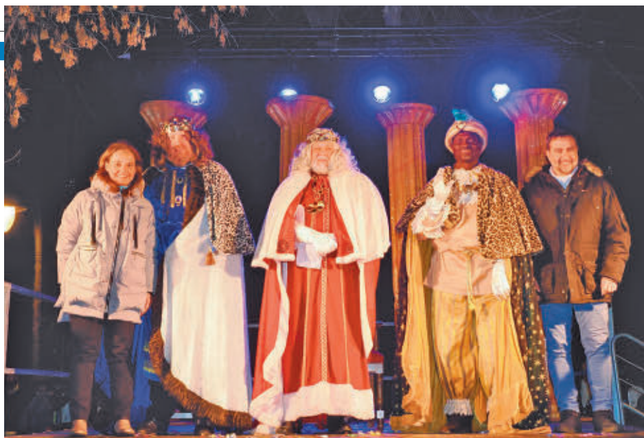
Sus Majestades los Reyes Magos de Oriente fueron recibidos por las autoridades AYTO DE GETAFE

Los Reyes Magos llegaron a Getafe en helicóptero, después de que la ciudad acogiera varios espectáculos y eventos estos días como el videomapping