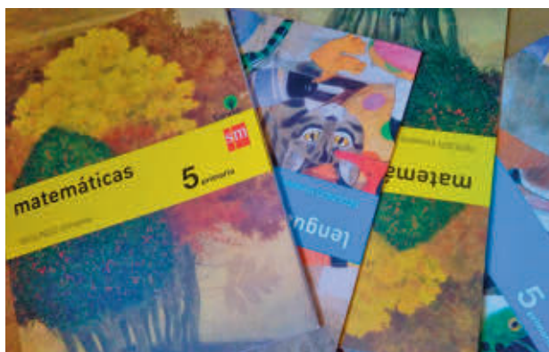
Libros de estudiantes AYUNTAMIENTO DE GETAFE

El objetivo de estas ayudas es que las familias con