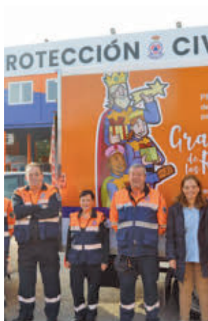
Getafe estuvo en Valencia