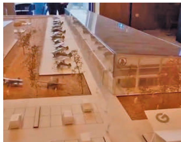
Maqueta de aviones históricos AYUNTAMIENTO DE GETAFE

A lo largo del año 2026 es cuando se proyecta crear en Getafe un museo que recoja exposiciones estáticas como "las exhibiciones en vuelo". Contará con 43 aviones de la fundación, la tercera mayor colección de este tipo de Eu-