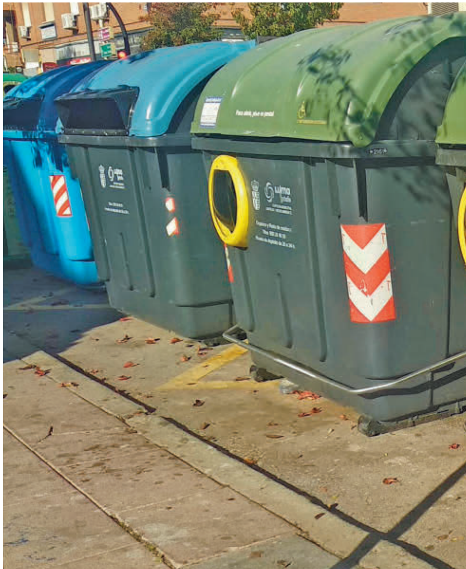
Contenedores de basura en Getafe

Respecto a la citada tasa, cabe recordar que desde el Consistorio ya anunciaron que se bonificará de forma "solidaria y sostenible", entendiendo que no es adecuado aplicar una tasa lineal. Por tanto, será progresiva y será el resultado de sumar una cuota fija que determina el valor catastral de cada vivienda, excluyendo garajes y trasteros, y una cuota variable según el número de habitantes, pero a la que además se pueden