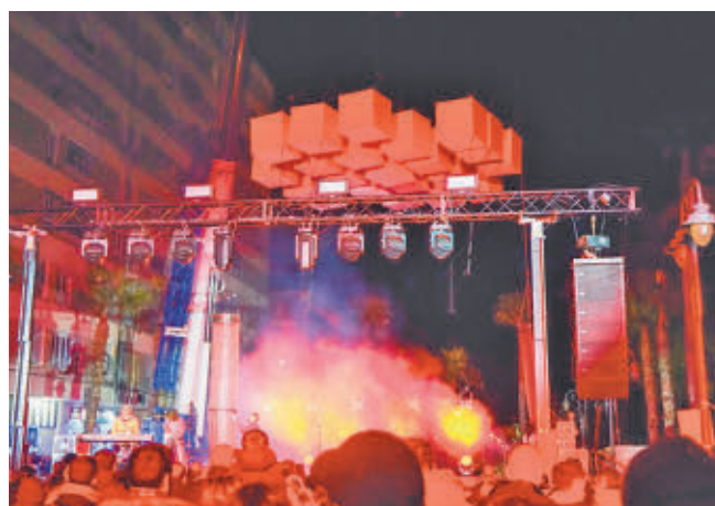
La Plaza de España fue el escenario del espectáculo aéreo

GenteMadrid.es Consulte la actualidad regional y local en nuestra página web