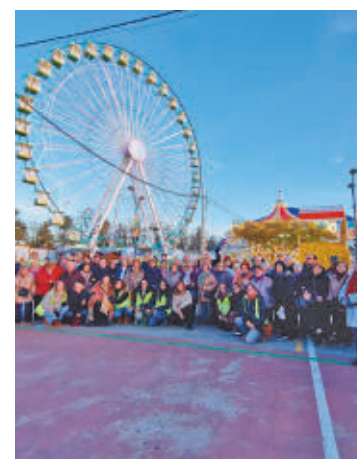
Los mayores asistieron a la feria