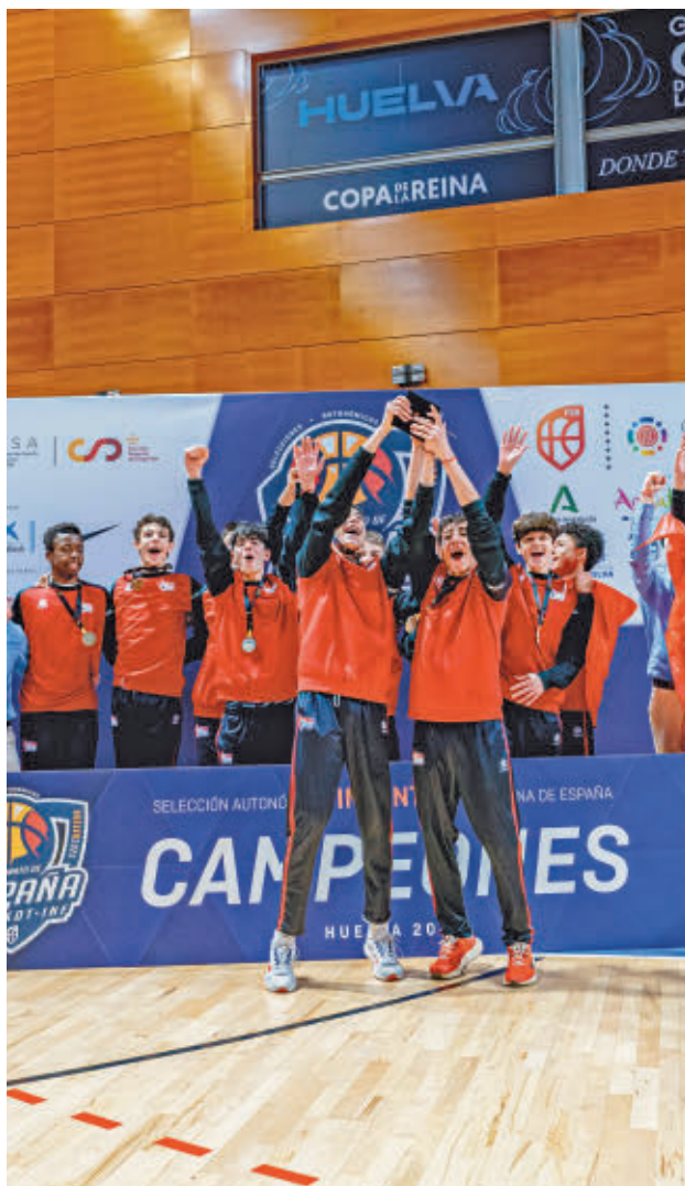
Celebración del infantil masculino FEB

La gran alegría llegaba en el cuadro infantil masculino, donde el combinado madrileño se colgaba la medalla de oro después de imponerse en una vibrante final ante la Co-