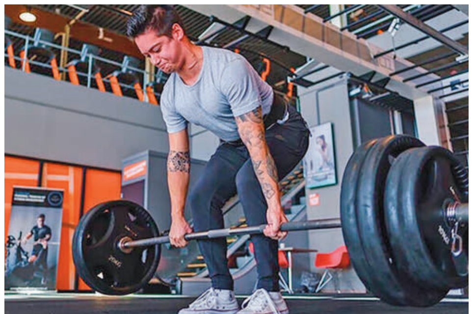
Equilibrio y estabilidad: A diferencia de las máquinas de fitness, las pesas requieren que te centres en el equilibrio y en la estabilidad. La sentadilla, el peso muerto y el press de banca son ejemplos de ejercicios que puedes realizar con pesos montados en una barra.