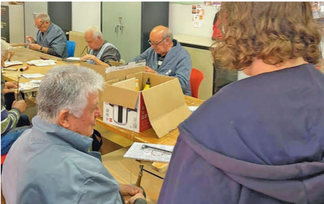
Una de las sesiones de la anterior edición del programa