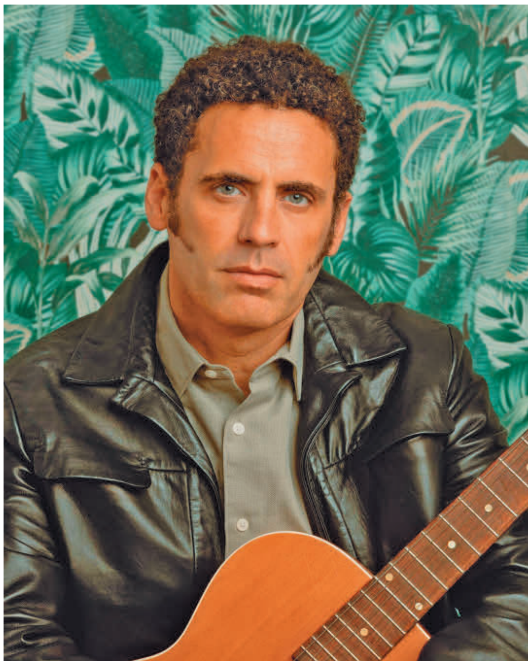
El artista madrileño reconoce que le ha sorprendido la acogida de la canción 'Niebla'

riente, cuando no es así, hay mucha gente que hace su camino y que no sale a lo mejor en redes sociales tanto, pero que está ahí aportando cosas. A mí me gusta ese reposo y esa pausa porque genera posibilidades nuevas".