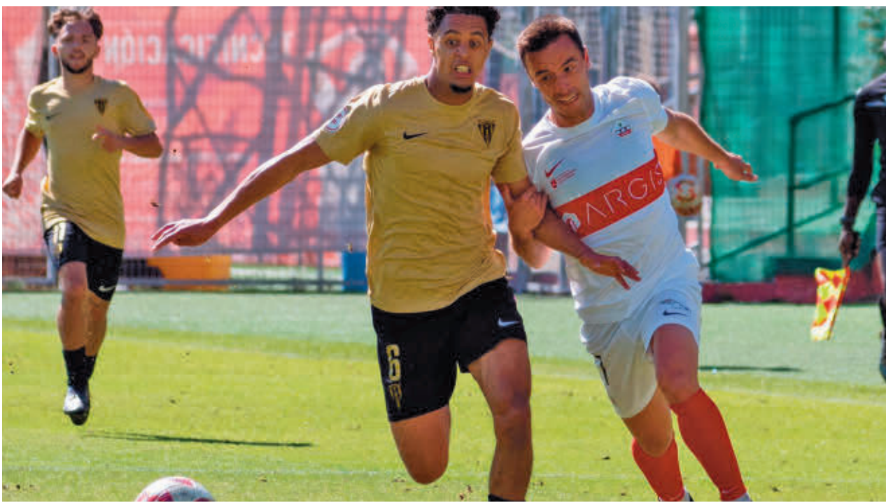
Imagen del partido entre Sanse y Moscardó del 15 de septiembre