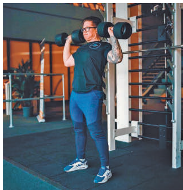
Pesos y posturas adecuadas: Para comenzar con un entrenamiento de fuerza, es fundamental empezar poco a poco con el peso de las barras o las mancuernas. También es imprescindible cuidar las posturas para evitar lesiones indeseadas.

de lograr. Y esas victorias, grandes o pequeñas, te dan un impulso enorme. Además, las endorfinas (hormonas de la felicidad) se liberan durante el ejercicio, por lo que te sientes mejor después de un entrenamiento de fuerza con pesas”.