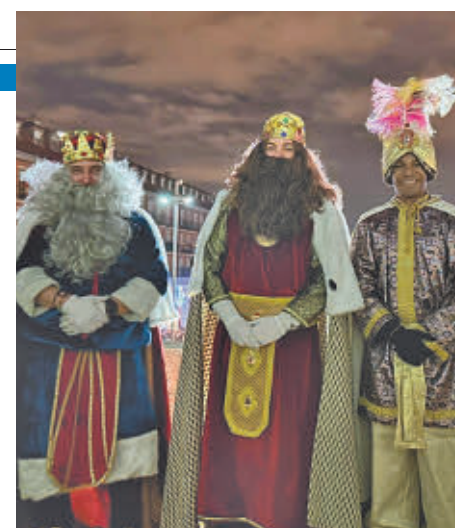
Los Reyes Magos de Oriente