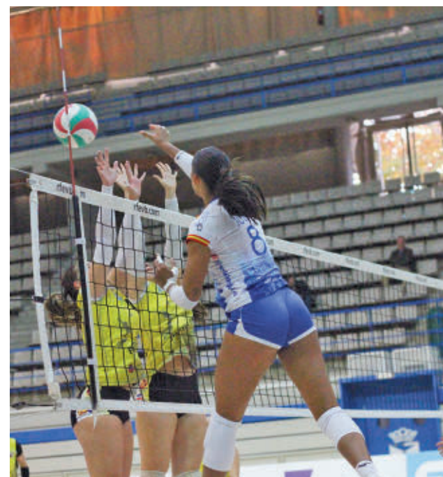
El equipo femenino lidera su grupo