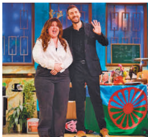
Broncano y Lalachus en 'La revuelta'

EL PERIÓDICO GENTE NO SE RESPONSABILIZA NI SE IDENTIFICA CON LAS OPINIONES QUE SUS LECTORES Y COLABORADORES EXPONGAN EN SUS CARTAS Y ARTÍCULOS