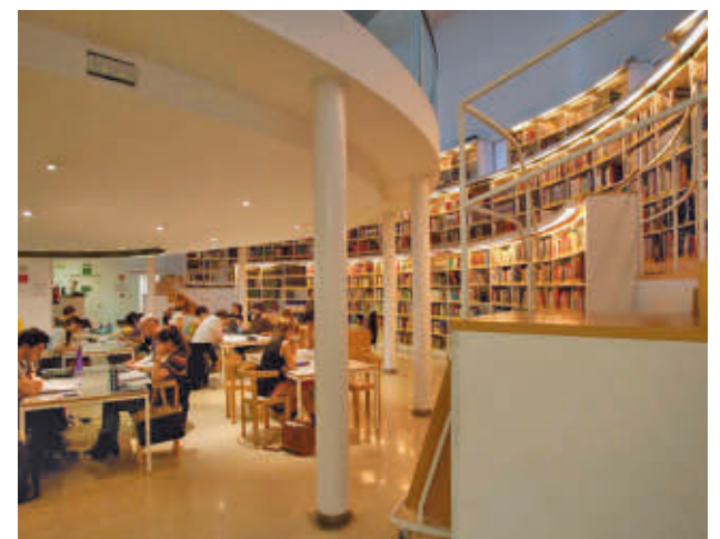
Universitarios preparando sus exámenes

El plazo de presentación de solicitudes será de 15 días hábiles a partir de este jueves 9 de enero. El modelo de solicitud está ya disponible en la página web de la Comunidad de Madrid y será de uso obligatorio para los interesados.