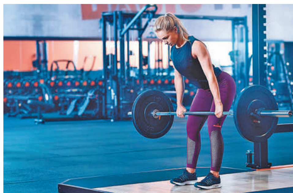
El peso muerto hace trabajar a varios grupos musculares