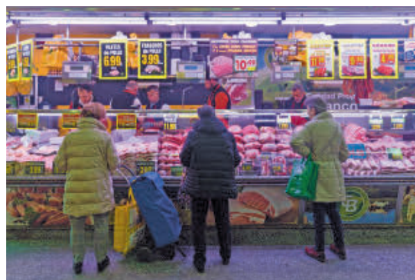
Varias mujeres compran en un puesto de carnicería

como el aceite de oliva, el pan, la leche, la harina, los huevos, los quesos, las frutas, las verduras, los tubérculos, las legumbres y los cereales, que han pasado del 2% al 4%. A su vez, las pastas y los aceites de semillas han pasado del 7,5% al 10%. Con