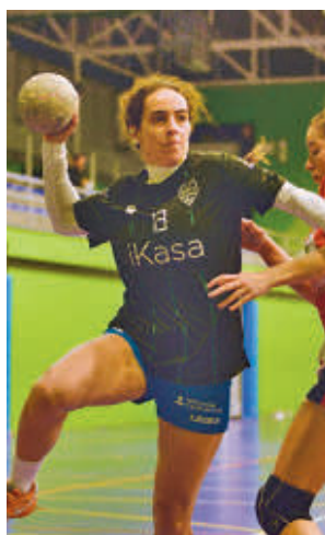
Nueva cita en Boadilla

de enero (19:30 horas) a la competición. La undécima jornada de la División de Honor Oro femenina depara un choque en el Pabellón Mu-