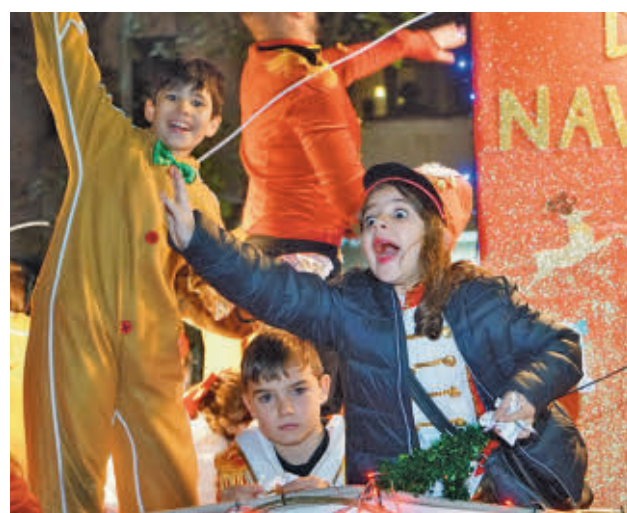
Algunos de los participantes

Los Reyes Magos llegaron a Leganés por la mañana del mismo domingo 5 para visitar a los pacientes del Hospital José Germain, a los niños ingresados en el Hospital Se-