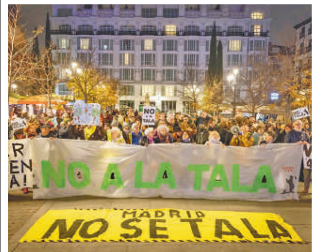
Un momento de la concentración vecinal @MASMADRIDCIUDAD