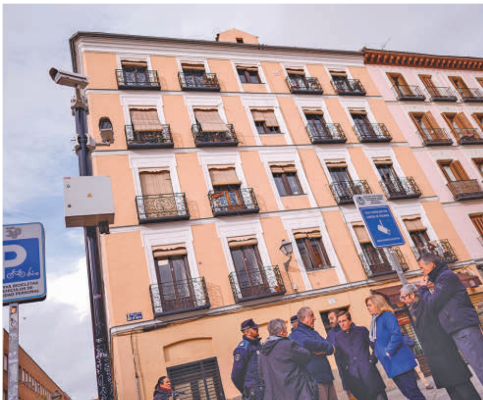
Un momento de la visita del alcalde a la plaza de Dos de Mayo

LOS DISPOSITIVOS CUBREN UBICACIONES ESTRATÉGICAS DE ESTE ENTORNO