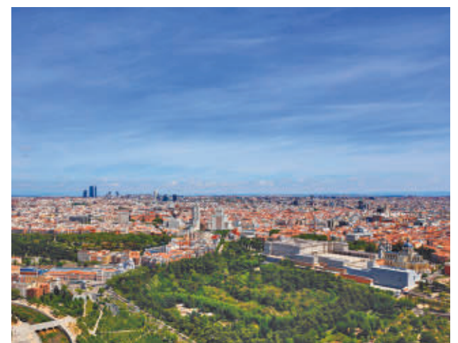
Una panorámica del cielo de la capital

"Madrid respira mejor que nunca. Consolidamos, por tanto, un modelo de ciudad más limpio, más sano, más sostenible y para todos", comenta el alcalde de Madrid, José Luis Martínez-Almeida.