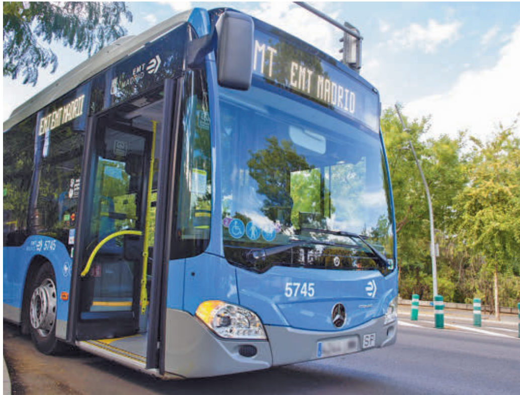
Uno de los autobuses urbanos de la Empresa Municipal de Transportes

OCTUBRE FUE EL MES CON MÁS VIAJEROS Y EL 14 DE MAYO, EL DÍA CON MÁS USOS