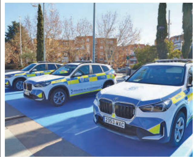
Algunos de los nuevos vehículos adquiridos

Así lo ha comunicado el Ayuntamiento en un comunicado, en el que ha detallado que el evento se realizará en la plaza de toros a las 16:30. Los toros de Ribera de Campocerrado, que unas horas antes habrán participado en el segundo encierro, serán los elegidos para participar en el concurso de recortadores.