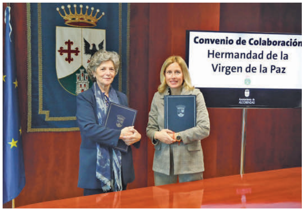
Firma del convenio de colaboración entre el Ayuntamiento y la Hermandad

tronómicas y, cómo no, religiosas. En este marco, el Ayuntamiento de Alcobendas ha firmado un convenio de colaboración con la Hermandad de Nuestra Señora de la Paz para el fomento de las actividades de la asociación en estas fiestas.