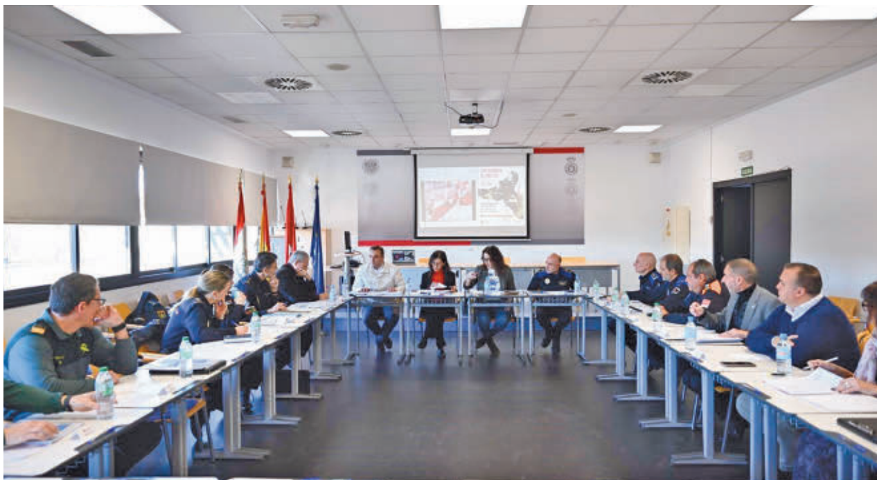
Reunión entre la Junta Local de Seguridad y la Comisión de Festejos

La alcaldesa destacó que "el Ayuntamiento ha elegido los mejores vehículos que permitía el presupuesto aprobado para garantizar, por encima de todo, la seguridad de los agentes y los detenidos".