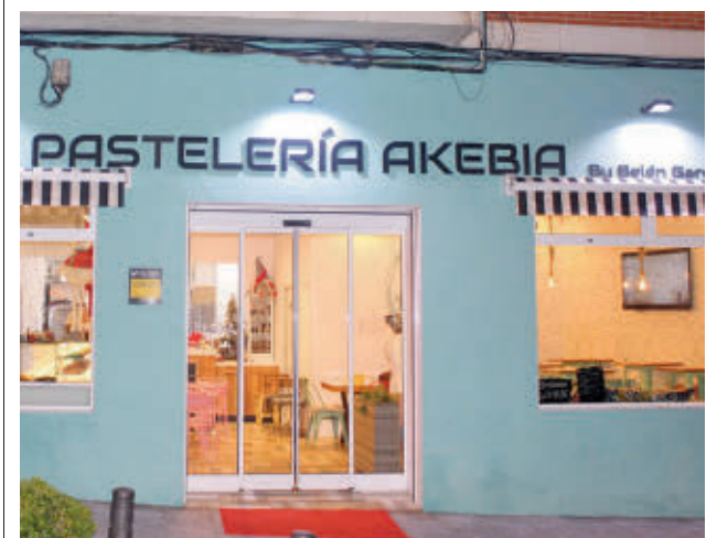
Pastelería Akebia es una de las participantes