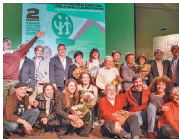
Imagen de archivo de Izquierda Independiente y APADIS