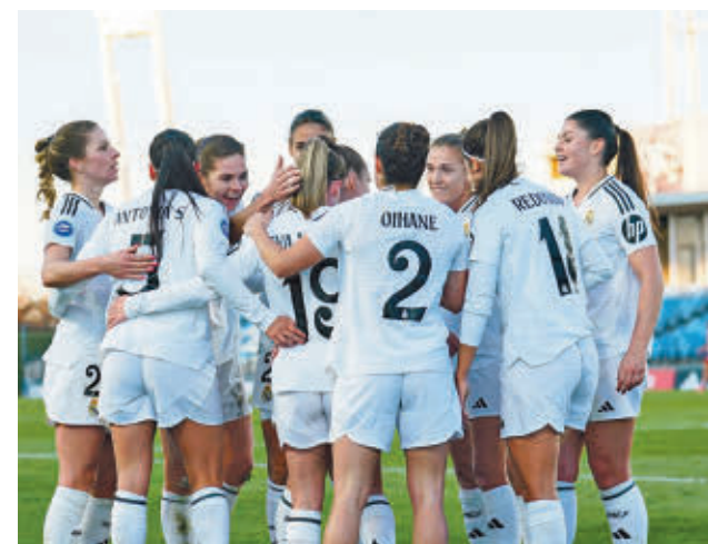
El Real Madrid acumula cinco triunfos consecutivos

rán pasar página para centrarse en la Supercopa de España. El estadio de Butarque de Leganés será la sede de un torneo que tendrá la primera semifinal el miércoles 22 con Barça y Atlético como protagonistas. El jueves 23, Real Sociedad y Real Madrid pugnarán por el otro billete para la gran final programada para el domingo 26.