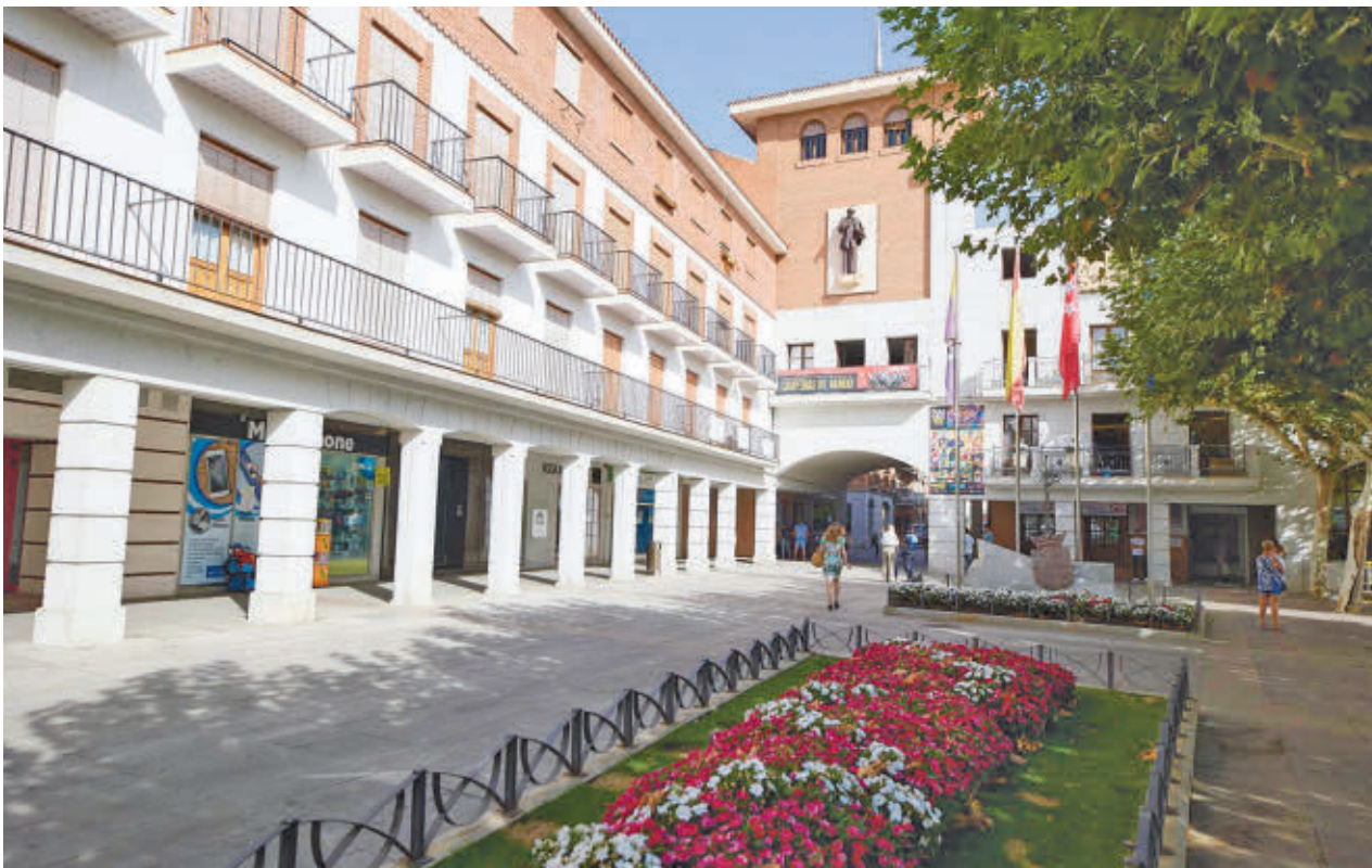
Ayuntamiento de Torrejón de Ardoz