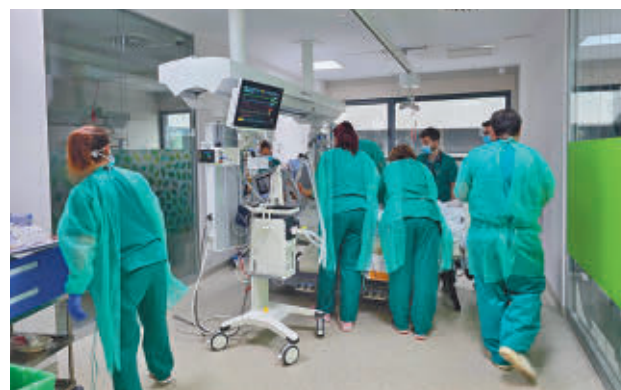
Intervención en un hospital madrileño