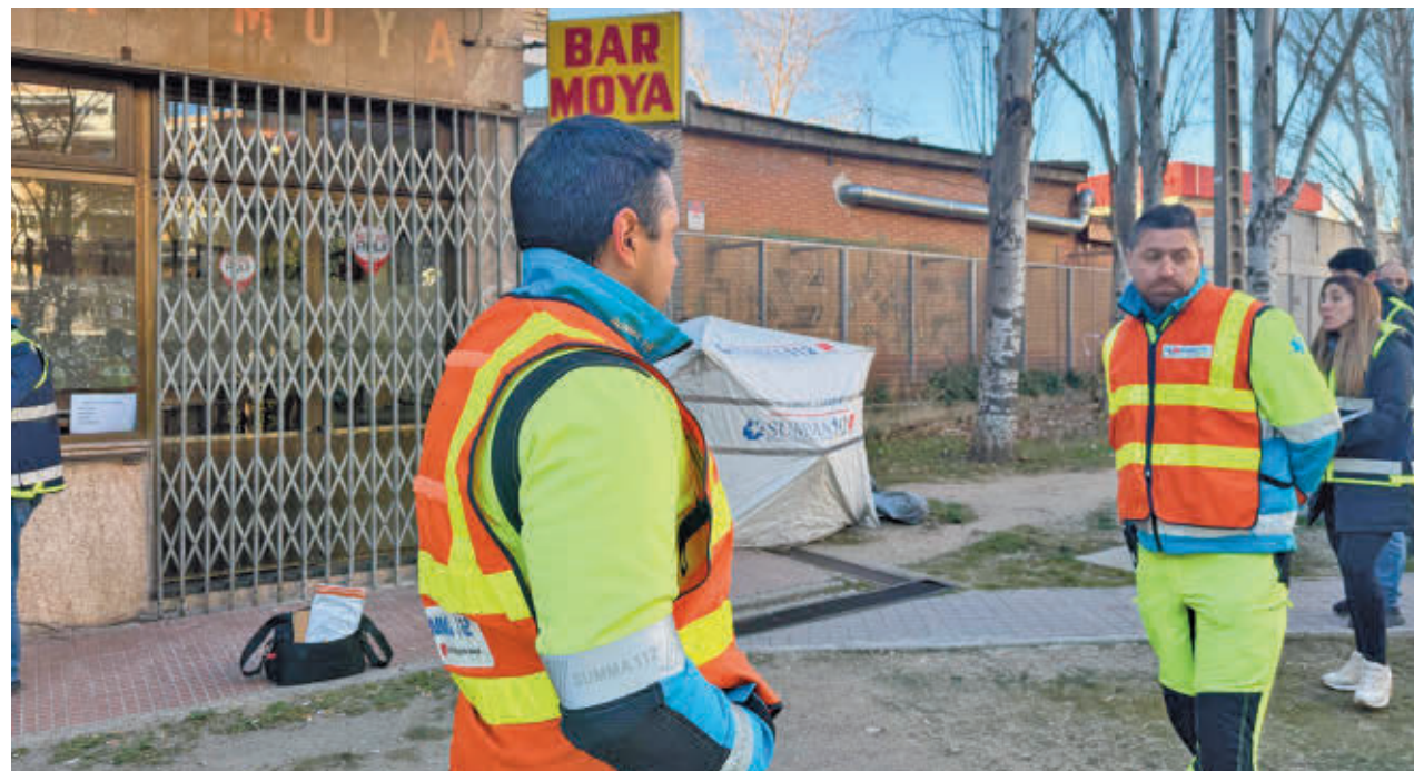
Lugar en el que se produjeron los hechos este lunes