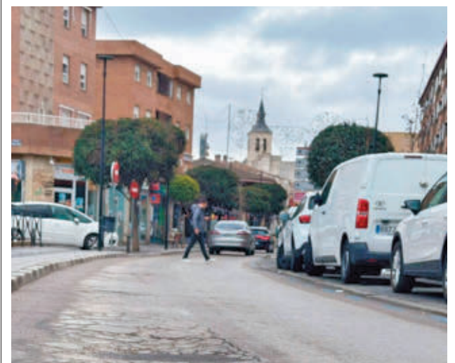
Zona en la que se realizan las obras

Hasta el lugar desplazaron agentes municipales y del grupo V de Homicidios y de la Científica de la Policía Nacional, que se han hecho cargo de la investigación. Los sanitarios solo pudieron certificar su muerte. Además de los balazos en el tórax, la víctima tenía una herida de arma blanca en el cuello.