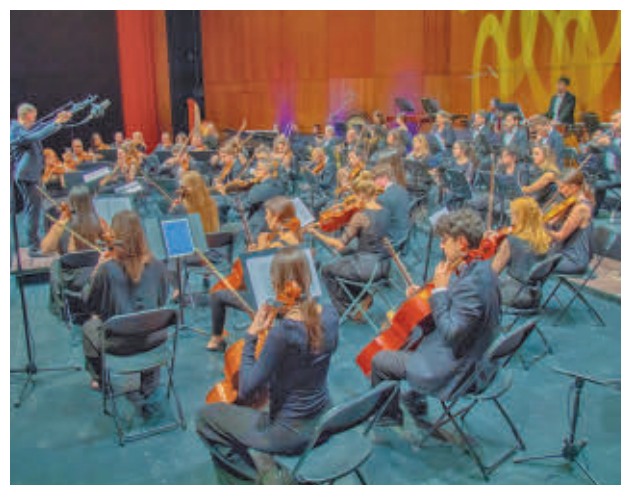
Concierto de la Orquesta Sinfónica Alma Mahler

La orquesta cuenta con 70 instrumentistas.