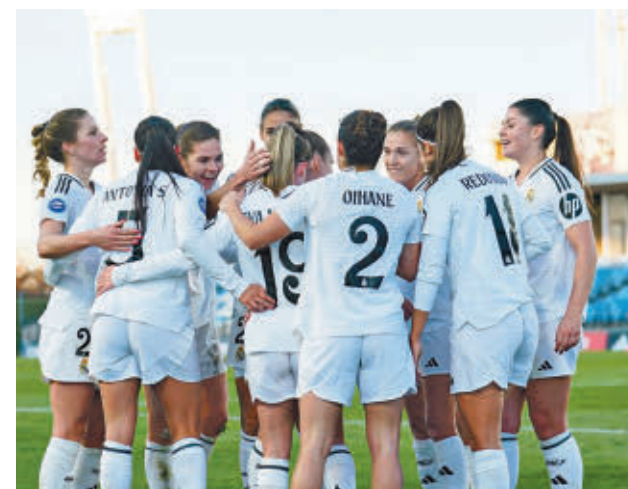
El Real Madrid acumula cinco triunfos consecutivos

rán pasar página para centrarse en la Supercopa de España. El estadio de Butarque de Leganés será la sede de un torneo que tendrá la primera semifinal el miércoles 22 con Barça y Atlético como protagonistas. El jueves 23, Real Sociedad y Real Madrid pugnarán por el otro billete para la gran final programada para el domingo 26.