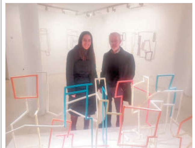
El CEART acoge la obra del escultor Emilio Pascual

Estas campañas se realizan en colaboración con la ONG Zerca y Lejos, organización con la que profesionales del hospital fuenlabreño han trabajado ininterrumpidamente desde hace 15 años.