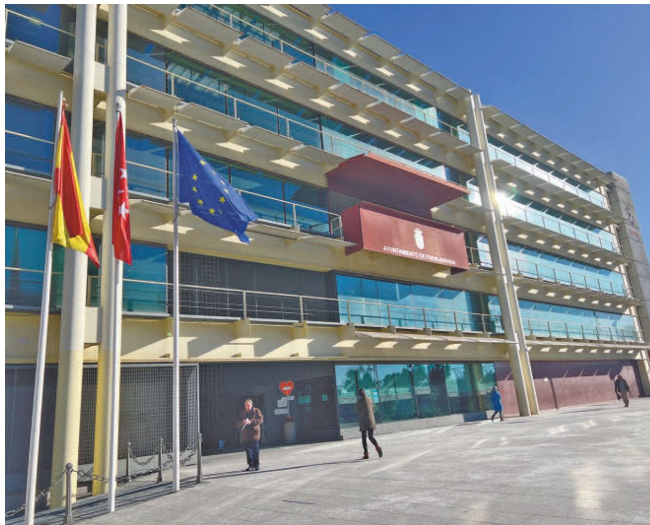
AYTO DE FUENLABRADA