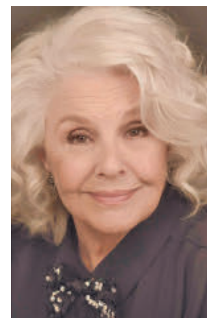
'Tres Corazones Infinitos'