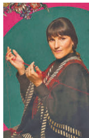
'Chavela, la Última Chamana'