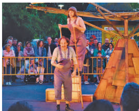
'¡Qué disparate!', de Producciones Chisgarabís