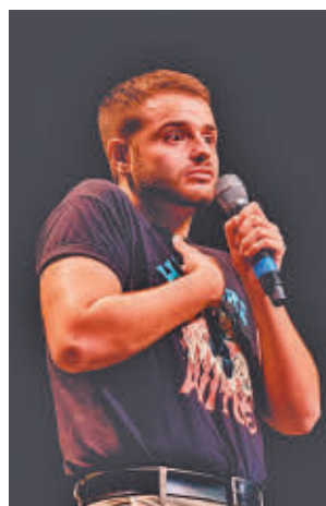
Ger se subirá al escenario