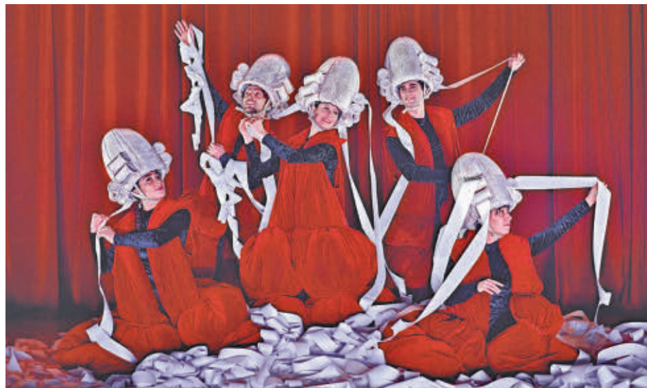
'Va de Bach', una coproducción del Real Teatro de Retiro y Comunidad de Madrid Espectáculo

¡GenteMadrid.es Consulte la actualidad regional y local en nuestra página web