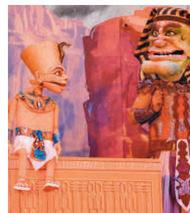
'Tutankamón, el Niño Faraón'