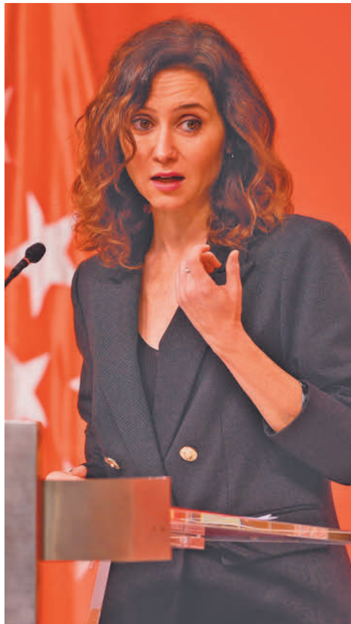
Isabel Díaz Ayuso, durante su intervención

La Comunidad de Madrid ya ha presentado alegaciones a la intención del Ministerio de Política Territorial y Memoria Democrática de declarar la Real Casa de Correos como Lugar de Memoria Democrática. El Ejecutivo autonómico expone como argumentos la vulneración de las competencias de la Comunidad de Madrid en materia de gestión de su patrimonio, “defensa del patrimonio histórico y el ataque a una institución de autogobierno, además de una