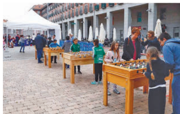
Fan Zone del pasado año

tarque. Este espacio dedicado a los aficionados ya se instaló durante la pasada campaña y este año incluye más actividades para ir abriendo boca para el torneo, que reunirá la próxima semana al FC Barcelona, al Atlético de Madrid, al Real Madrid y a la Real Sociedad.