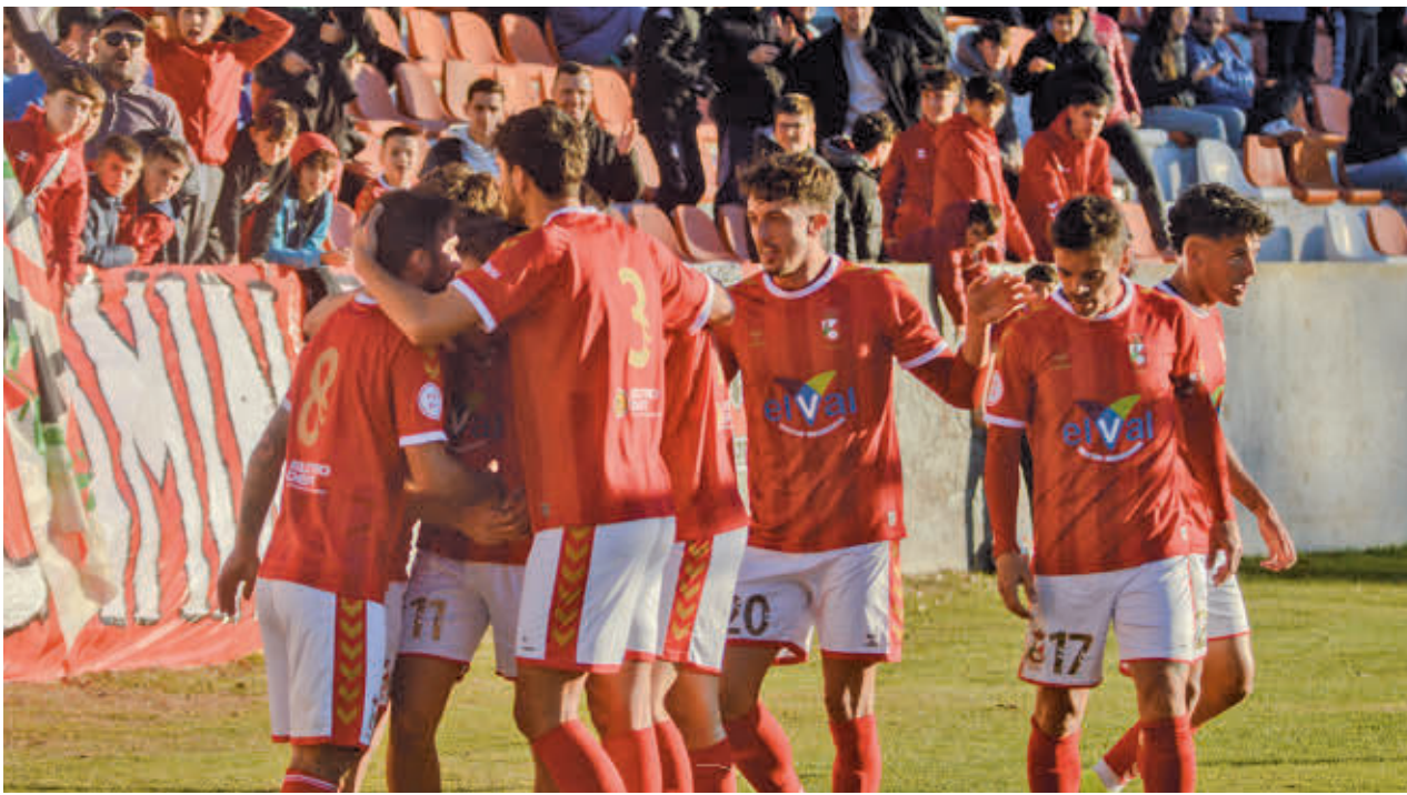
A pesar de sus dos recientes empates ante Canillas y Las Rozas, el Alcalá mantiene una gran ventaja RSD ALCALÁ