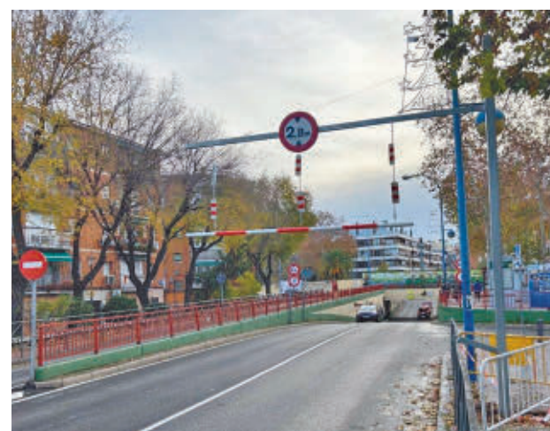
Túnel ‘tragacamiones’ de Leganés

Delgado asegura que durante años se repetía la imagen