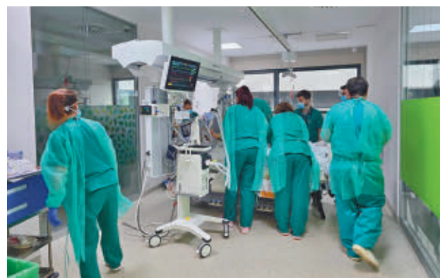
Intervención en un hospital madrileño