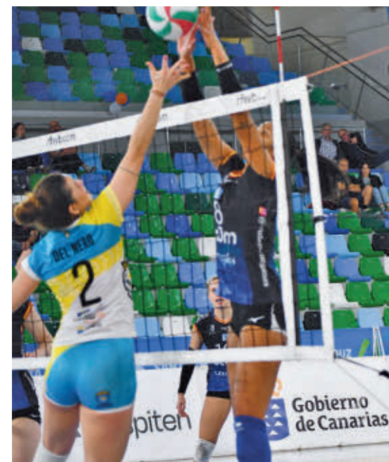
La defensa fue una de las claves del partido