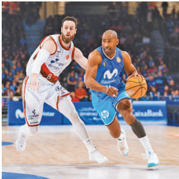
Granger volvió a brillar ante el San Pablo MOVISTAR ESTUDIANTES

Empatado a 14 victorias está un Flexicar Fuenlabrada