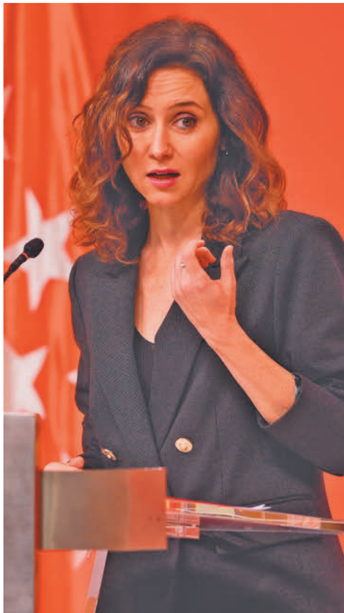
Isabel Díaz Ayuso, durante su intervención

La Comunidad de Madrid ya ha presentado alegaciones a la intención del Ministerio de Política Territorial y Memoria Democrática de declarar la Real Casa de Correos como Lugar de Memoria Democrática. El Ejecutivo autonómico expone como argumentos la vulneración de las competencias de la Comunidad de Madrid en materia de gestión de su patrimonio, “defensa del patrimonio histórico y el ataque a una institución de autogobierno, además de una