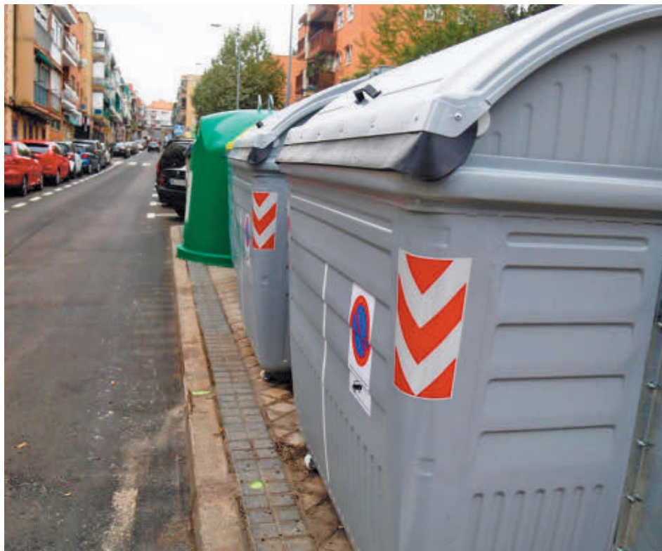
Contenedores de basura en una calle de Leganés