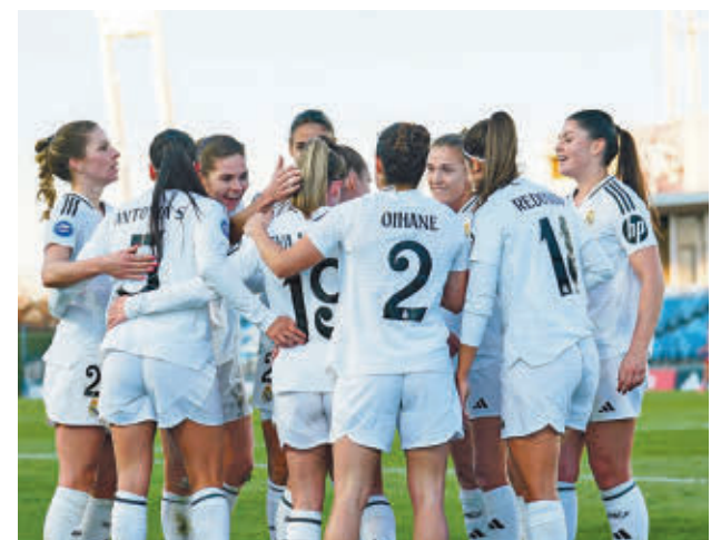
El Real Madrid acumula cinco triunfos consecutivos

rán pasar página para centrarse en la Supercopa de España. El estadio de Butarque de Leganés será la sede de un torneo que tendrá la primera semifinal el miércoles 22 con Barça y Atlético como protagonistas. El jueves 23, Real Sociedad y Real Madrid pugnarán por el otro billete para la gran final programada para el domingo 26.