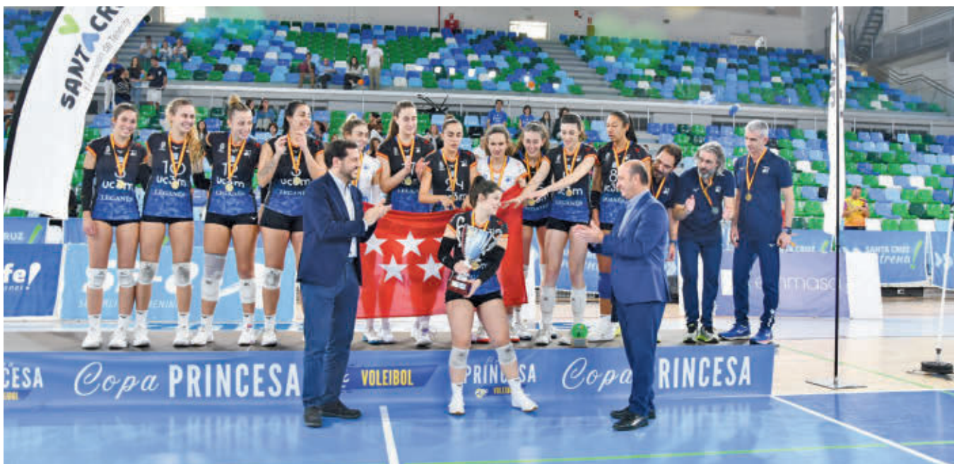
La capitana del UC3M Voleibol Leganés alza la Copa Princesa 2025