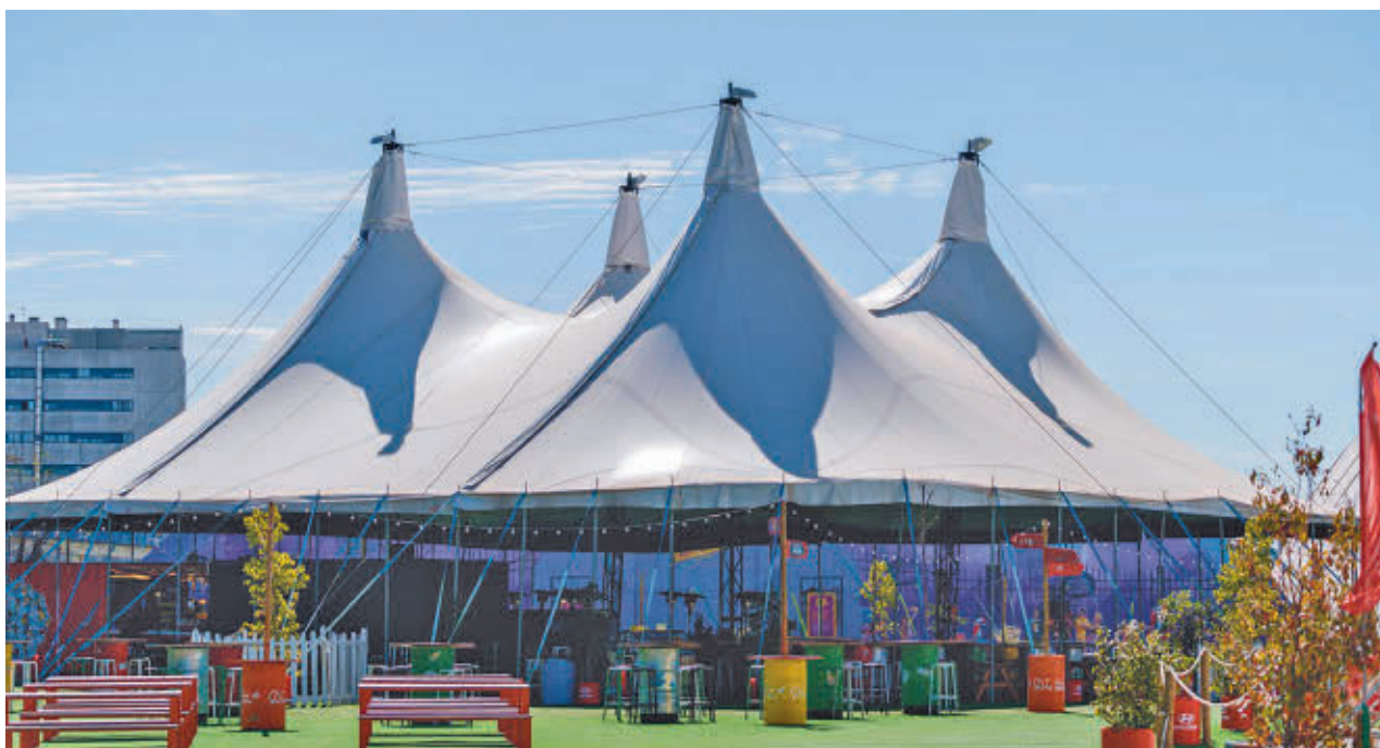
Una de las carpas del Espacio Ibercaja Delicias