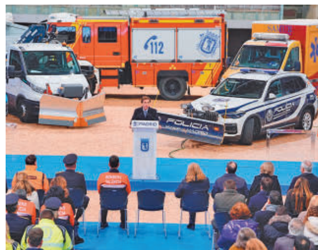
Un momento del acto de reconocimiento

Almeida les agradeció "estar a la altura de nuestra historia y de nuestra misión como capital de España al