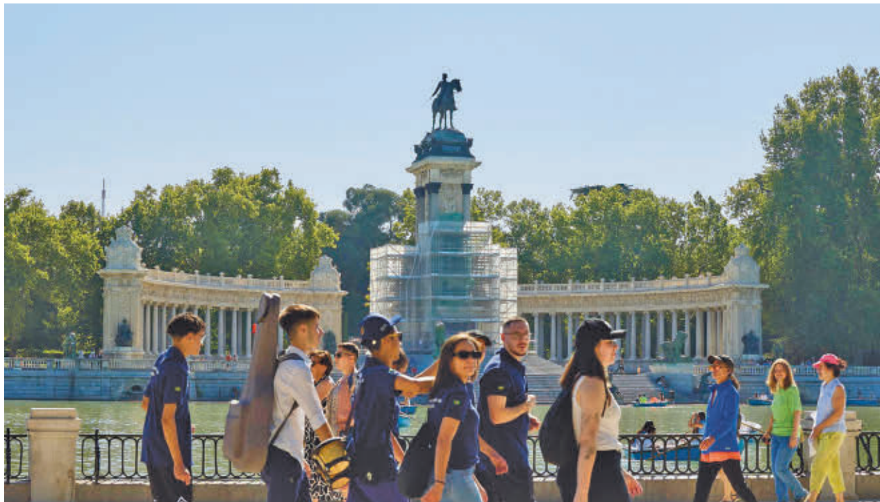
Alrededor de 18 millones de personas visitan el Retiro al año, según datos del propio Ayuntamiento de Madrid

GenteMadrid.es Consulte la actualidad regional y local en nuestra página web