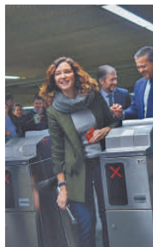
Díaz Ayuso en Atocha

vestíbulo remodelado de la Estación de Metro de Atocha, que cuadruplica su superficie (2.000 metros cuadrados en lugar de 400) y donde destaca el memorial de homenaje a las víctimas de los atentados del 11 de marzo de 2004. “Va