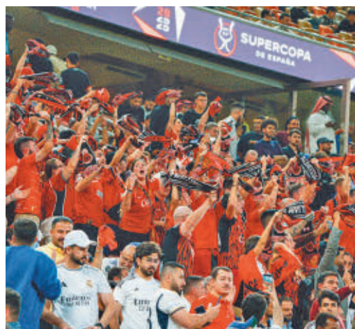
Aficionados del Real Madrid y el Mallorca en Yeda

EL PERIÓDICO GENTE NO SE RESPONSABILIZA NI SE IDENTIFICA CON LAS OPINIONES QUE SUS LECTORES Y COLABORADORES EXPONGAN EN SUS CARTAS Y ARTÍCULOS