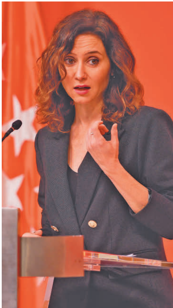
Isabel Díaz Ayuso, durante su intervención

La Comunidad de Madrid ya ha presentado alegaciones a la intención del Ministerio de Política Territorial y Memoria Democrática de declarar la Real Casa de Correos como Lugar de Memoria Democrática. El Ejecutivo autonómico expone como argumentos la vulneración de las competencias de la Comunidad de Madrid en materia de gestión de su patrimonio, “defensa del patrimonio histórico y el ataque a una institución de autogobierno, además de una