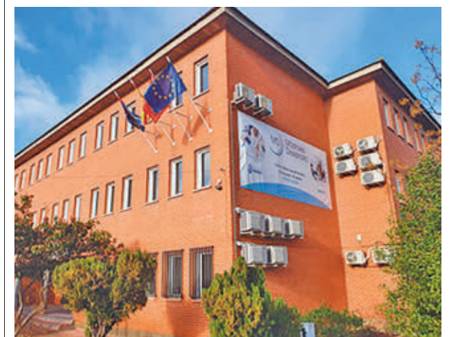
La sede de la institución acogerá los cursos presenciales

Con esta acción, que involucra a cerca de 150 establecimientos, se busca dinamizar el comercio local y la hostelería tras las festividades navideñas. Para resolver dudas, los interesados pueden contactar con Móstoles Desarrollo.