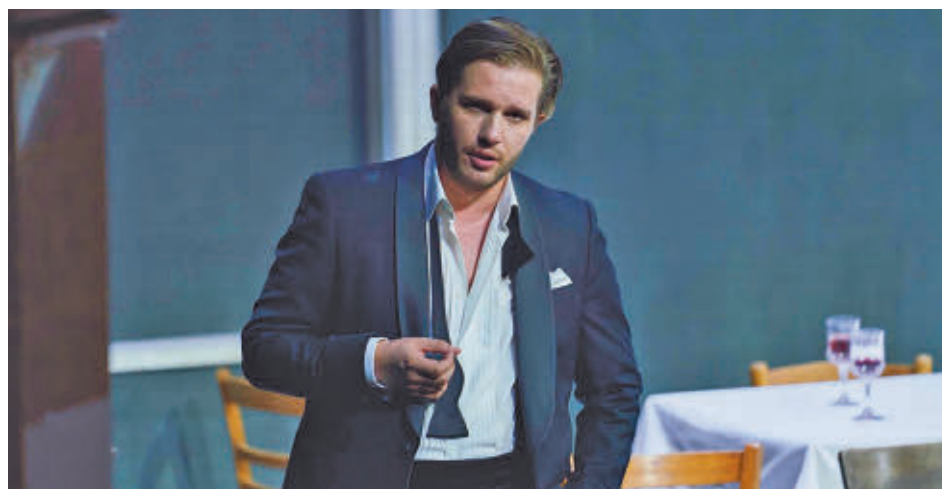
El barítono Iurii Samoilov en una imagen durante la representación

ópera de carácter "íntimo" y que fue una contestación a lo que se consideraba en el siglo XIX lo "operístico". "Es una obra que quiere ser un manifiesto contra lo operístico, que