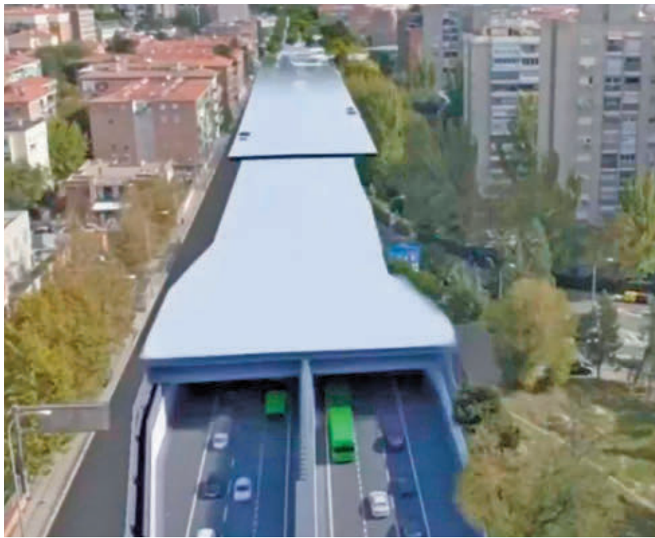
Simulación del soterramiento de la autopista, según el proyecto del Ayuntamiento de Madrid