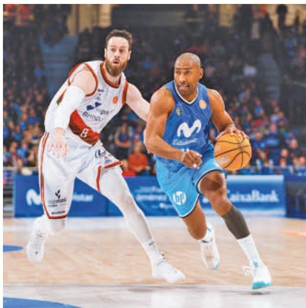
Granger volvió a brillar ante el San Pablo MOVISTAR ESTUDIANTES

Empatado a 14 victorias está un Flexicar Fuenlabrada