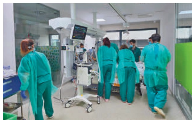
Intervención en un hospital madrileño