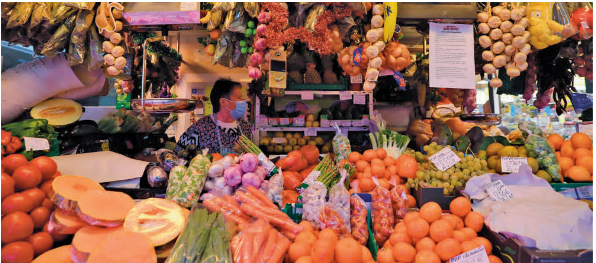
Lo recomendable es que se introduzca en la dieta verduras, fruta y pescado