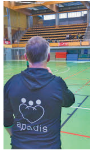
Actividad de APADIS

La marcha partió desde la sede central de APADIS, ubicada en la avenida de Aragón, 14, y recorrió las calles más céntricas del municipio. Finalizó con una concentración