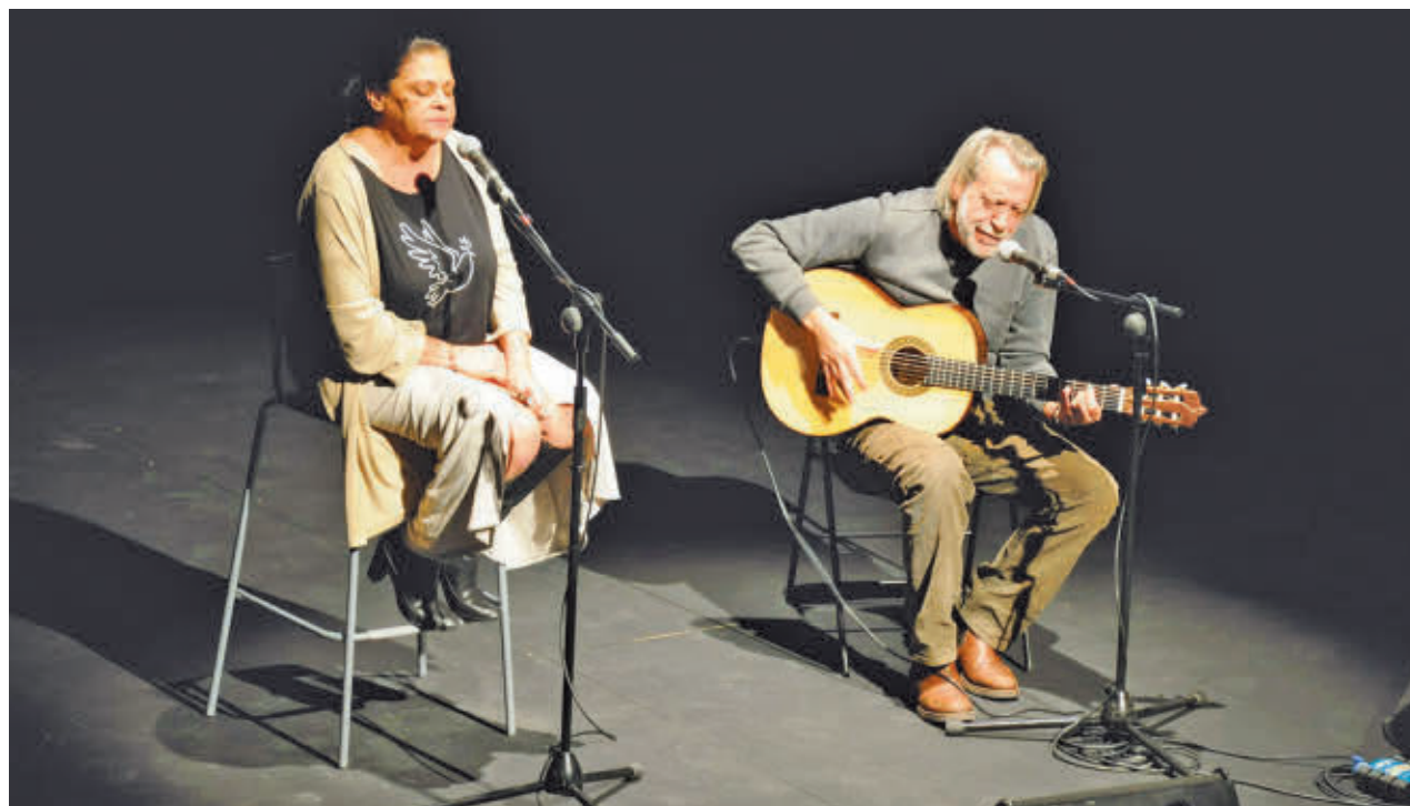
Imagen de archivo de una actividad organizada por Asociación Comisión de la Verdad

Consulte la actualidad regional y local en nuestra página web