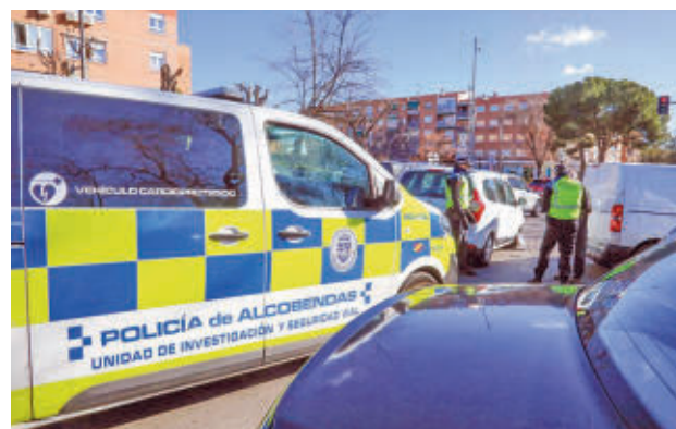
Policía Local de Alcobendas

durante el año 2024. Por ello, la Dirección General de Tráfico (DGT) realizará un reconocimiento público por un dato que, en el año 2023, solo se registró en 10 municipios. Aquel año perdieron la vida en vías urbanas 518 personas, un 30% de ellos en accidentes de tráfico.