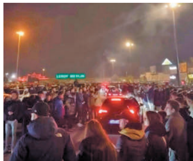
La convocatoria se llevó a cabo en Parque Oeste CSIT-PLA