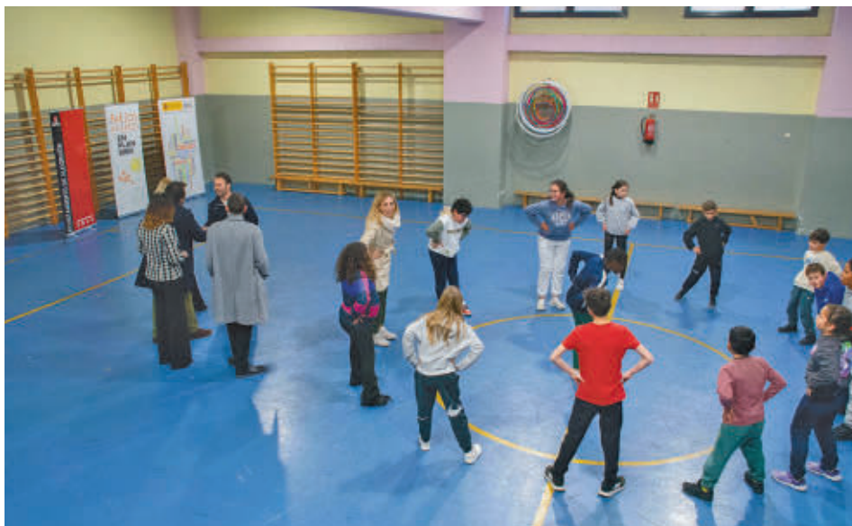
Con esto se aumenta la oferta de ocio activo educativo en horarios y periodos no lectivos

GenteMadrid.es Consulte la actualidad regional y local en nuestra página web