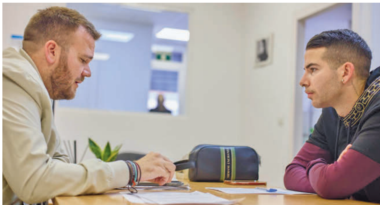
Un técnico asesora a uno de los participantes en el programa FUNDACIÓN LA CAIXA