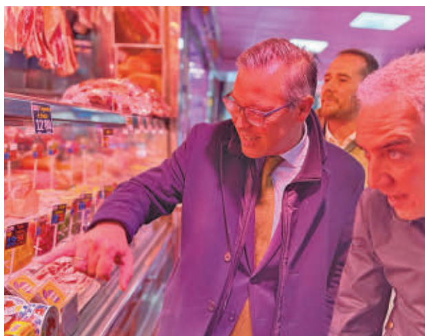
El secretario general recorrió el municipio PP ALCORCÓN