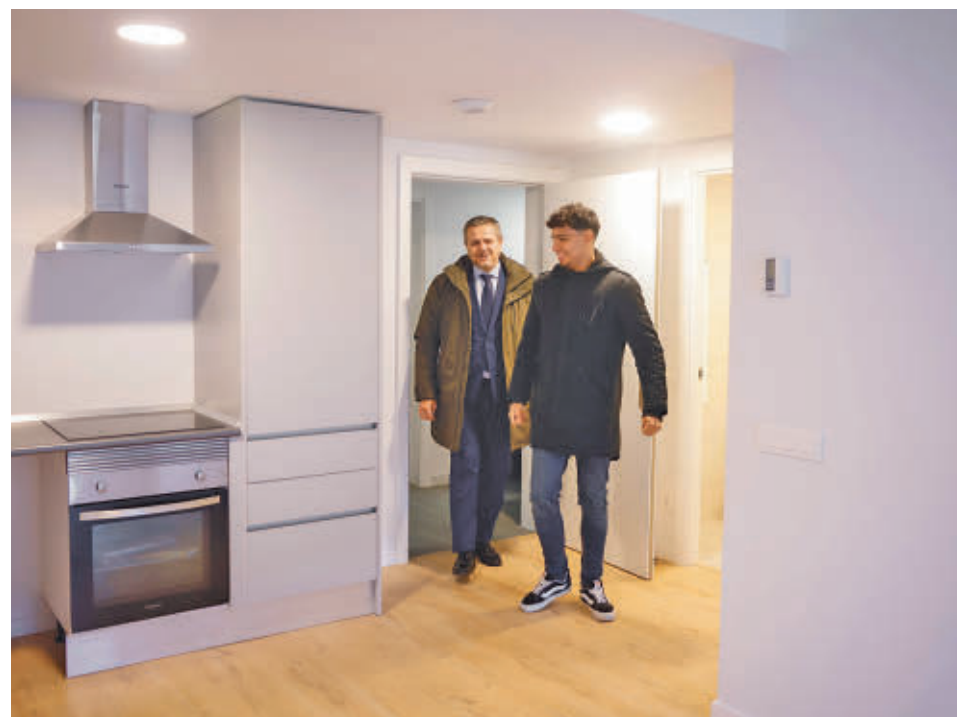
El consejero realiza una nueva entrega de viviendas del Plan Vive en Alcorcón CAM

Precios asequibles, según el Ejecutivo autonómico, pero elevados para el Gobierno local, que ya ha mostrado en repetidas ocasiones su oposi-