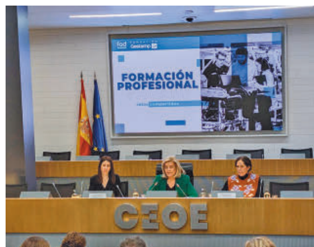
Presentación del informe sobre la FP E.P.

La investigación revela que la Formación Profesional se posiciona como una de las opciones formativas "más valoradas" por la juventud española. El 59% considera que es fundamental para acceder al mercado laboral, destacando su alta empleabilidad y la rapidez con la que facilita la inserción laboral. Casi siete de cada diez (68%) valoran posi-