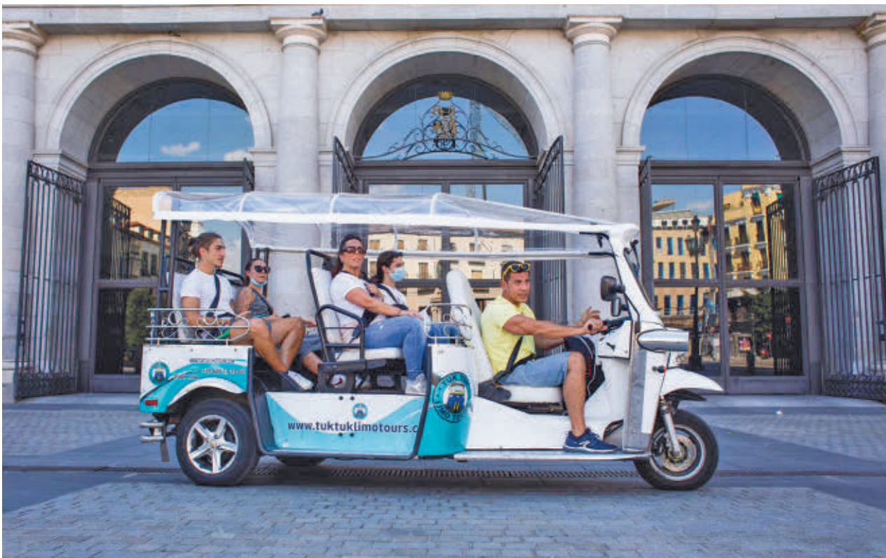
Un tuk tuk circula por el centro de la capital