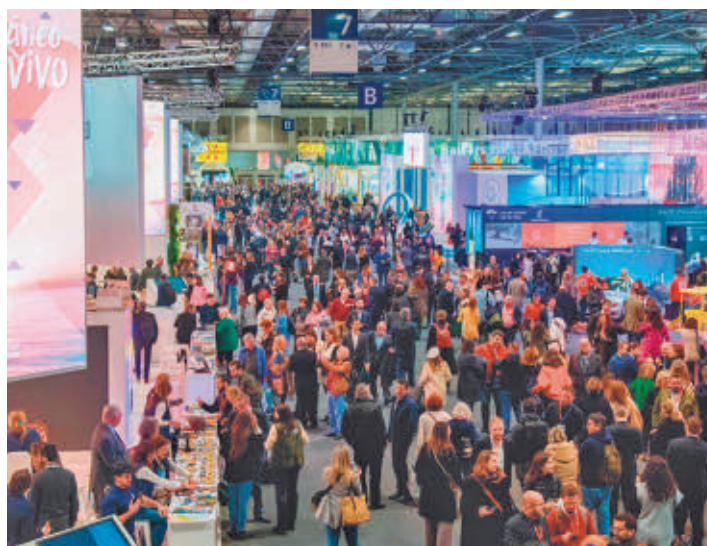
Fitur volvió el año pasado a las cifras previas a la pandemia

Valenciana, todo ello en un evento que durante el fin de semana ofrece una vibrante agenda de actividades interactivas organizadas por los expositores desde musicales en vivo, catas gastronómicas, talleres de artesanía o concursos. Además, los visitantes podrán acceder a información sobre la oferta turística de los destinos, desde paraísos lejanos hasta joyas locales.