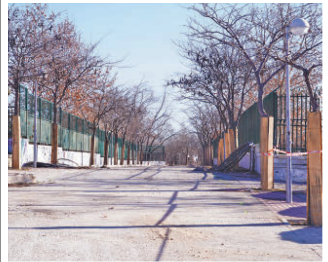
Uno de los espacios de la zona verde vicalvareña