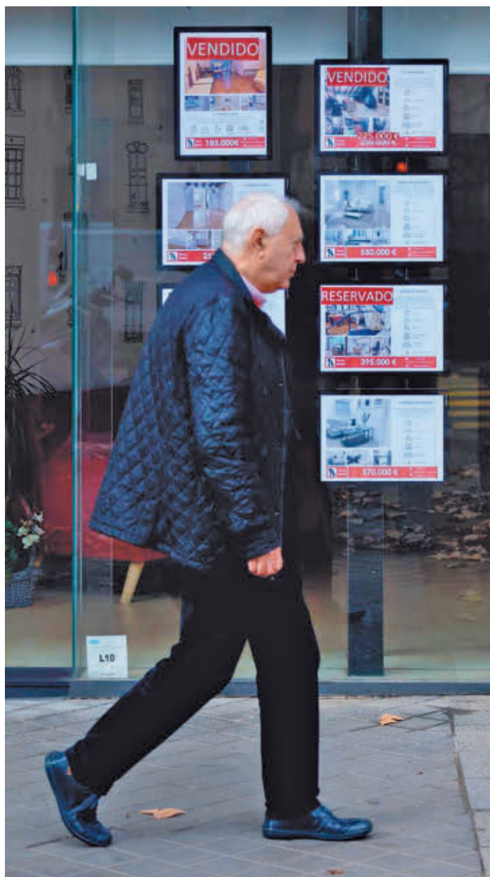
Un hombre pasa frente a una inmobiliaria

El quinto problema es el paro, con un 18,8%. Es tan sólo una décima más que en diciembre, pero entonces era el segundo problema y ahora cae a una inédita quinta plaza, justo antes del mal comportamiento de los políticos (15,5%). Los problemas rela-