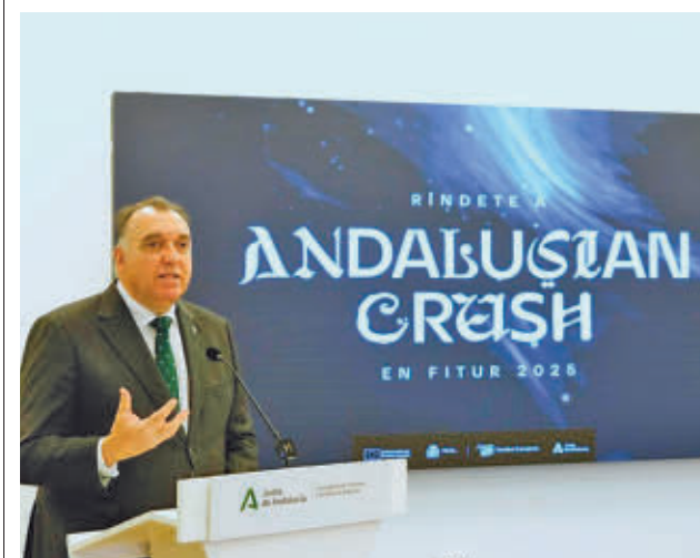
El consejero de Turismo, durante la presentación

Según el consejero Arturo Bernal, "Andalucía transmitirá las claves que marcarán la hoja de ruta en materia turística; el viajero del futuro, la sostenibilidad, la innovación, la conectividad, la concienciación y la convivencia".