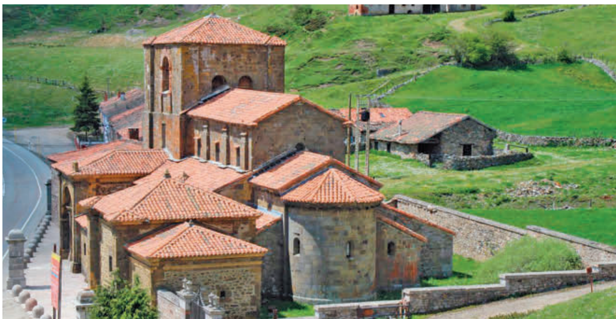
Collegiata de Arbas del Puerto TURISMO DE LEÓN