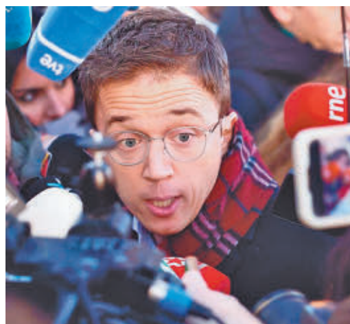
Errejón, a su llegada a los juzgados

EL PERIÓDICO GENTE NO SE RESPONSABILIZA NI SE IDENTIFICA CON LAS OPINIONES QUE SUS LECTORES Y COLABORADORES EXPONGAN EN SUS CARTAS Y ARTÍCULOS