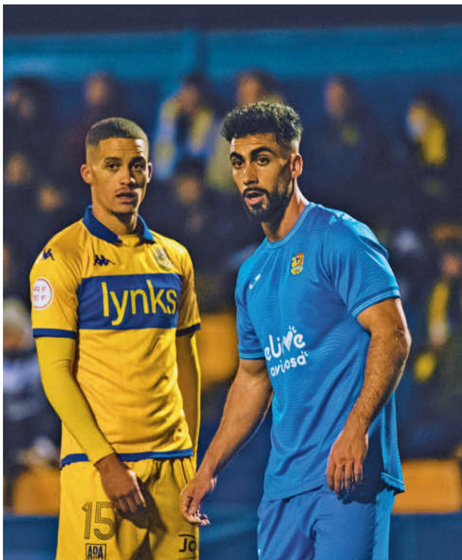
El triunfo ante el Fuenlabrada sacó al Alcorcón de la zona de descenso AD ALCORCÓN

Precisamente el otro protagonista del último partido