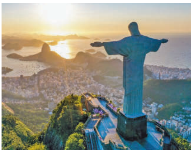
Cristo Redentor de Río de Janeiro

Con un potencial de aumento del 10% en el número de turistas españoles en 2025, impulsado por el crecimiento de la conectividad aérea, Brasil está preparado para ofrecer una programación rica que incluye atractivos naturales, cultura e historia. La riqueza gastronómica, otro de sus puntos fuertes, se presenta a través de shows de cocina y degustaciones.