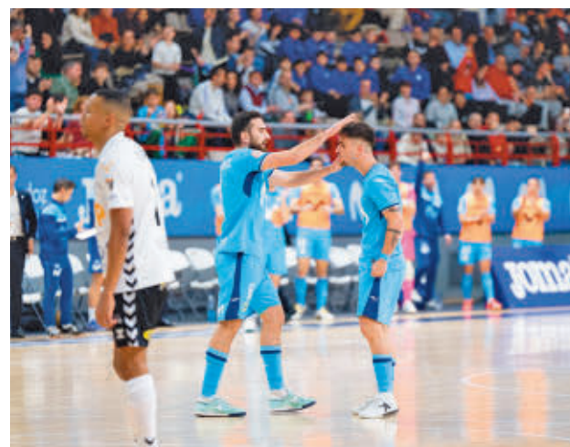
El Inter desplazó del liderato al Peñíscola

A pesar de ese peso histórico, los dos equipos se presentan a este encuentro con sensaciones bien diferentes. Mientras Inter lidera la clasificación, ElPozo necesita ganar este partido para no tener que depender de resultados de terceros en su carrera por acceder a la Copa de España. Cuatro equipos se disputan