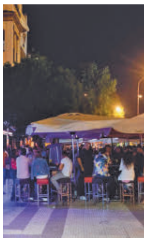
Cita clave para la hostelería

unidos en la asociación Noche Madrid han calculado que esta edición de Fitur generará un impacto en el ocio, la hostelería y los espectáculos de la región de 18,4 millo-