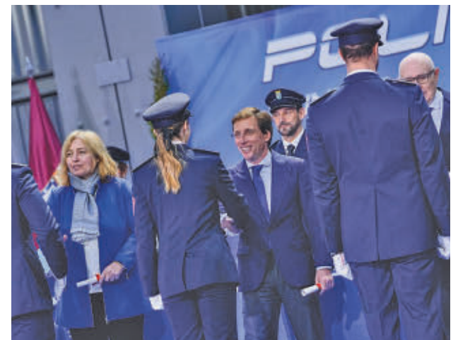
El alcalde estrecha la mano de una de las nuevas agentes

En su intervención, el primer edil puso en valor la labor de la Policía Municipal, a la que calificó de "escudo y abrazo" de la ciudad, al tiempo que volvió a reclamar al Estado que modifique la tasa de reposición para poder contar con más efectivos. Por último destacó su "heroicidad y sacrificio sin límites, con el santo y seña de servir a los madrileños".