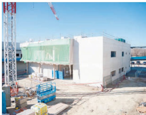
Las obras de construcción del polígono, en Villa de Vallecas