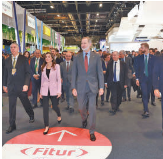
UNA TRADICIÓN REAL: El pasado miércoles 22 Felipe VI y la reina Letizia estuvieron presentes en Ifema para inaugurar de forma oficial la feria. Recibieron una senyera como agradecimiento del pueblo valenciano.