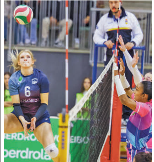
El equipo madrileño sumó otro punto en Vallehermoso

Precisamente a tierras canarias deberá viajar este sábado 25 (17 horas) el Madrid Chamberí para jugar en el Pabellón Miguel Solaesa, feudo de un Heidelberg-Volkswagen que sigue como líder claro de la competición y que aún no conoce la derrota.