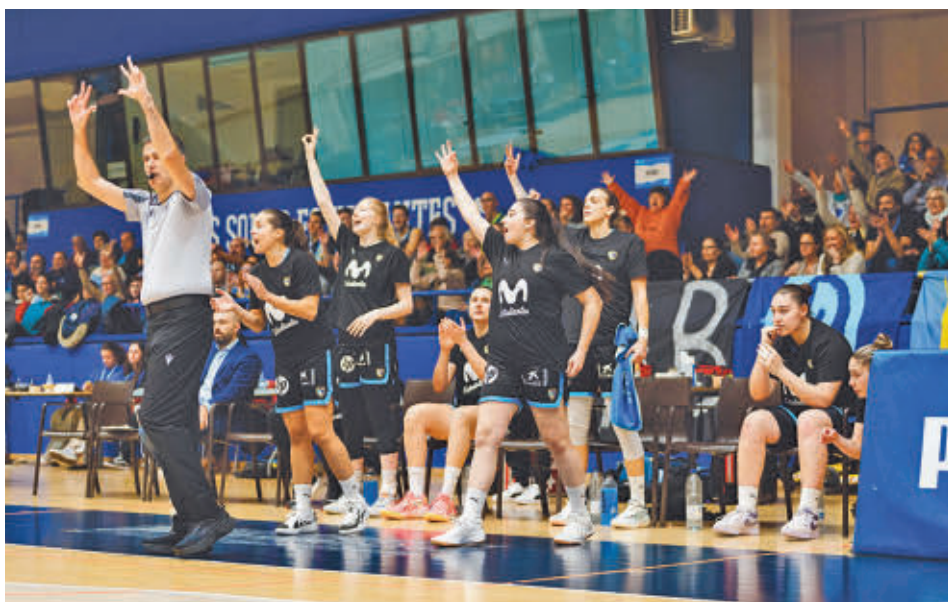
El 'Estu' ya ocupa la quinta posición MOVISTAR ESTUDIANTES