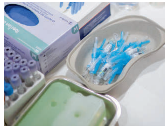
Vacunas contra la gripe E.P.

"Seguimos recomendando la vacuna a las personas de grupos de riesgo que han presentado síntomas respiratorios", añadió.