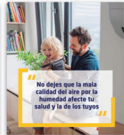
CALIDAD DEL AIRE