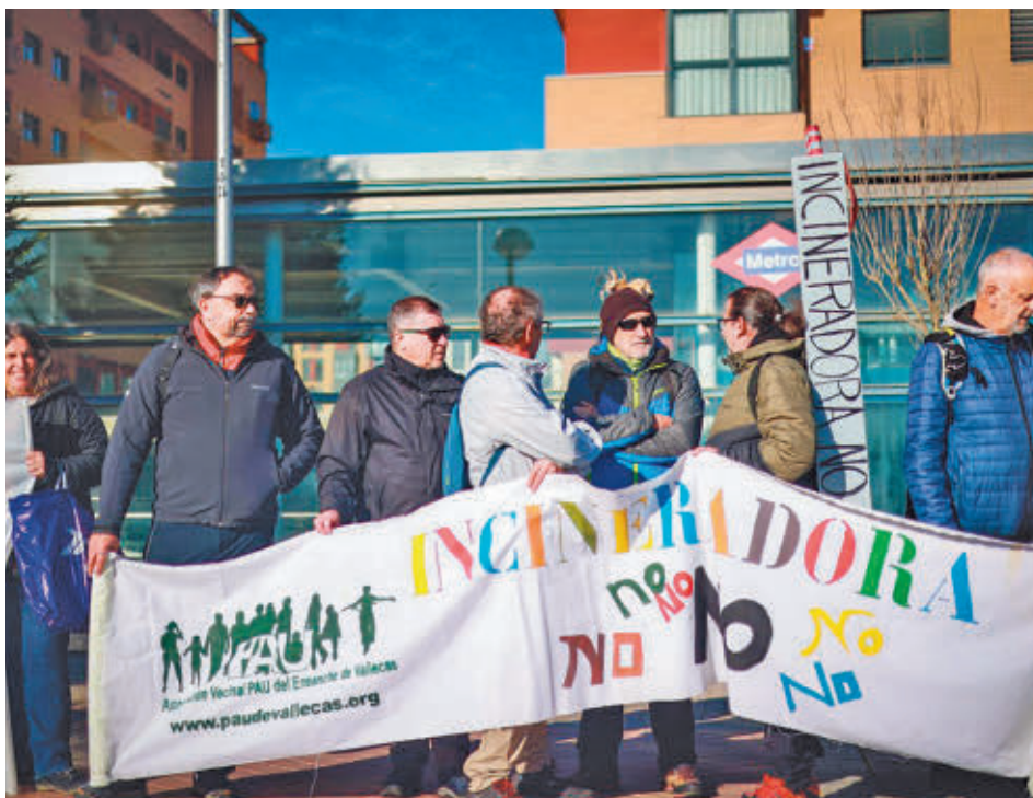
Los manifestantes portaron diferentes pancartas