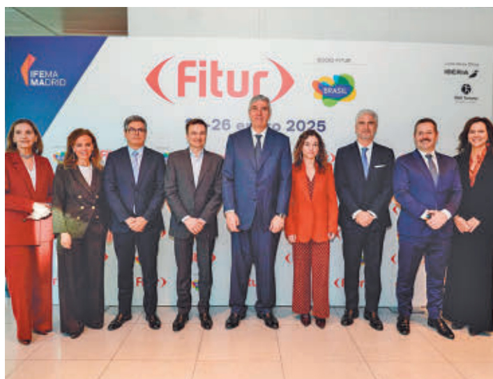
Presentación oficial de esta edición de 2025