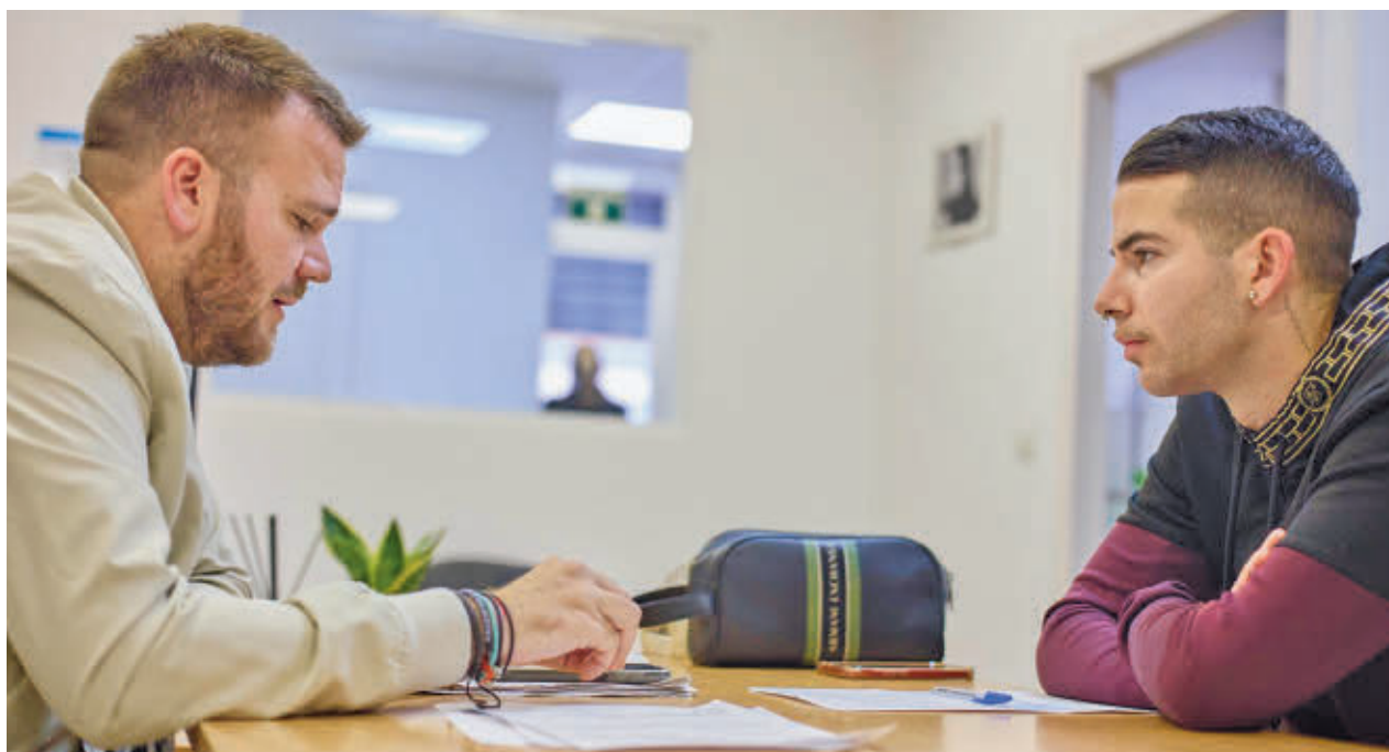
Un técnico asesora a uno de los participantes en el programa FUNDACIÓN LA CAIXA