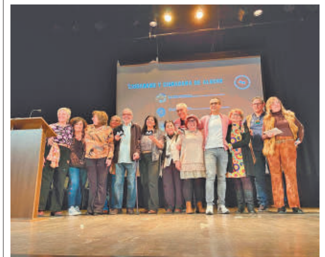
Foto de familia de la presentación de la revista vecinal AVIB