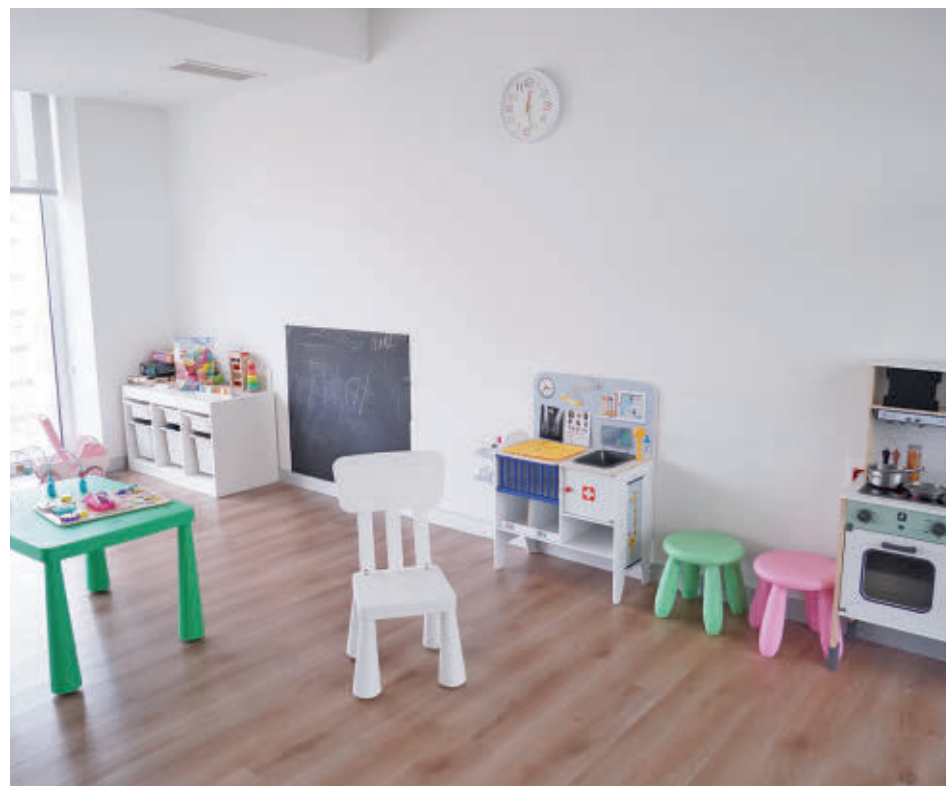
Uno de los espacios del CAF 8, situado en el distrito de Carabanchel

Pendientes aún quedan un centro de mayores y de día en la calle de Camarena y un hospital en los terrenos de la antigua cárcel.