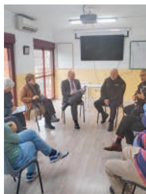
Un momento de la reunión

a las quejas de los vecinos con respecto a los problemas de suciedad, botellón y 'afters' ilegales en la zona de Oporto y a la okupación del antiguo campo de fútbol del Puerta Bonita. Así lo aseguró a la salida de la reunión mantenida con miembros de la Asociación de Vecinos de