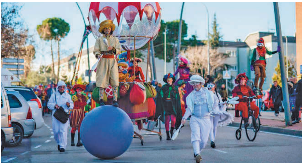
Imagen del desfile del año pasado