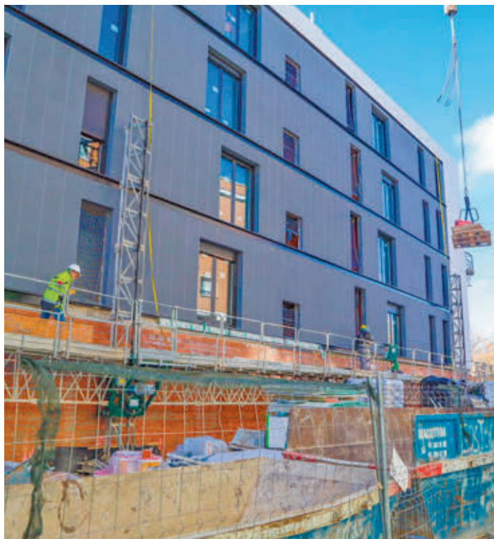
Las 39 viviendas públicas se entregarán en verano

La finalización de las obras está prevista para la primavera de este año y la entrega de llaves, en el próximo verano. Hay que recordar que las obras de esta promoción fueron paralizadas por la primera empresa adjudicataria, sin autorización expresa de la Empresa Municipal de la Vivienda de Alcobendas (Emvialsa), en el año 2023. En