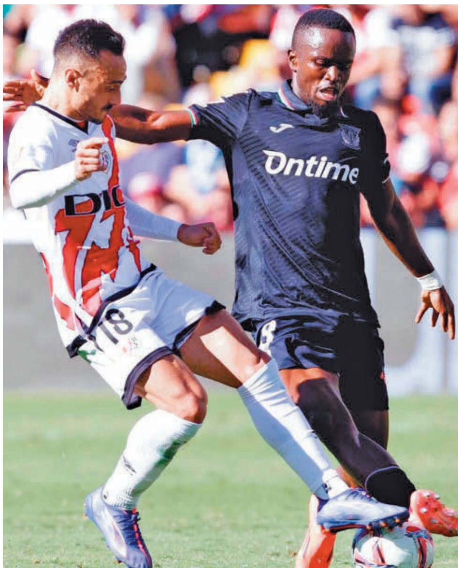
Rayo y Leganés abren este viernes en Butarque la jornada 22 de Liga

Este Leganés-Rayo abre un carrusel que tendrá continuidad el martes 4 en el Metropolitano. Allí se verán las caras el Atlético de Madrid y el Getafe en el partido que abre