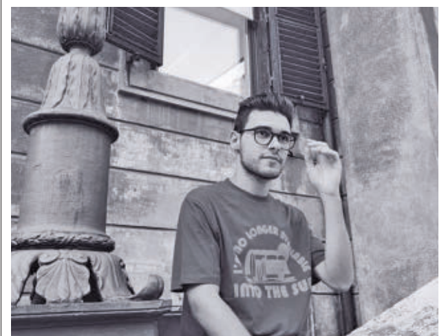
Foto del autor galardonado en esta edición