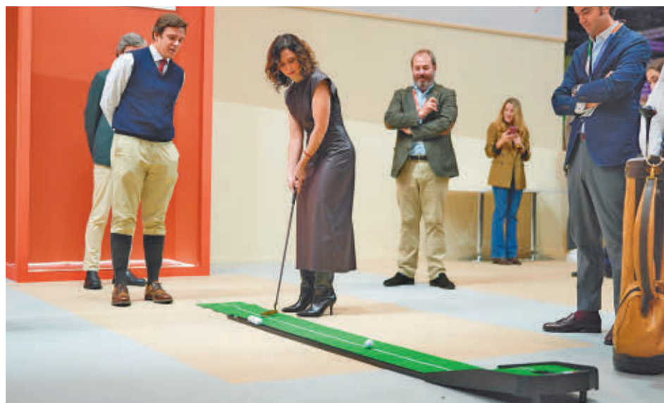
Díaz Ayuso participó en las actividades del stand de Madrid en Fitur

tos caben en Madrid, como todos los bolsillos, sensibilidades, gustos, intereses, aficiones y pasiones, y adaptados a todos porque cada uno tiene su circunstancia", indicó la presidenta, que añadió que "en Madrid se lo ponemos fácil para que sea un ma-