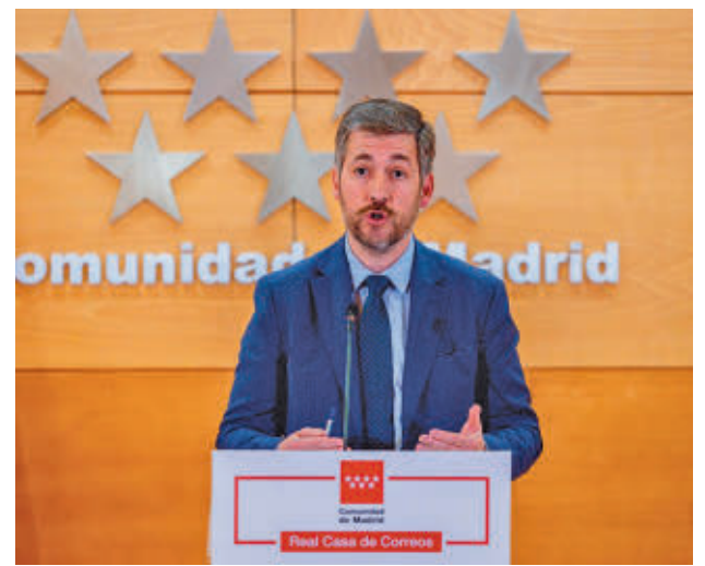
Miguel Ángel García, portavoz del Gobierno regional