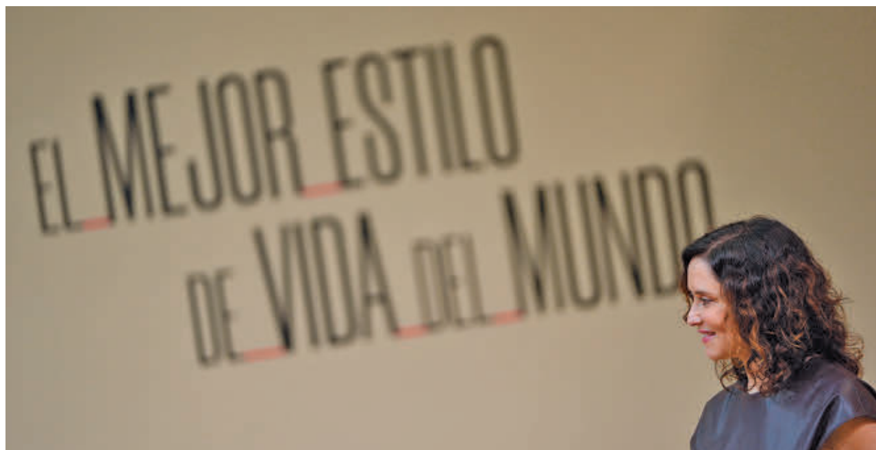
La presidenta regional, durante su intervención en Fitur

Los planes del Ejecutivo autonómico pasan por seguir consolidando la región como sede para la organización de grandes eventos culturales y deportivos, como los Premios Platino, los Laureus o la Fórmula 1, que llegará con el Gran Premio de España 2026. El Santiago Bernabéu albergará este otoño un partido oficial de fútbol americano con los Miami Dolphins como equipo local. Este acontecimiento tendrá una especial proyección en el continente americano, ya que la NFL representa el 75% del consumo total de todas las ligas en EEUU.