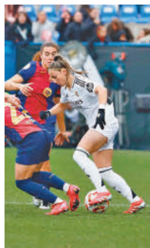
Dura derrota de las blancas

Para el turno del sábado (12 horas) queda un Madrid CFF-Real Sociedad donde las locales buscarán un triunfo de prestigio que les aleje aún más del descenso.