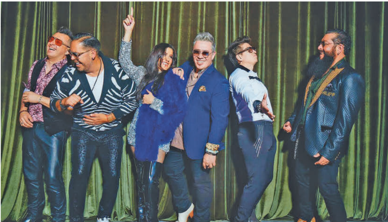
La banda mexicana actúa este viernes 31 en París y el 6 de febrero en el Electric Brixton de Londres