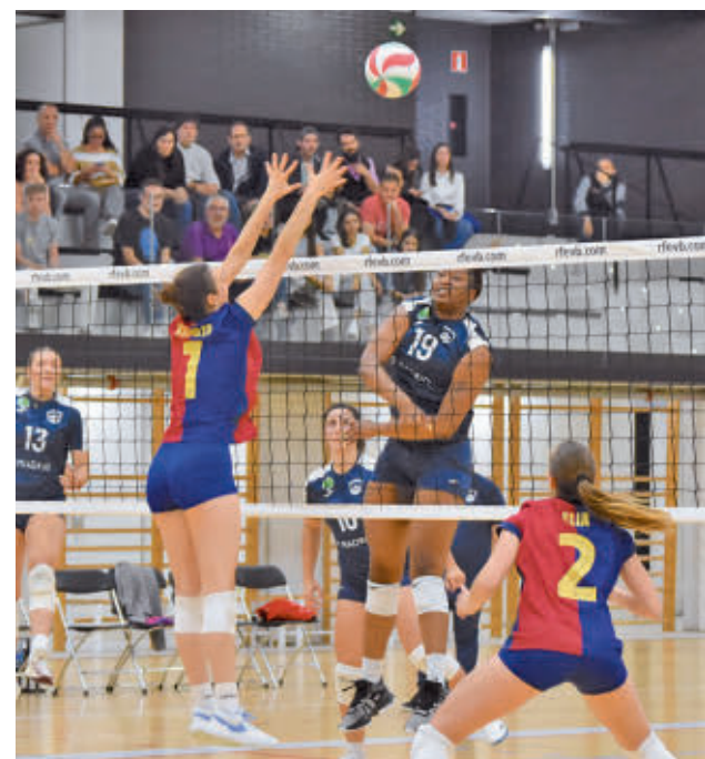
En la ida se impuso el Barça por 3-0

Por su parte, el Silbó San Pablo Burgos deberá aparcar la resaca de la Copa para visitar este viernes 31 la pista de un Amics Castelló que ocupa la undécima posición.