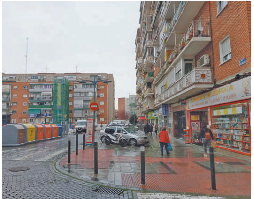
Se creará un parque de apartamentos en régimen de alquiler GENTE

En ese sentido han ido algunas de las propuestas de resolución aprobadas. En total han sido ocho bloques de diversa temática. En cuanto a las medidas para mejorar el acceso a la vivienda asequible, se han incluido, entre otras, la creación de un parque de apartamentos en régimen de alquiler y el impulso (junto a otras entidades y colectivos) de fórmulas residenciales co-