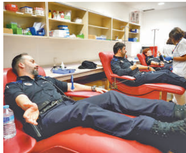
Varios agentes donaron sangre AYUNTAMIENTO DE ALCORCÓN

La Unidad de Donación del centro hospitalario está ubicada en la planta baja, junto a la zona de extracciones y recibe donantes los lunes, miércoles, jueves y viernes de 8 a 15 horas y los martes de 13 a 20 horas. Los requisitos básicos para ser donante son ser mayor de 18 años, pesar más de 50 kilos y disponer de buen estado de salud general, así como otros más específicos como no haberse tatuado o realizarse un piercing en los últimos cuatro meses.