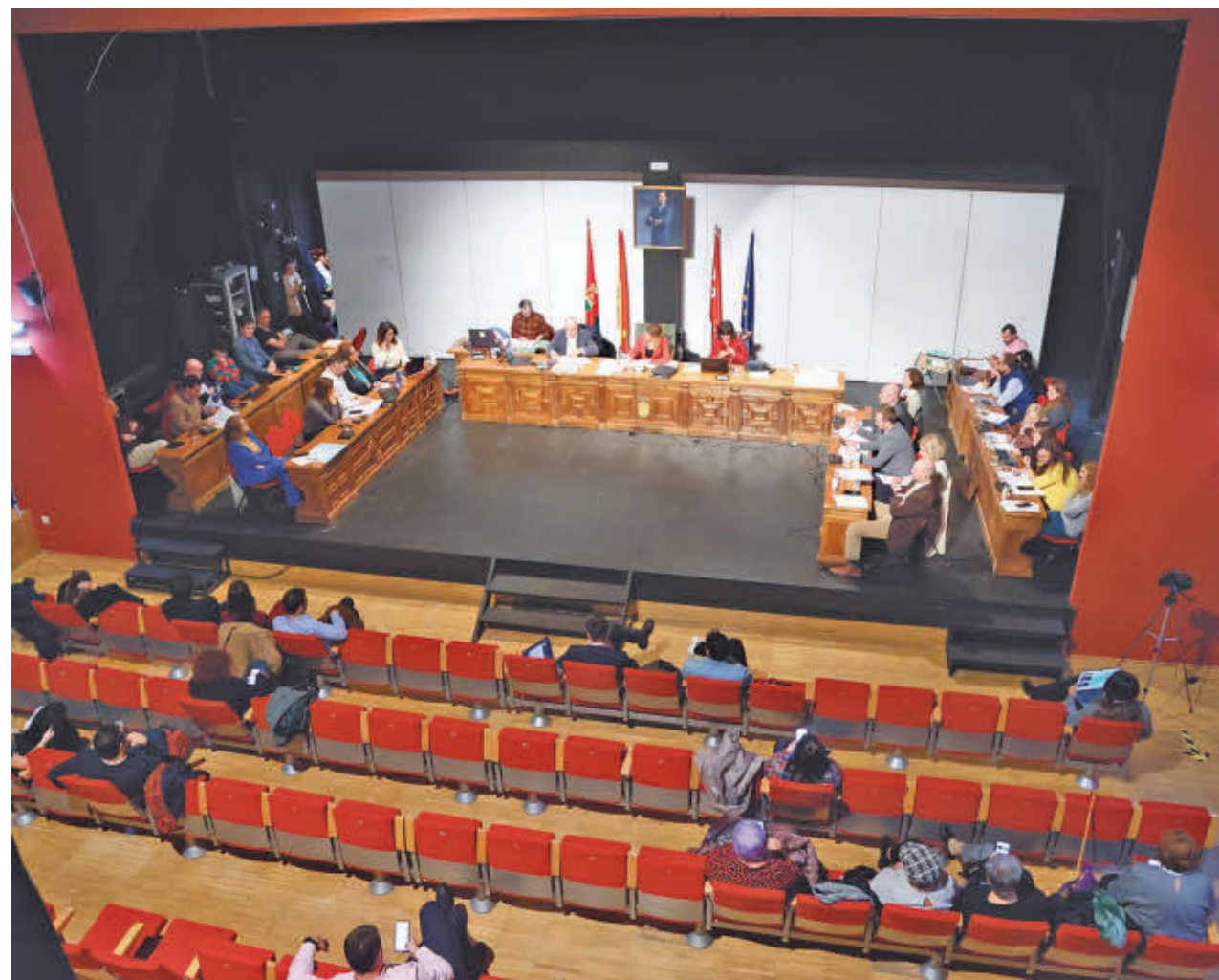
AYTO DE ALCORCÓN