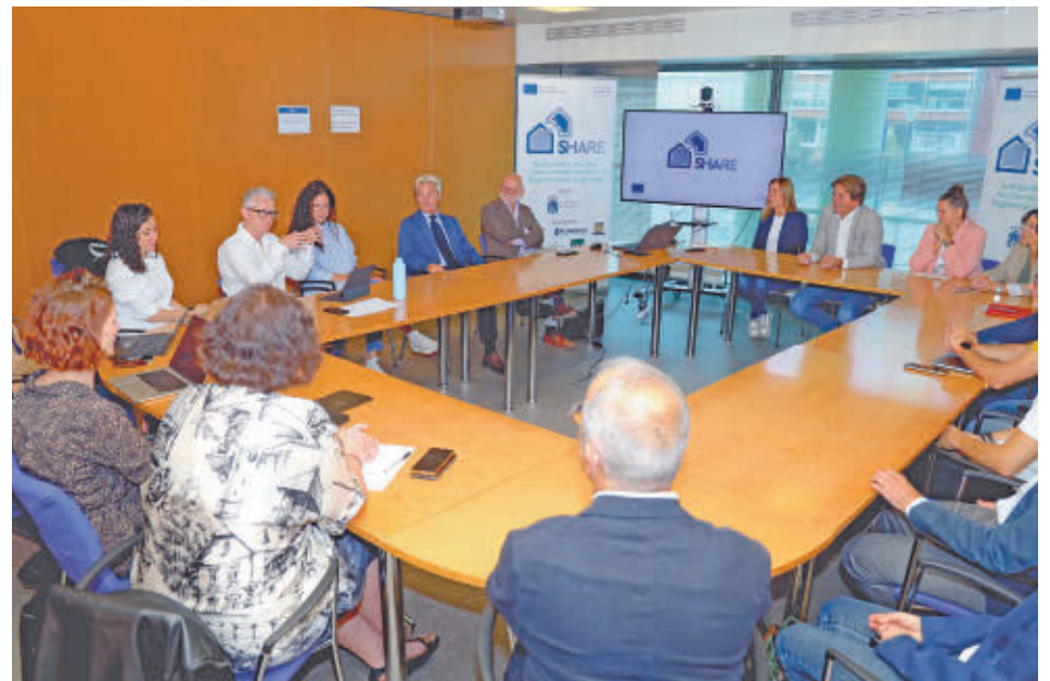
El alcalde en una reunión con socios del plan Share

Financiado con fondos europeos del plan Share, supondrá la construcción de varios apartamentos que estarán divididos en dos edificios. Ambos contarán con planta baja y tres superiores y estarán comunicados a través de plataformas. En cuanto al espacio habitable, tendrán una o dos