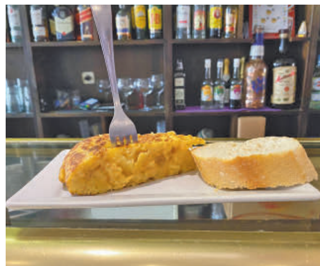
La tortilla de patata, la protagonista de la feria