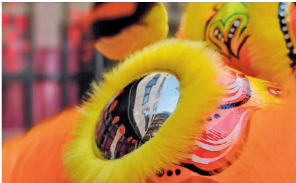
La ciudad celebra el Año Nuevo Chino con una carrera CCHINAMADRID

De esta forma, la oferta para la próxima convocatoria para internos residentes consta de 23 especialidades que ya se imparten en el centro, sumándose la ya comentada de Psiquiatría. En total, se dispondrá de 44 plazas MIR distribuidas, entre otras, en: Análisis Clínicos (2), Anatomía Patológica (1), Anestesiología y Reanimación (2), Aparato Digestivo (1), Cirugía General (2), Cardiología (1), Traumatología (1), Dermatología (3), Endocrinología (1), Rehabilitación (1), Medicina Intensiva (1), Interna (3), Preventiva (1), Oftalmología (2), Oncología (1), Otorrinolaringología (1), Radiodiagnóstico (2), Urología (1), Ginecología (2), Pediatría (3), Psiquiatría (3) y Medicina del Trabajo (1).