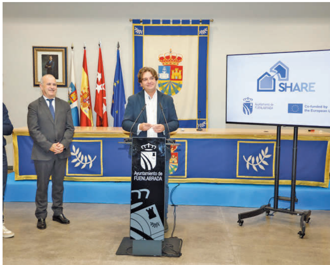
AYTO DE FUENLABRADA