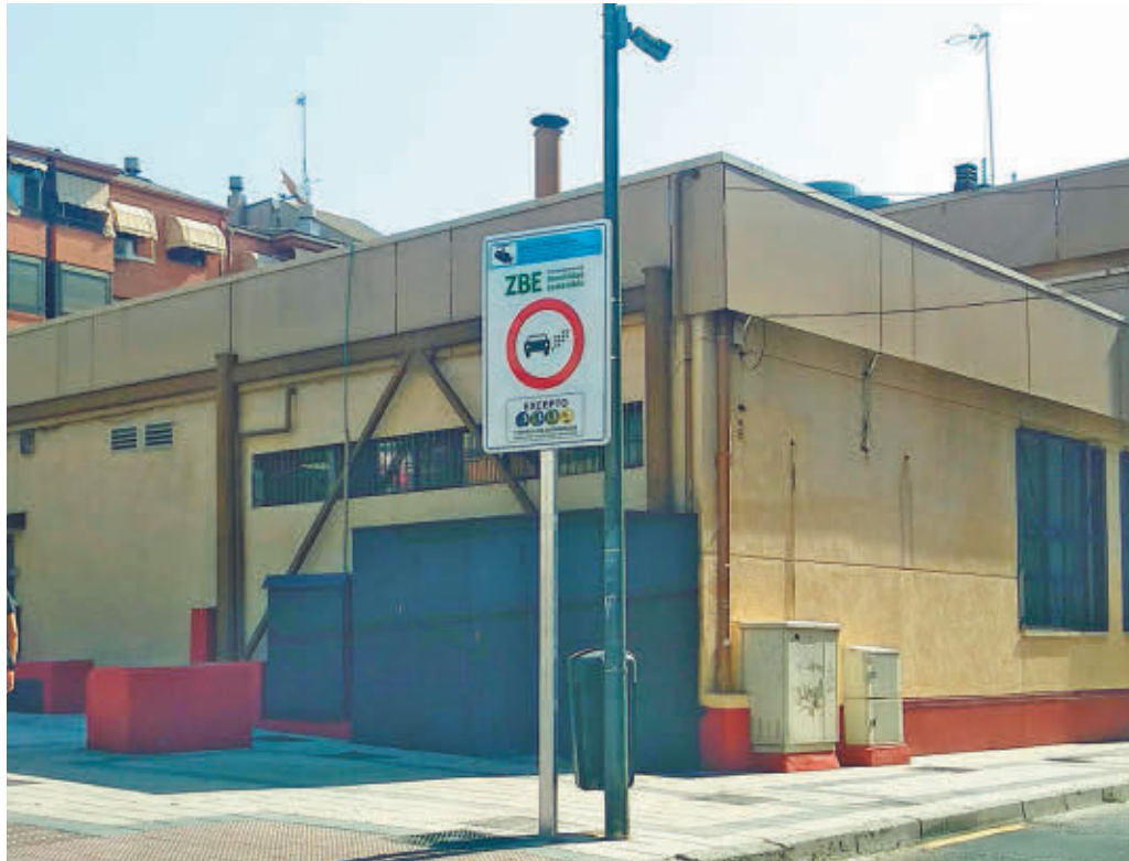
La zona con restricciones comprende los barrios de Centro y San Isidro E.P

Desde el Ayuntamiento han anunciado que monitorizará diariamente la ZBE para tomar medidas complementarias que ayuden a la concienciación ciudadana, en el caso de ser necesario. Además, han señalado que se han incorporado “varias propuestas vecinales para enriquecer” la ordenanza regu-