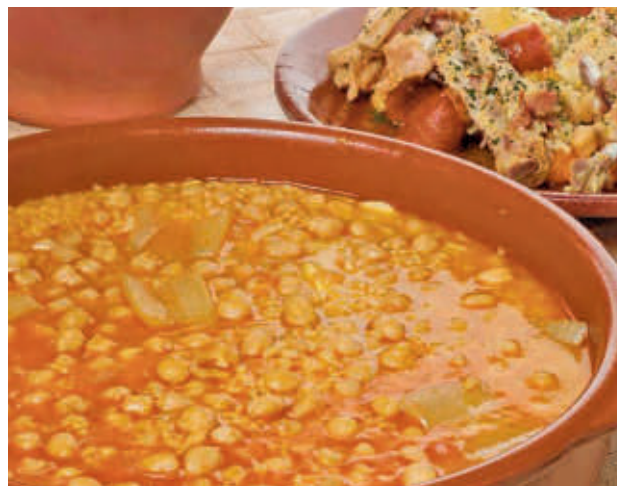
Llega una nueva edición de la ‘Ruta del Puchero’ ACOEG

febrero, más de medio centenar de locales de todo el municipio ofrecen platos por 2,90 euros. Como novedad para esta edición se incorpora una aplicación de móvil (tanto Android como iPhone) que permitirá realizar la votación de forma interactiva, siempre que se encuentren físicamente en el local; y que incluye un mapa interactivo con las localizaciones.