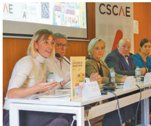
Los vecinos de Juan de la Cierva, los primeros en participar

GenteMadrid.es Consulte la actualidad regional y local en nuestra página web