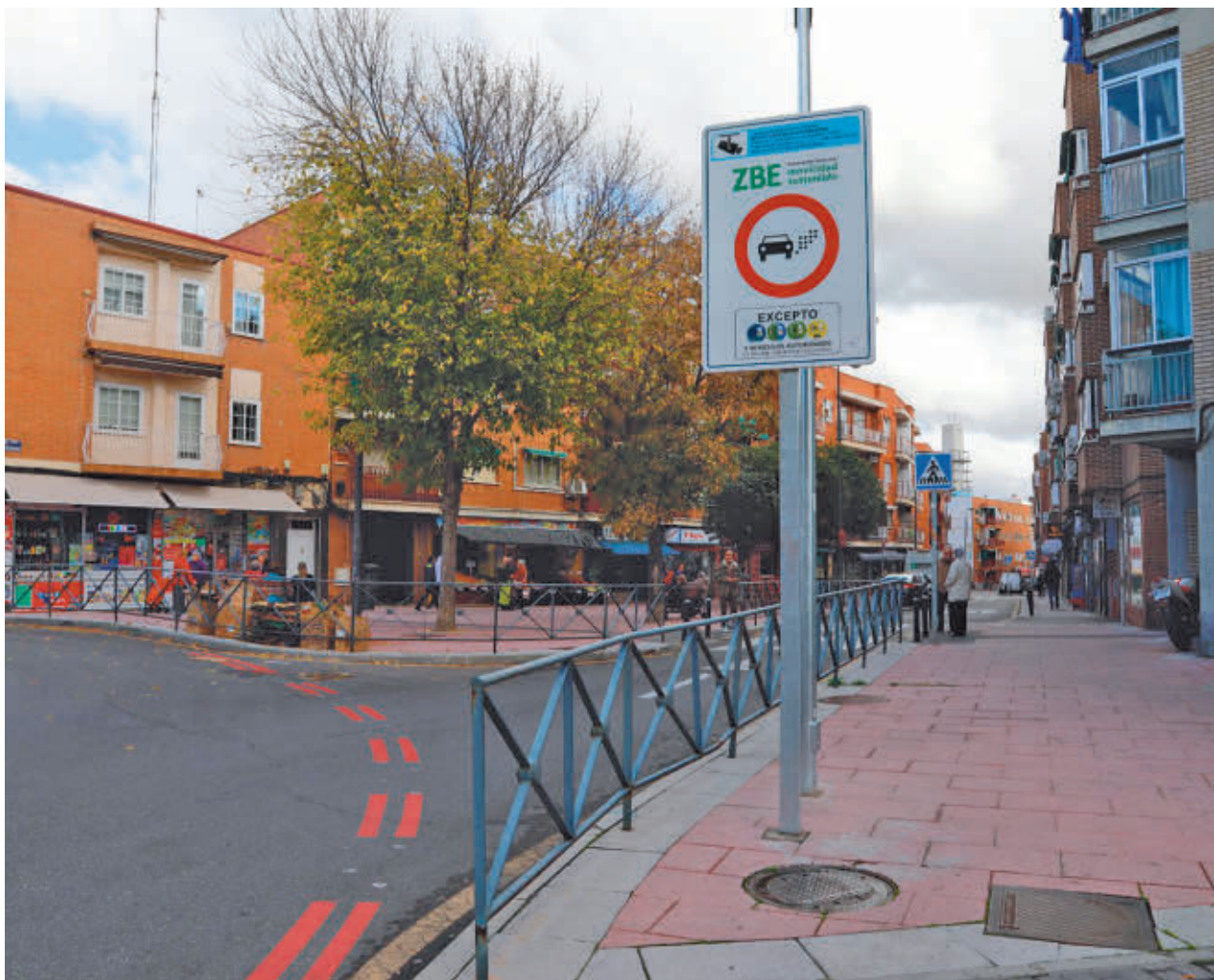
AYTO DE GETAFE