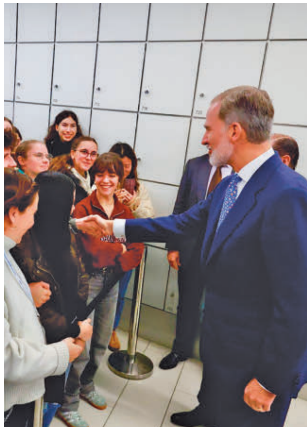
El Rey saludó a los estudiantes de la UC3M

La nueva Facultad de Ciencias de la Salud UC3M se pre-