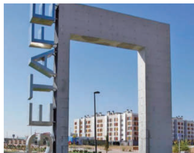
El barrio de Los Molinos “carece de muchos servicios”

Insiste en que el barrio de Los Molinos, formado mayo-