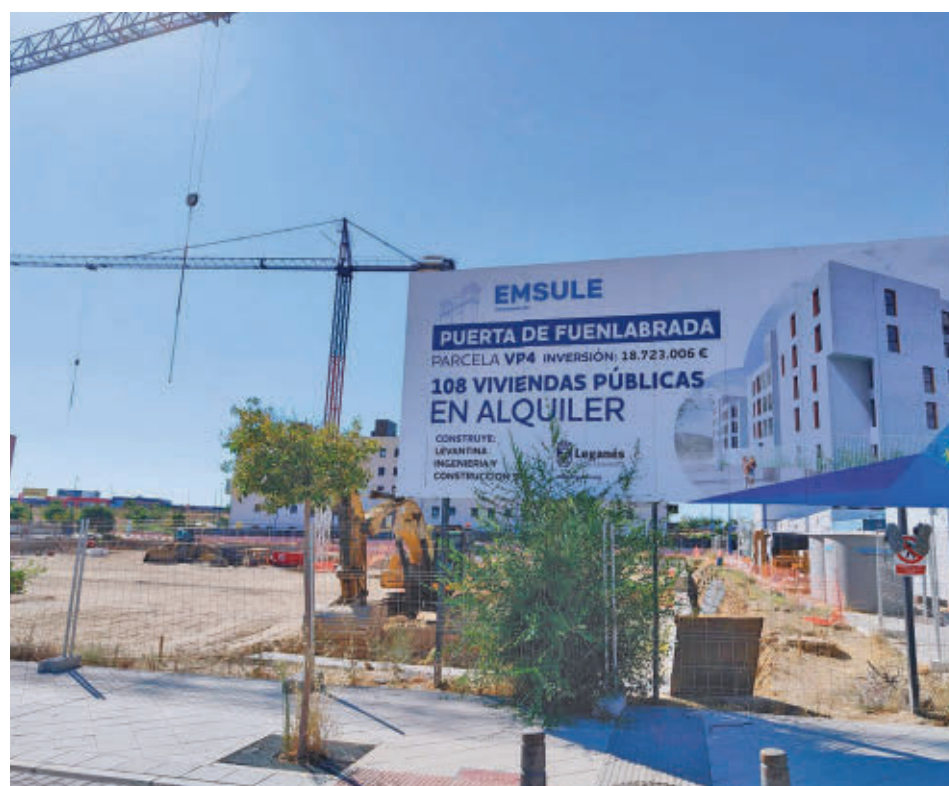
Promoción de vivienda pública que se adjudicó a la empresa de la 'trama Koldo'

En esta línea, Delgado advierte de que el pacto de ULEG "es con los vecinos". "El acuerdo funciona muy bien, pero solo estamos casados con ellos", aseguró.