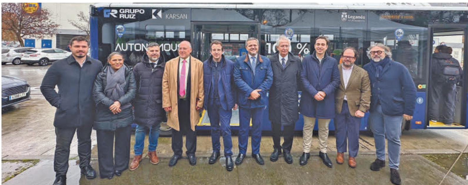
Acto de presentación del primer autobús sin conductor de la Comunidad de Madrid