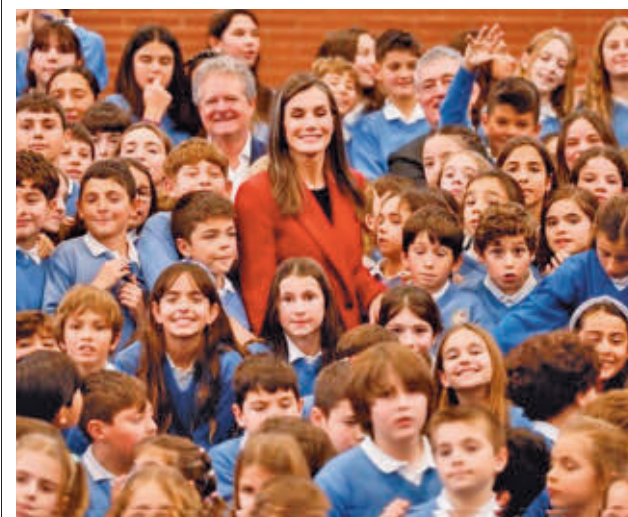
La Reina, rodeada de alumnos CEIP CORTES DE CÁDIZ

Por otro lado, se destinarán 46.500 metros cuadrados a redes de servicios colectivos, entre equipamientos e instalaciones deportivas, 141.500 a viario local y 45.000 a vía pública principal.