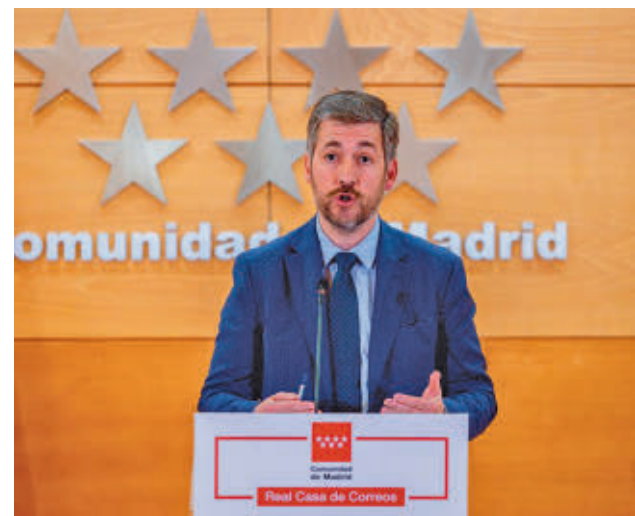
Miguel Ángel García, portavoz del Gobierno regional