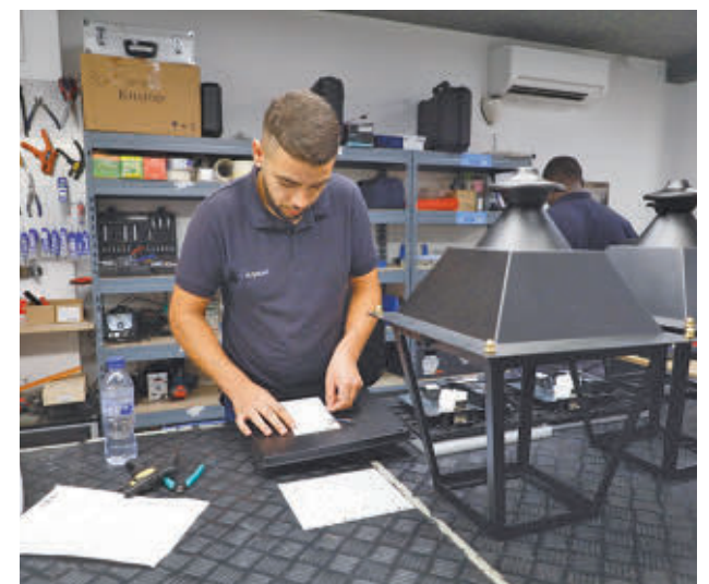
El desempleo juvenil sufrió un fuerte retroceso

A nivel global, el número de trabajadores volvió a alcanzar el máximo histórico de la serie y se situó en 1.946.100 personas, con una tasa de actividad del 64,4%, 5,9 pun-