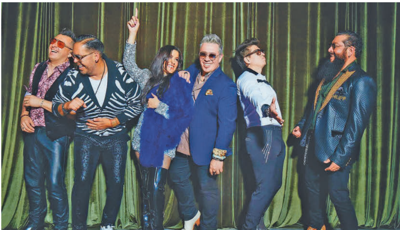
La banda mexicana actúa este viernes 31 en París y el 6 de febrero en el Electric Brixton de Londres