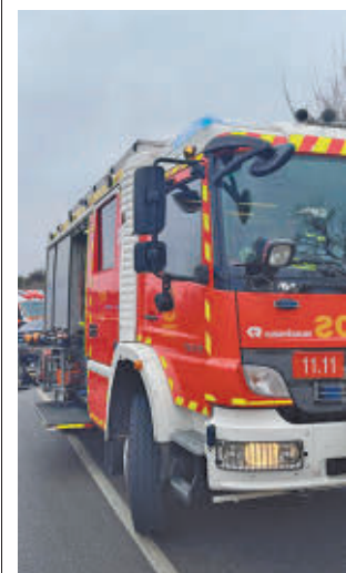
Bomberos de Madrid

para los jóvenes, tarifas más reducidas para los usuarios recurrentes y medidas para incentivar el uso de la bicicleta. En los trenes de media distancia también habrá descuentos en función de la edad y el tipo de abono y de manera similar ocurrirá en los servicios de autobús de titularidad estatal y el transporte urbano y metropolitano.