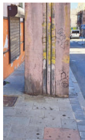
Una torreta en una acera

Pese a recibir el refrendo en Tetuán, fuentes del área de Obras y Equipamientos explican que pueden solicitar su retirada cuando llegan quejas por problemas de accesibilidad, pero que “corresponde a las compañías responsables de los servicios, sin que el Consistorio tenga resortes legales para obligarles a hacerlo”.