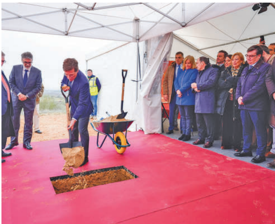
Un momento del acto simbólico de colocación de la primera piedra