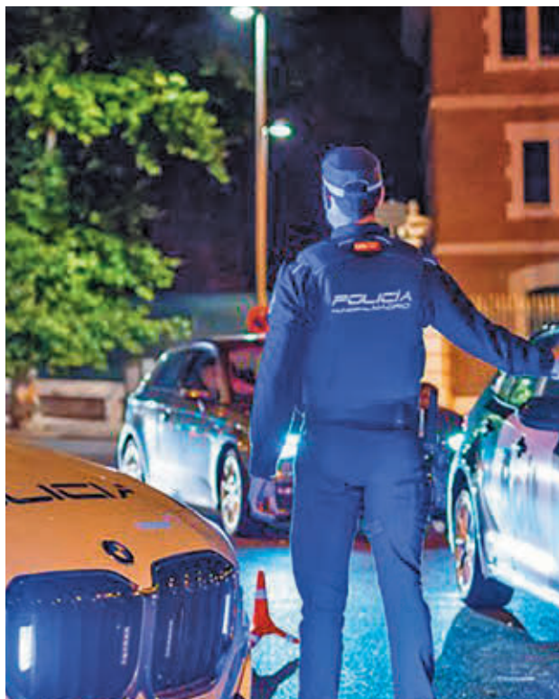
Uno de los controles de alcohol y drogas

Le siguieron los 1.175 arrestados o investigados por hurtos (1.338 en 2023), los 548 delitos contra la salud pública o drogas (436 en 2023), los 548 por violencia de género, los 350 por lesiones (275 en 2023), 239 por atentado, resistencia o desobediencia a la autoridad (268 en 2023), los 211 robos con fuer-