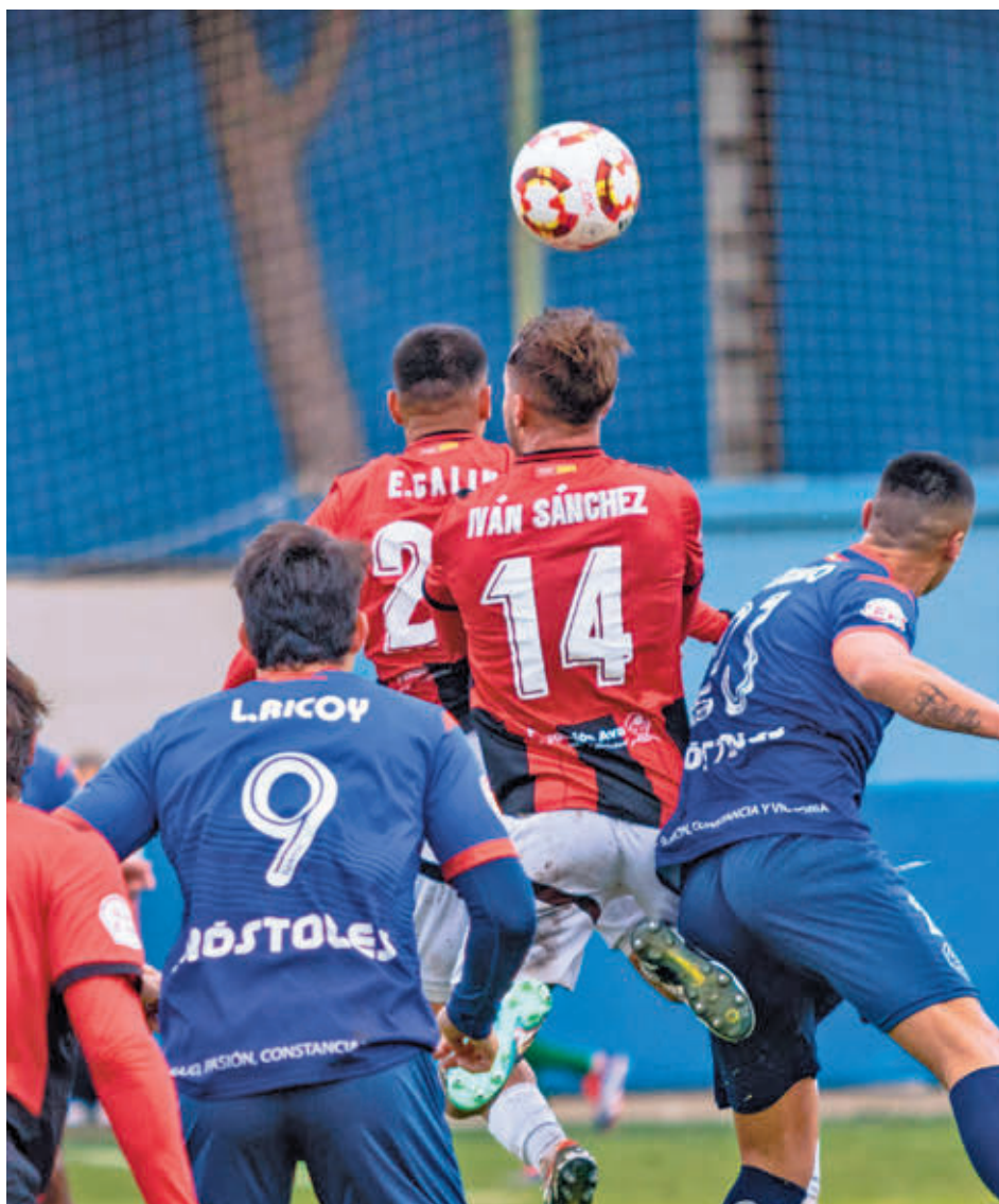
La insistencia de los azulones fue clave para lograr la victoria en el último minuto

El míster pidió no bajar el ritmo: "Debemos aportar la fuerza, creer y calidad de cada uno".