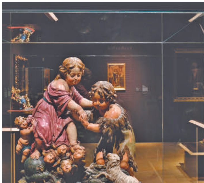
Niño Jesús y San Juanito, de Luisa Roldán MUSEO NACIONAL DE ESCULTURA

Entre ellas se encuentra Niño Jesús y San Juanito, una pieza de gran valor histórico y artístico cedida por la Hermandad de Nuestra Señora de los Santos y San Simón de