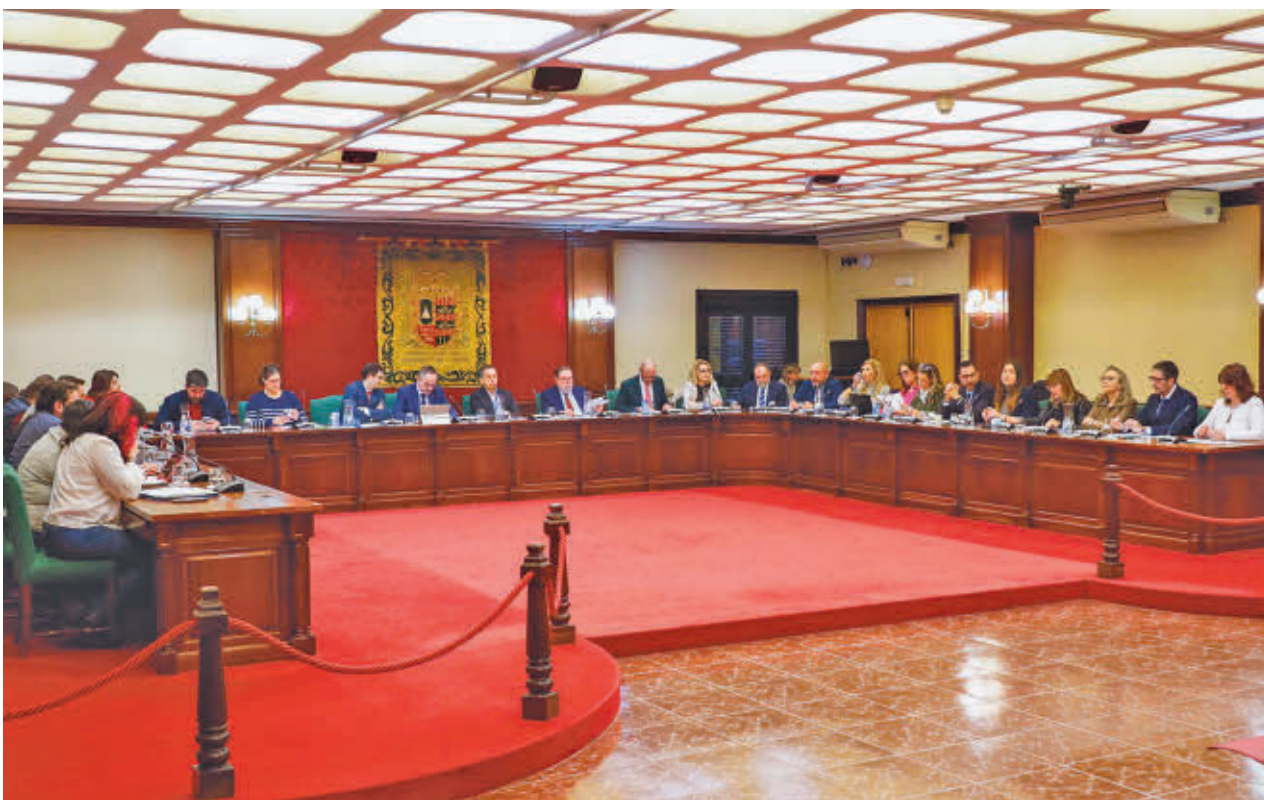
El debate del pleno de enero se centró en la búsqueda de iniciativas estratégicas para optimizar la movilidad y reducir atascos