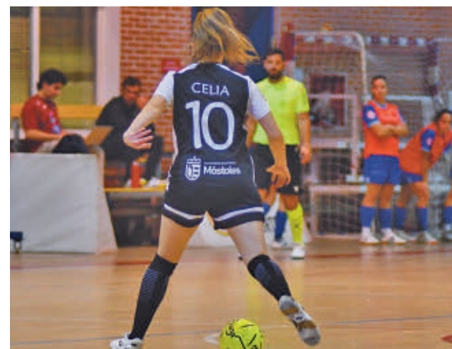
El equipo mostoleño está a solo 2 puntos de evitar el descenso

Las mostoleñas siguen en la 14ª posición con 14 puntos. El próximo partido será en casa contra el Futsi Atlético Navalcarnero.