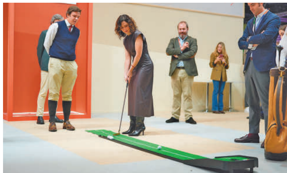
Díaz Ayuso participó en las actividades del stand de Madrid en Fitur

tos caben en Madrid, como todos los bolsillos, sensibilidades, gustos, intereses, aficiones y pasiones, y adaptados a todos porque cada uno tiene su circunstancia", indicó la presidenta, que añadió que "en Madrid se lo ponemos fácil para que sea un ma-