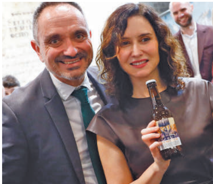
El alcalde y la presidenta destacan el potencial turístico de Móstoles

Durante su paso por la feria, la ciudad mostró su patrimonio y gastronomía ● Autoridades locales y regionales participaron en la promoción ● El balance fue muy positivo y prometedor