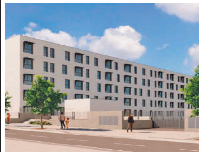
Las viviendas se entregarán en la segunda mitad de 2025

El Ayuntamiento ha organizado unas jornadas de sensibilización sobre ciberseguridad, en colaboración con el Instituto Nacional de Ciberseguridad (INCIBE), para conmemorar el Día de Internet Seguro, que se celebra el 11 de febrero. La cita tendrá lugar los días 3, 4 y 5 de febrero en el Centro Cultural Villa de Móstoles. Durante las jornadas, se realizarán talleres, presentaciones y actividades gamificadas para promover la educación digital y fortalecer la confianza de los usuarios en el ámbito online. Las actividades estarán dirigidas a familias, empresas y centros educativos, con sesiones de mañana para escolares y acceso libre por la tarde. La jornada ofrecerá una experiencia interactiva y educativa sobre cómo proteger nuestra identidad digital.