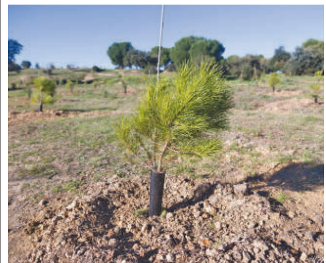
Uno de los árboles plantados en el Bosque SIGAUS

Además, el edil destaca que “con estas actuaciones se va a mejorar el tránsito peatonal y la seguridad vial; se va a regularizar el estacionamiento de vehículos en las calles de los Tintes, Ronda de Puertos, Pico de la Miel, Puerto de Somosierra y Puerto de Navafría, y se va a acondicionar una parcela municipal, en estado del terreno natural, situada entre las calles Puerto de la Morcuera y Pico de la Maliciosa para generar un parque canino”.