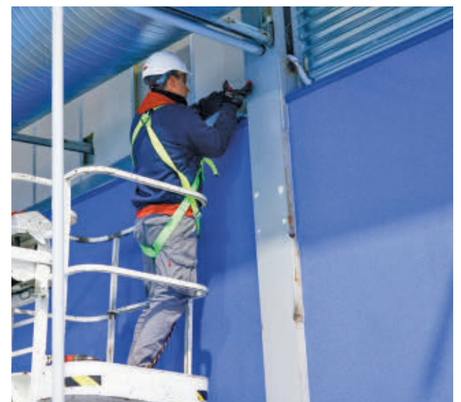
Un operario en el Pabellón B del complejo deportivo

Estas obras consisten en la resolución de las goteras existentes, la mejora del aislamiento térmico de cubierta y la instalación de un sistema de climatización para mejorar las condiciones térmicas del pabellón. Además de estas actuaciones, se quiere modificar la iluminación existente en el pabellón por otra