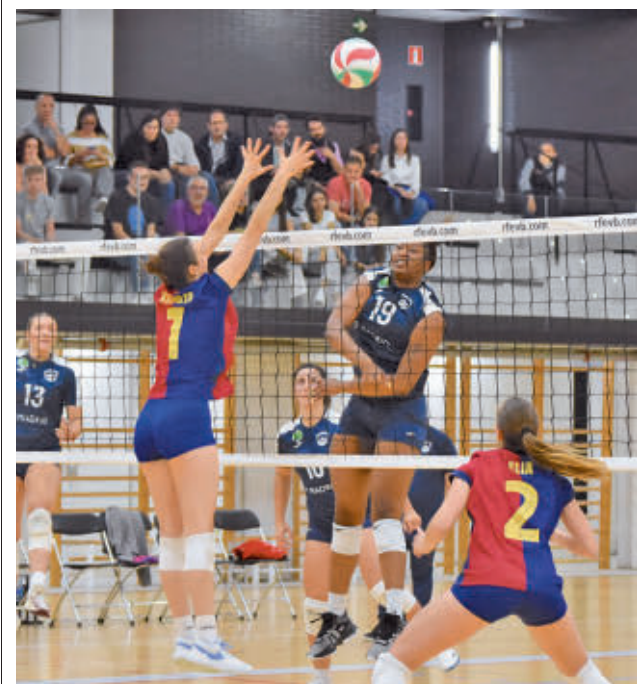
En la ida se impuso el Barça por 3-0

Por su parte, el Silbó San Pablo Burgos deberá aparcar la resaca de la Copa para visitar este viernes 31 la pista de un Amics Castelló que ocupa la undécima posición.