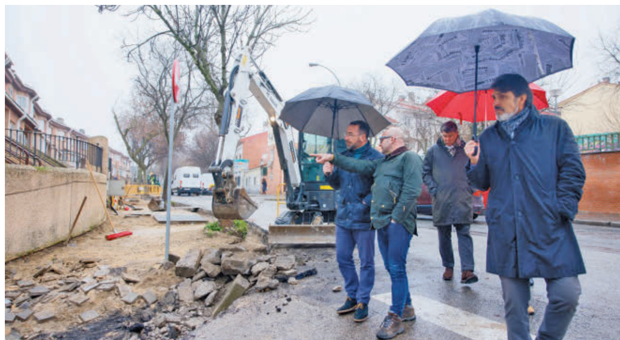
Parte del Ejecutivo local, con el alcalde a la cabeza, visitó la zona

Por primera vez, y como valor añadido a la propia plantación, ésta se ha vinculado a los escolares del municipio. Así, además de ofrecerles las charlas, se ha realizado un concurso mediante el cual tendrán la posibilidad de bautizar un árbol del nuevo bosque con el nombre que elijan. Cada ejemplar llevará una etiqueta de corcho con el nombre y estará geolocalizado y fotografiado, y se publicará en la web de los Bosques SIGAUS para que los niños y sus familias sigan su crecimiento y evolución.