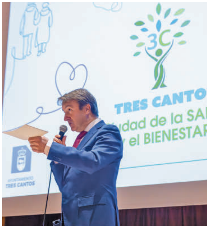
El alcalde, durante la presentación

El alcalde de Tres Cantos puso en valor que la ciudad "ya es sinónimo de salud y bienestar, porque con este enfoque llevamos años trabajando", recordando que "el bienestar mejora nuestro estado de ánimo y aporta felicidad, lo que se traduce en vivir mejor, más años".