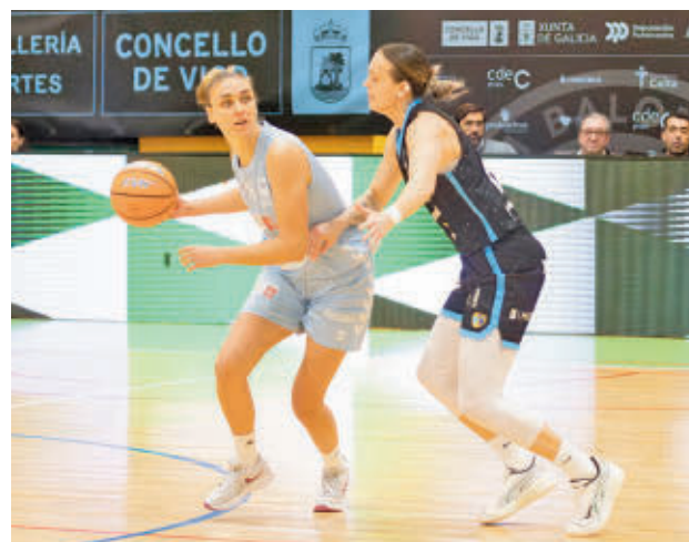
El colista sorprendió al Movistar Estudiantes

Por su parte, el Movistar Estudiantes deberá pasar página tras el tropiezo de la semana pasada, cuando cayó por 80-71 de forma inesperada en la cancha del colista, el Celta Femxa Zorka.