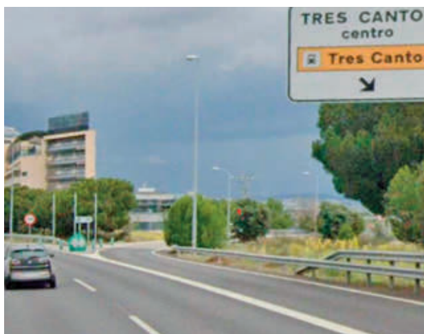
Vía de salida a Tres Cantos centro

Estos trabajos van a ser realizados por la empresa adjudicataria del contrato, para lo cual será necesario el corte total del ramal de salida al disponer de una anchura insuficiente para poder simultáneas esta ejecución con la circulación de vehículos.