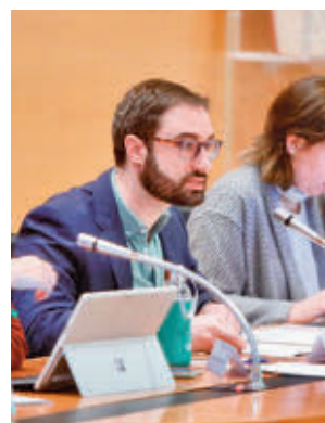
Un momento del Pleno

el marco del Plan VIVE Solución Joven. Se trata de las parcelas D2, en la calle Camilo José Cela, 28, en el Distrito Norte, con casi 12.000 metros cuadrados, y de la parcela EG7 resto, en la Avda. Olímpica, 6, casi en el límite del Distrito Urbanizaciones y el Distrito Centro, con casi 20.000