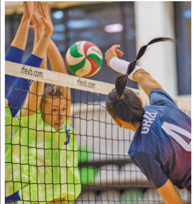
Triunfo importante del Madrid Chamberí RFEVB

ocupa la sexta posición y que, además, llega a este compromiso con el subidón de moral que supuso convertirse en el primer equipo que ha sido capaz de derrotar en la presente temporada al líder, el Heidelberg-Volkswagen. Al margen del resultado que se dé en este partido, el Madrid Chamberí también seguirá con atención lo que suceda en Lugo. Allí se verán las caras el colista, el Barça, y el penúltimo clasificado, el Arenal Emeve.