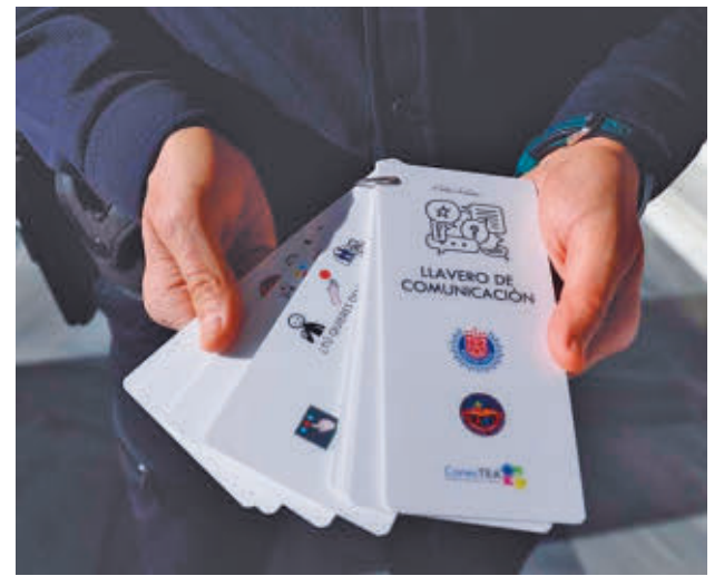
Una agente muestra las tarjetas

GenteMadrid.es Consulte la actualidad regional y local en nuestra página web