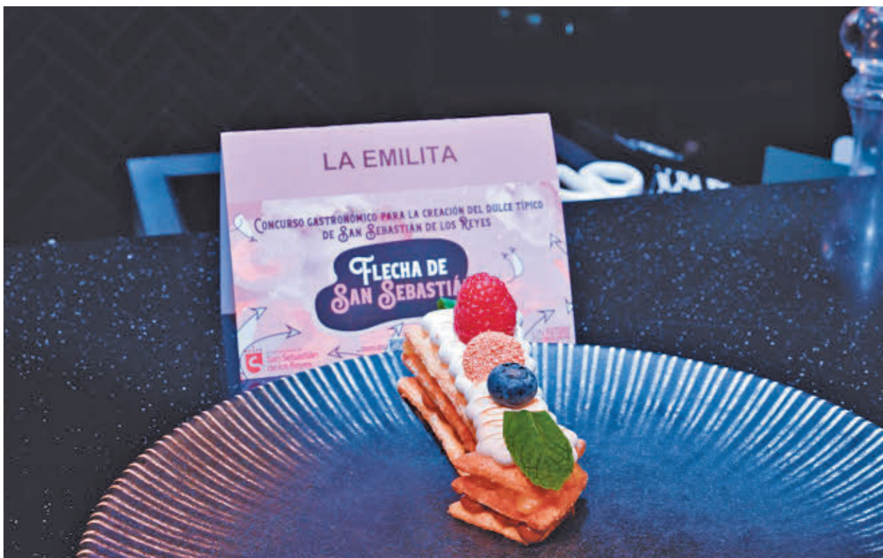
El hojaldre y la crema pastelera son los grandes protagonistas de la propuesta ganadora