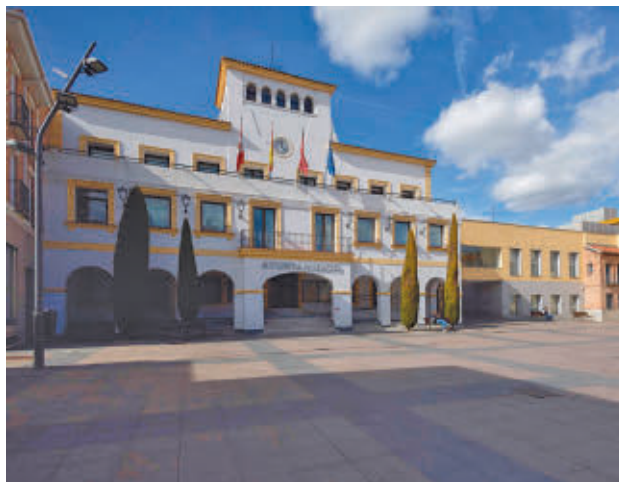
Ayuntamiento de San Sebastián de los Reyes

Según fuentes municipales, esta iniciativa pretende "revertir" la migración "intensiva" del campo a la ciudad, que ha provocado "la despoblación de numerosos pueblos y pequeñas ciudades". Las personas derivadas por los Servicios Sociales municipales tendrán la oportunidad de llevar "una vida digna y estable", promoviendo la repoblación de zonas rurales.