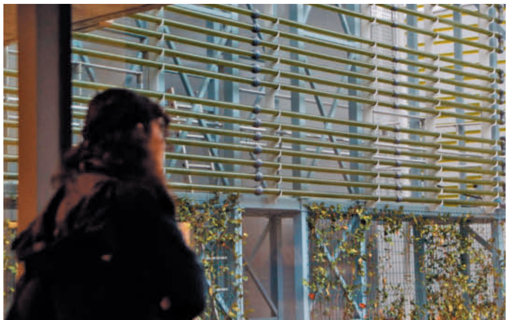
Este proyecto forma parte del convenio entre Esmasa y la Universidad de Alcalá AYO DE ALCORCÓN

están durante más o menos un mes, tras el cual suelen morir. Pero ahí no se acabará su ciclo. Una vez sin vida, tienen varios destinos: dedicarlas a biomasa para el abono de parques y jardines o venderlas a empresas de cosmética en las que están muy cotizadas. "Reafirmamos nuestro compromiso por un futuro sostenible para nuestros ciudadanos. Seguimos transformando la ciudad para convertirla en un gran hogar climático que afronte las consecuencias del cambio climático", ha dicho la presidenta en funciones de