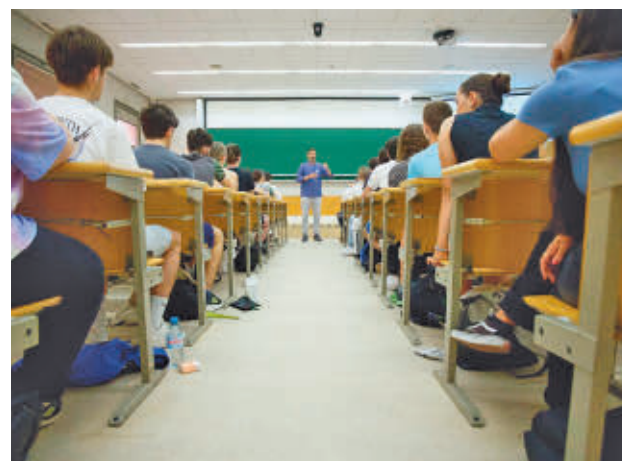
Alumnos en un aula al comienzo de un examen

El formato consta de una exposición inicial, dos turnos de refutación, respuestas, preguntas al equipo contrario y, finalmente, un resumen persuasivo. Una de las dificultades presentadas consiste en que hasta el momento antes de iniciar el debate los ponentes no conocen la postura que defienden: a favor o en contra. Un tribunal integrado por cuatro expertas de la UNED será quien escoja al equipo ganador de la final que se celebrará el próximo 21 de marzo.