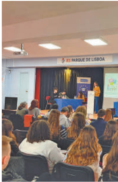
Ya se celebró la primera jornada

La Liga de Debate III, organizada por el Ayuntamiento y la UNED Madrid Sur, ha comenzado en Alcorcón con la participación de ocho centros educativos que se enfrentarán en diferentes rondas eliminatorias para alcanzar un puesto en la final, lo que les asegura una plaza en la Liga de Debate Intermunicipal. Dirigida al alumnado de la ESO, los estudiantes deberán prepararse cada encuentro