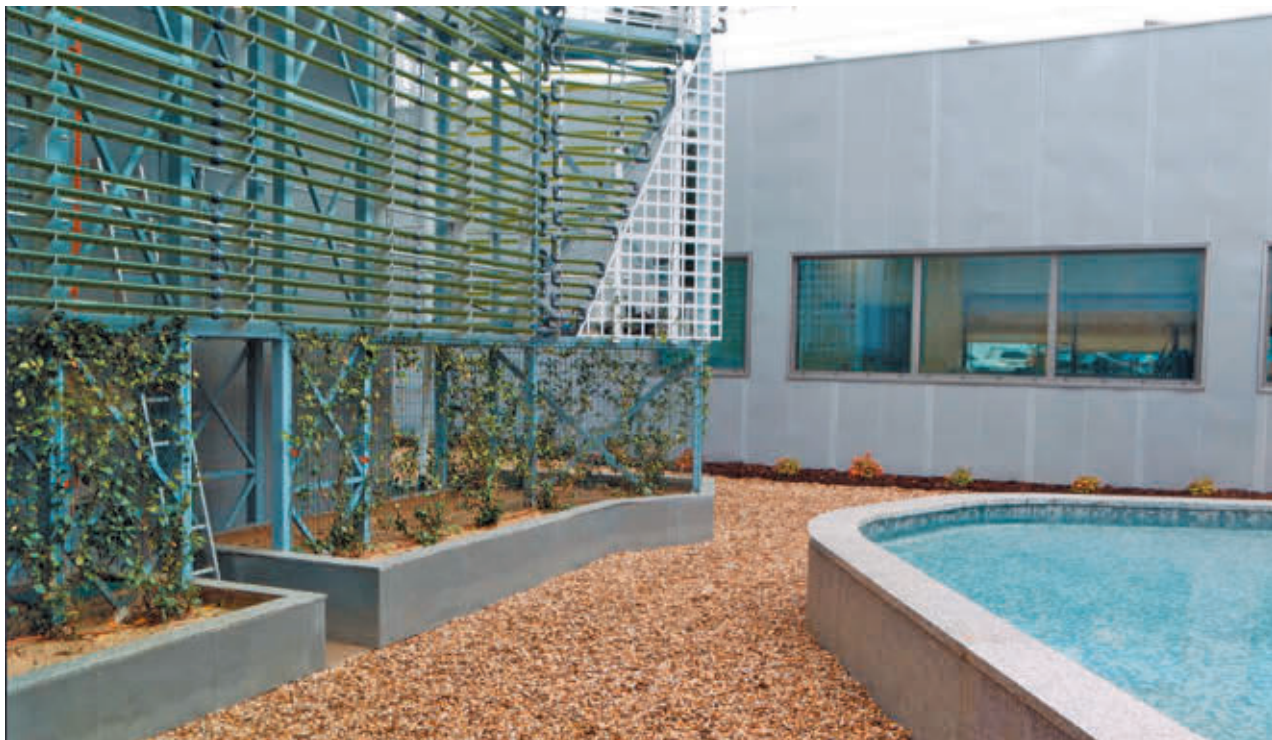
AYTO DE ALCORCÓN