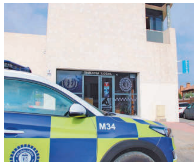
Policía Local de Arganda del Rey

32 en la residencia y 28 en Centro de Día. En la residencia se proporciona una atención integral que incluye alojamiento, manutención apoyo personal y fomento de actividades de ocio y rehabilitadoras para evitar su deterioro. El recurso de atención diurna presta cuidados especializados para potenciar las capacidades sociales de estas personas.