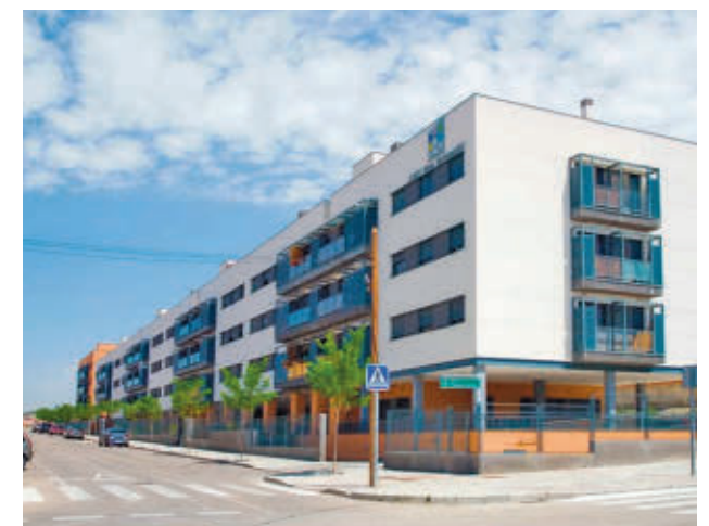
Zona en la que se construyen las viviendas

Se sumarán al importante parque público construido por la EMV desde su fundación: cerca de 3.000 viviendas públicas en propiedad y un parque de 671 viviendas en régimen de alquiler. Se trata de la empresa pública más importante de la Comunidad en relación a su número de habitantes.