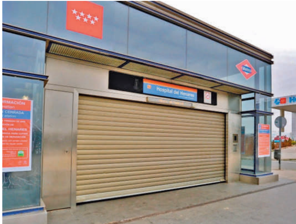
Una de las estaciones cerradas por las obras de la Línea 7B

EL TRAMO DE LA LÍNEA LLEVA CERRADO DESDE VERANO Y NO SE HA ACTUADO