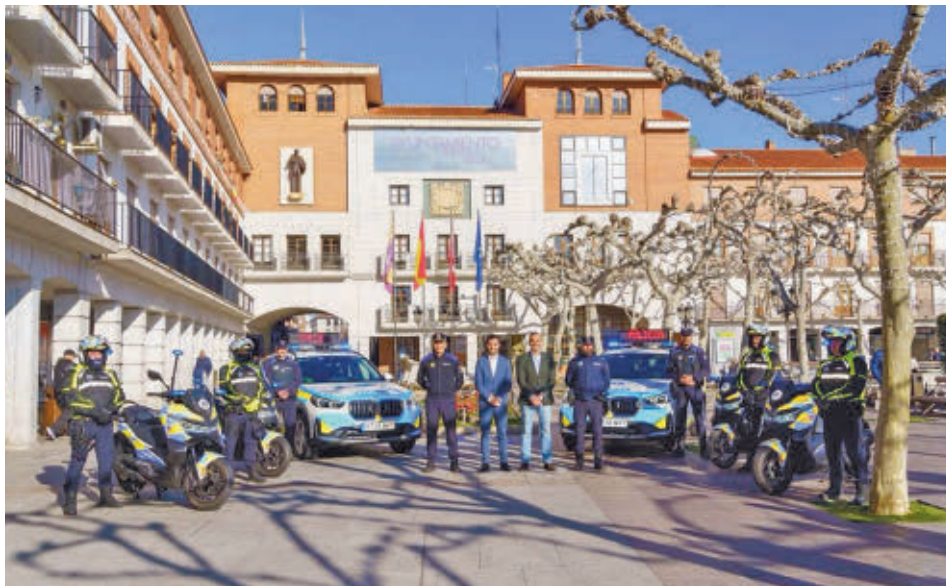
Presentación de los vehículos frente al Ayuntamiento de Torrejón