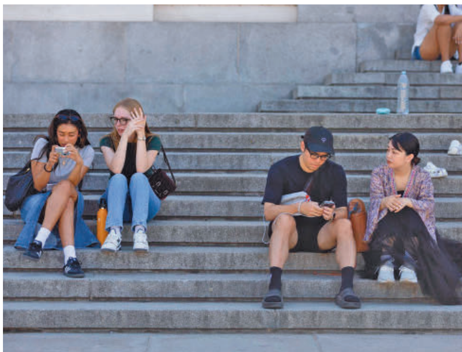
Turistas en Madrid capital