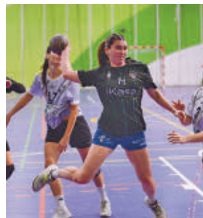
Victoria como locales

La décima jornada de la máxima categoría masculina de rugby depara un choque de rivalidad vecinal. Será este sábado (16 horas) cuando se enfrente Complutense Cisneros y Pozuelo.