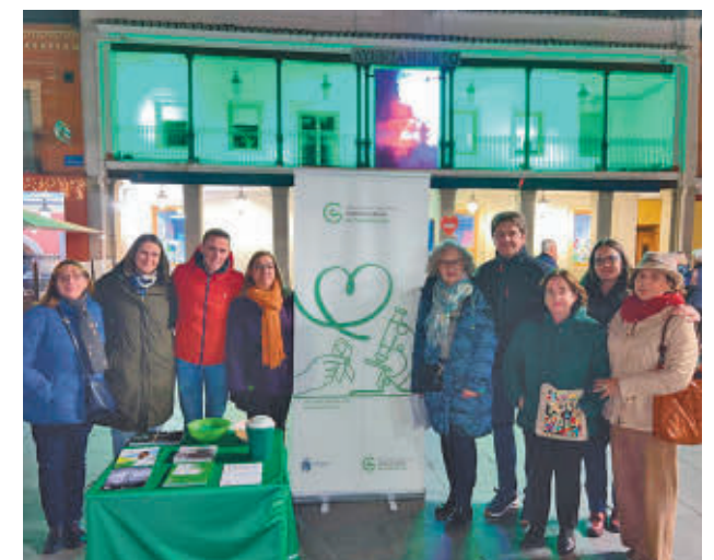
AYTO DE FUENLABRADA

La tarde del martes 4 de febrero se iluminó el edificio del Espacio Joven La Plaza para conmemorar el Día Mundial contra el Cáncer. Un gesto simbólico “para sumar fuerzas, concienciar y apoyar a quienes luchan contra esta enfermedad”, dijo el alcalde, Javier Ayala.