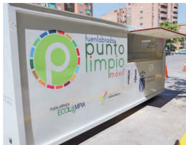
Los puntos limpios se mueven por la ciudad AYTO DE FUENLABRADA

miento. De tal manera que este viernes 7 de febrero podrán encontrarlos en esta franja en la calle Castilla la Nueva con Teruel y en la vía de Leganés 44, mientras que el sábado 8 estarán situados en la calle Grecia 27 y en la de Venezuela con Colombia. Ya el domingo 9 de febrero se trasladarán a la avenida Pablo Iglesias, frente al Centro comercial de Loranca.