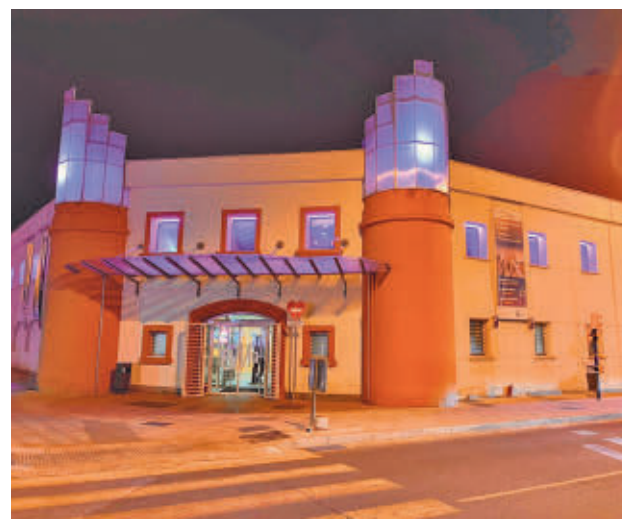
Los eventos se llevarán a cabo en el Centro para la Igualdad