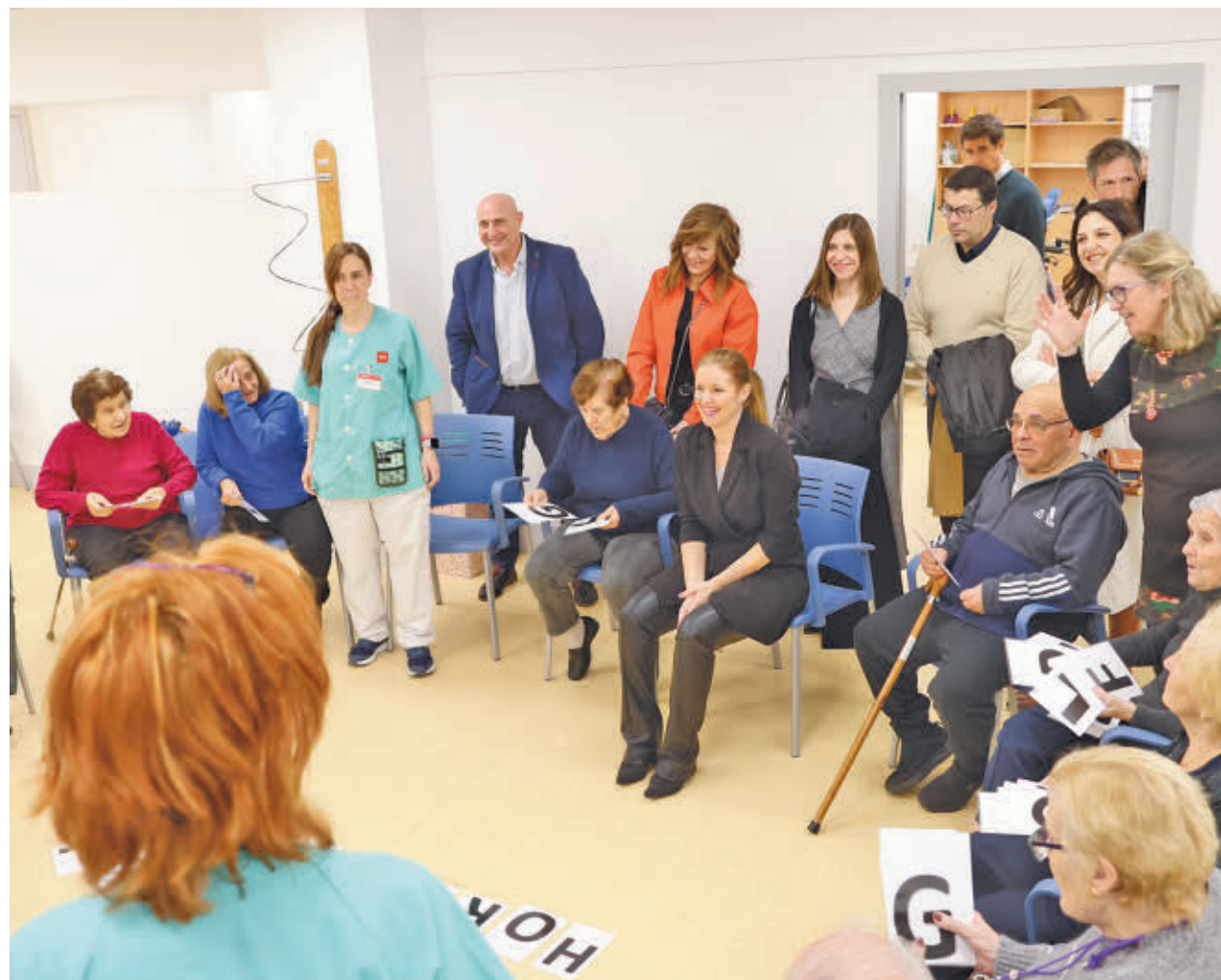
COMUNIDAD DE MADRID