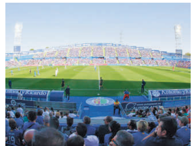
Buscan cambiar Los Espartales por Coliseum AYTO DE GETAFE

No es lo único, ya que la primera edil también ha solicitado al Gobierno autonómico que se rinda un pequeño homenaje a su actual topónimo, que hace referencia a los campos que generaban materia prima para el esparto antiguamente.