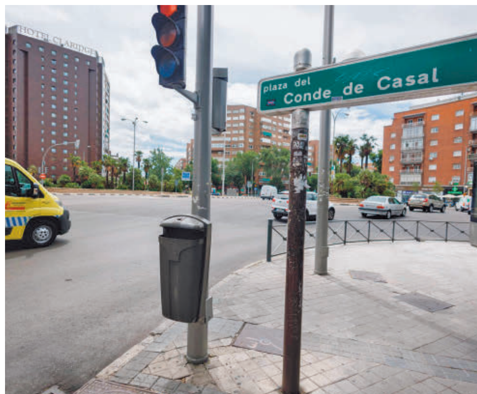
La plaza de Conde de Casal, con el hotel allí emplazado, al fondo

Los usuarios del Centro Dotacional Integrado Ángel del Río, pueden contemplar ya en sus instalaciones documentos, fotografías, escritos e, incluso, el pregón de San Isidro que el periodista pronunció en 2003, donados por su familia al Ayuntamiento de la capital.