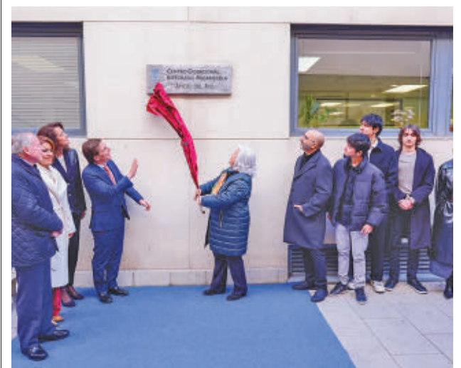
Un momento de la ceremonia institucional