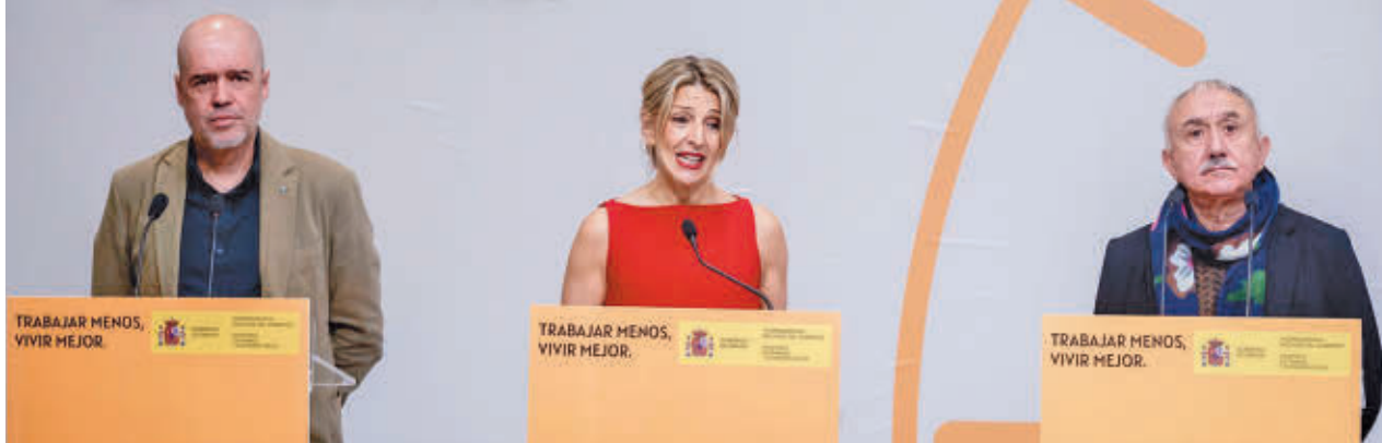
Imagen de la rueda de prensa en la que se anunció el acuerdo entre el Ministerio y los sindicatos