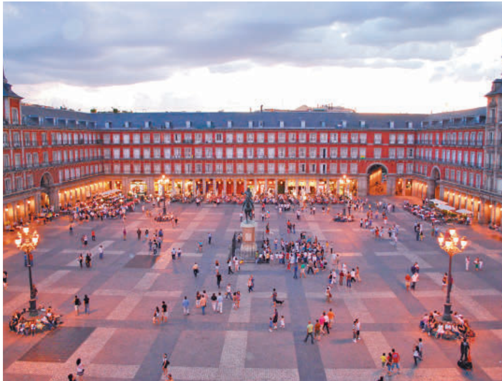
La plaza Mayor es uno de los lugares más visitados de la capital

EL TURISMO INTERNACIONAL CRECIÓ UN 8% CON RESPECTO A 2023