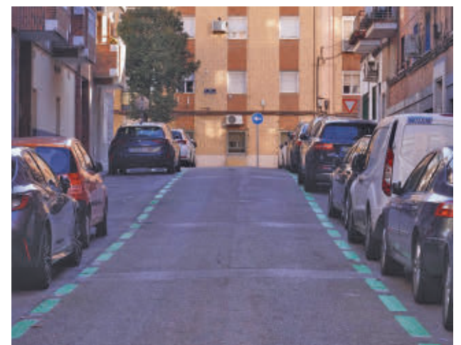
La zona SER del barrio de Moscardó (Usera)

"Uno dará de alta y estimará el tiempo en el que va a estar. Si está 50 minutos, pagará por el uso real del estacionamiento, una cosa que antes no sucedía", añadió.