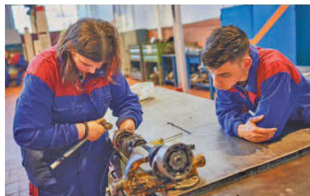
Alumnos de Formación Profesional E. P.

“La disponibilidad de tantos puestos formativos es inasumible por parte de los centros, de las administraciones y de las empresas”, ha expresado la directora general de Educación Secundaria, Formación Profesional y Régi-