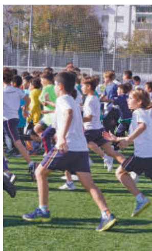
El deporte estará presente

saludables entre los jóvenes del distrito que se impartirá en los centros de educación Secundaria, tras la firma la semana pasada de un convenio con la Fundación Quirón Salud. 'Stay Health' constará de diferentes sesiones