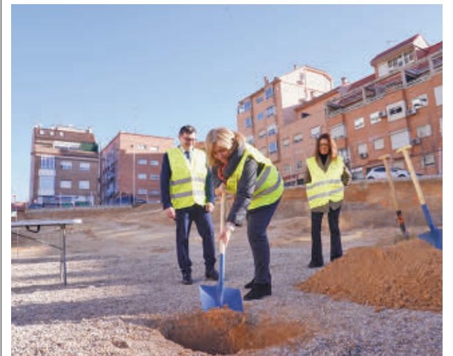
La vicealcaldesa de Madrid, Inma Sanz, pala en mano

"El precio del alquiler de estos futuros pisos, que previsiblemente finalizarán su construcción a mediados del año 2027, no superará nunca el 30% de los ingresos de la unidad familiar", comentó la vicealcaldesa, Inma Sanz.