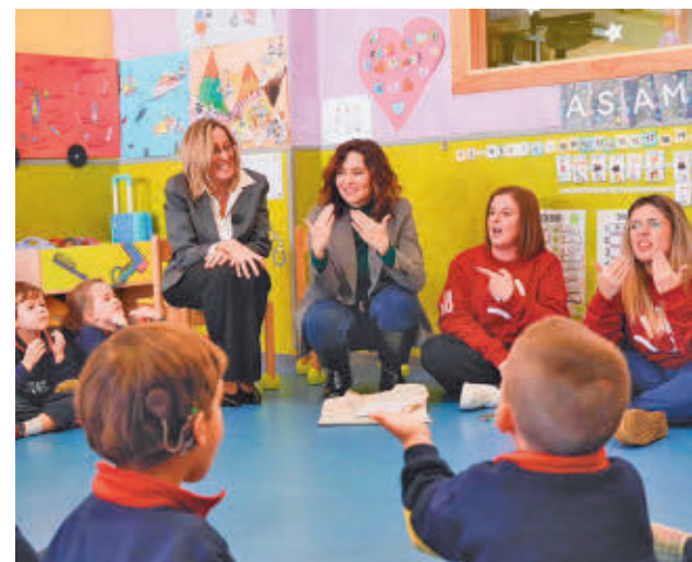
Visita de Díaz Ayuso a un centro escolar