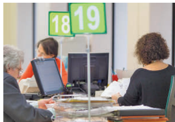
Se cambiará el control de los horarios

"Va a ser digital, interoperable, con control remoto y en el que la Inspección de Trabajo va a saber en tiempo real cuáles son las jornadas que cualquiera va a hacer", explicó la ministra. El objetivo es que el registro de la jornada sea