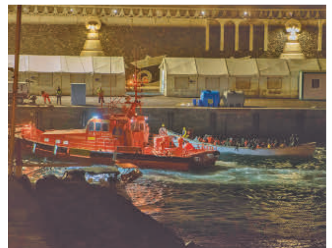
Embarcaciones llegando a las costas canarias

Por otro lado, han aumentado las llegadas por vía terrestre en Ceuta y Melilla, ya que un total de 95 personas entraron de forma irregular, dos menos que en enero del 2024. A Ceuta han arribado 89 migrantes, uno menos que el año pasado, y a Melilla seis, tres más que en 2024.