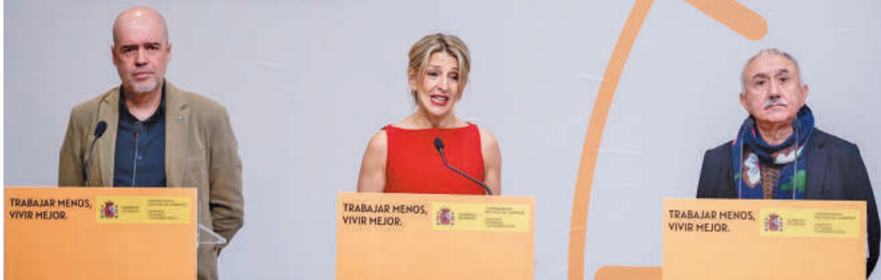
Imagen de la rueda de prensa en la que se anunció el acuerdo entre el Ministerio y los sindicatos