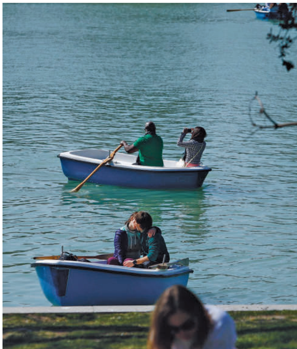
Las parejas jóvenes que comparten su vida son cada vez más escasas

Por otra parte, el estudio revela que ha crecido la proporción de los jóvenes que