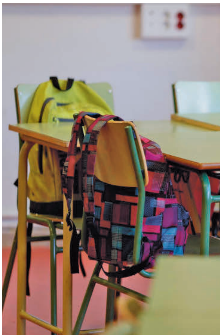
Centro educativo en Madrid

Díaz Ayuso ha insistido en que esta medida mejorará la convivencia en los centros educativos, con el objetivo de “proteger a la infancia” y alejarse de contextos más cercanos a nuevas adicciones o a bandas, además de apostar por la conciliación. “Ayuda a las familias también a conciliar, que estén más tranquilas porque saben que están en un lugar seguro, el de siempre, un entorno mucho más protegido con sus rutas, sus comedores, con sus amigos, para prolongar