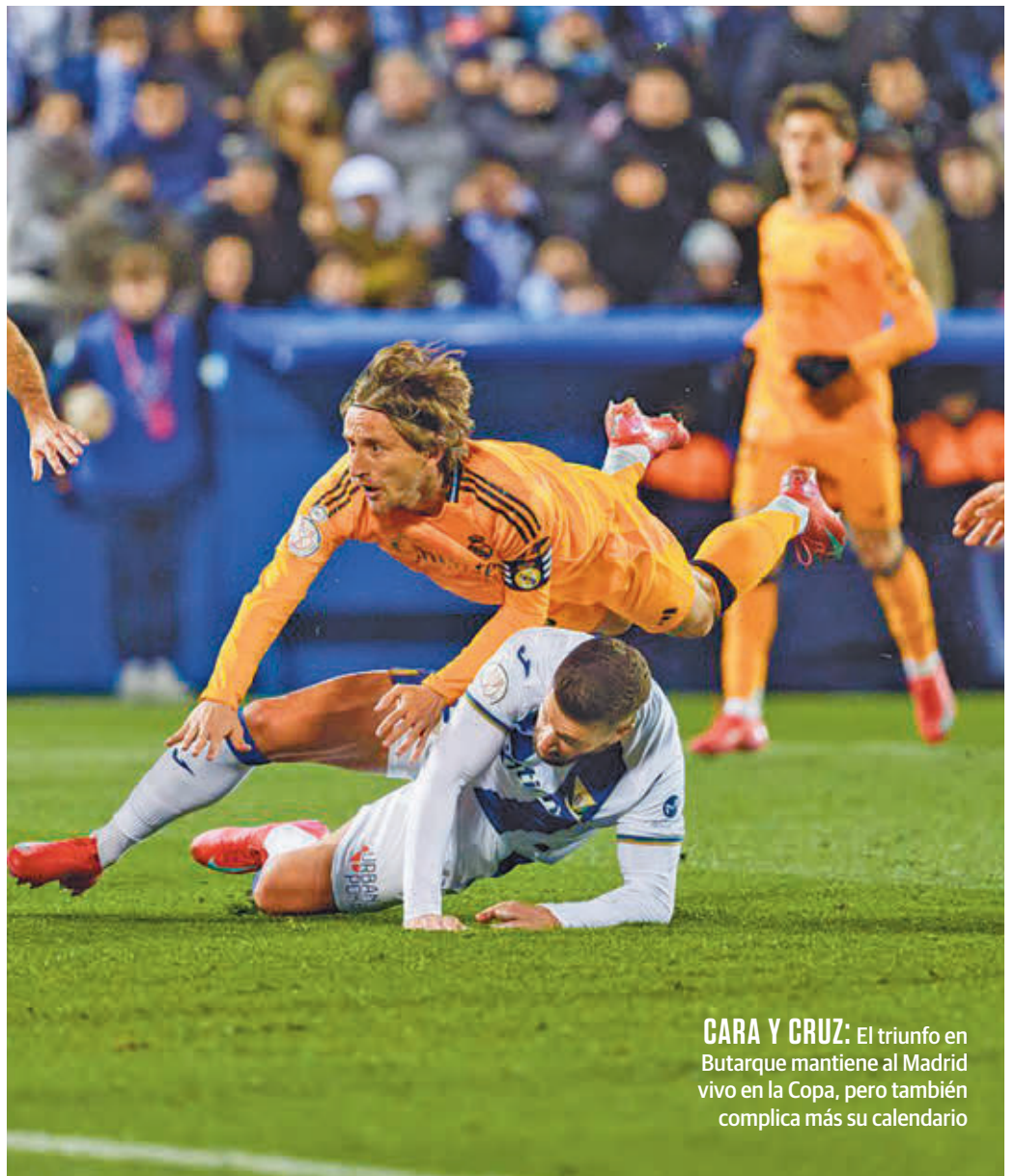
CARA Y CRUZ: El triunfo en Butarque mantiene al Madrid vivo en la Copa, pero también complica más su calendario

Ya el miércoles 19 llegará uno de los partidos que pueden marcar la temporada en la casa blanca, para bien o para mal, la vuelta de Champions League con el Manchester City. A continuación,