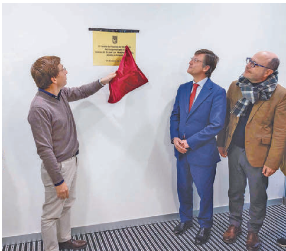
El alcalde descubrió la placa conmemorativa del estreno oficial de la dotación