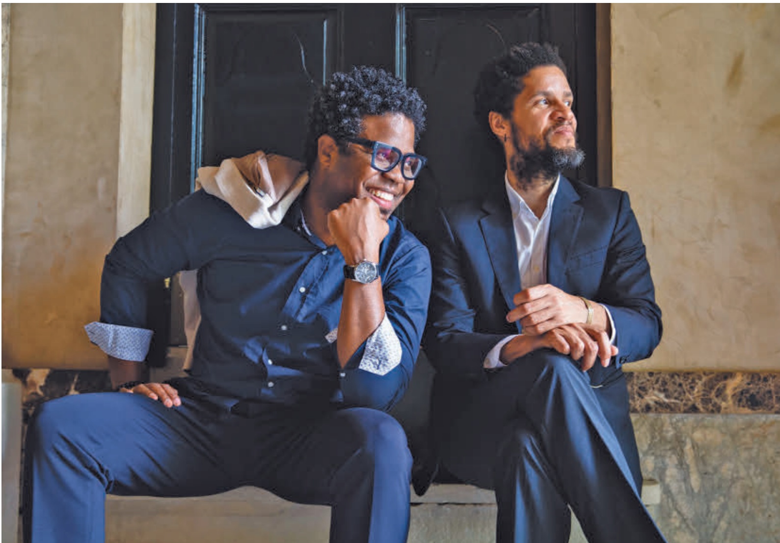
Foto promocional de los dos artistas de origen cubano