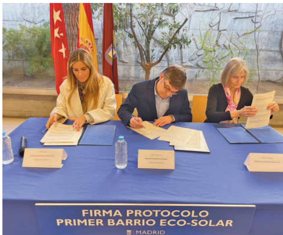
Un momento de la firma del protocolo que permitirá la puesta en marcha del proyecto

ññ GenteMadrid.es Consulte la actualidad regional y local en nuestra página web