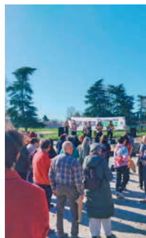
Un momento de la protesta

a la estación de Metro de Eugenia de Montijo, para volver para exigir la construcción de viviendas públicas en los terrenos de la antigua cárcel de Carabanchel, transferidos por el Ministerio del Interior a la nueva empresa públi-