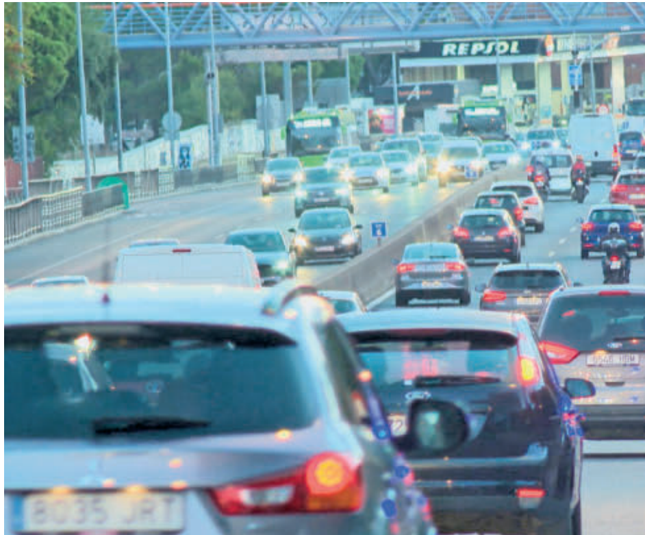
La medida busca mejorar el transporte público, pero genera problemas en la salida de Móstoles

“ESTE ES EL SUPPLICIO DIARIO QUE VIVIMOS EN MÓSTOLES POR EL CARRIL BUS”