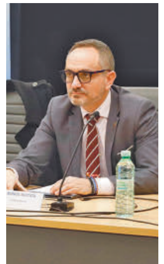
El alcalde asistió al acto