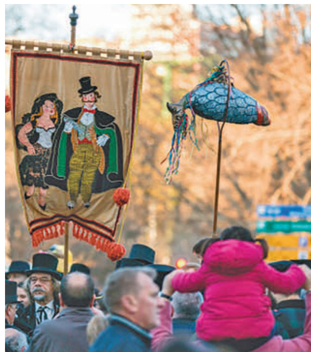
La tradición madrileña vuelve a Móstoles tras más de 10 años

El evento comenzará con la procesión de una gran sardina y culminará con su simbólica quema, tras el pregón del entierro. Las asociaciones y entidades que deseen participar pueden inscribirse