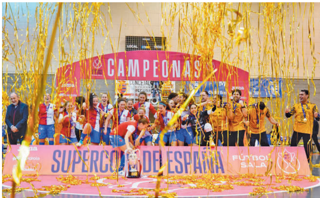
El Pabellón Municipal Móstoles Sur acogió con lleno absoluto la final en la que el Futsi Navalcarnero se coronó campeón