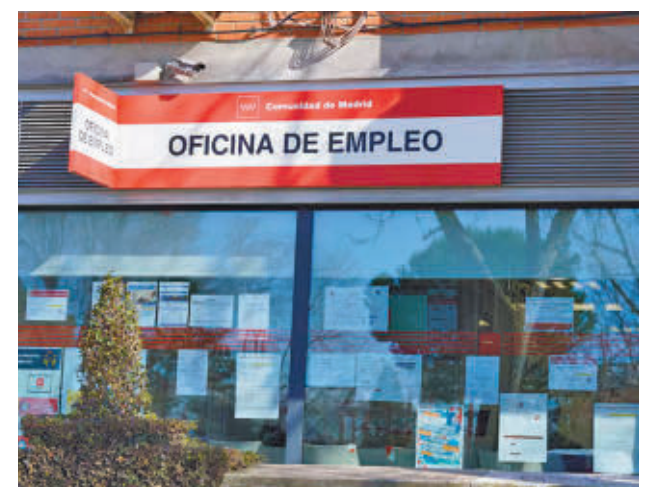
La estacionalidad de enero impacta en la creación de empleo

Fuentes municipales destacan que enero es un mes complicado para el empleo debido a la finalización de la campaña de Navidad en sectores como el comercio y la hostelería. En la Comunidad de Madrid, el paro ha subido un 1,25%, alcanzando los 287.570 desempleados.