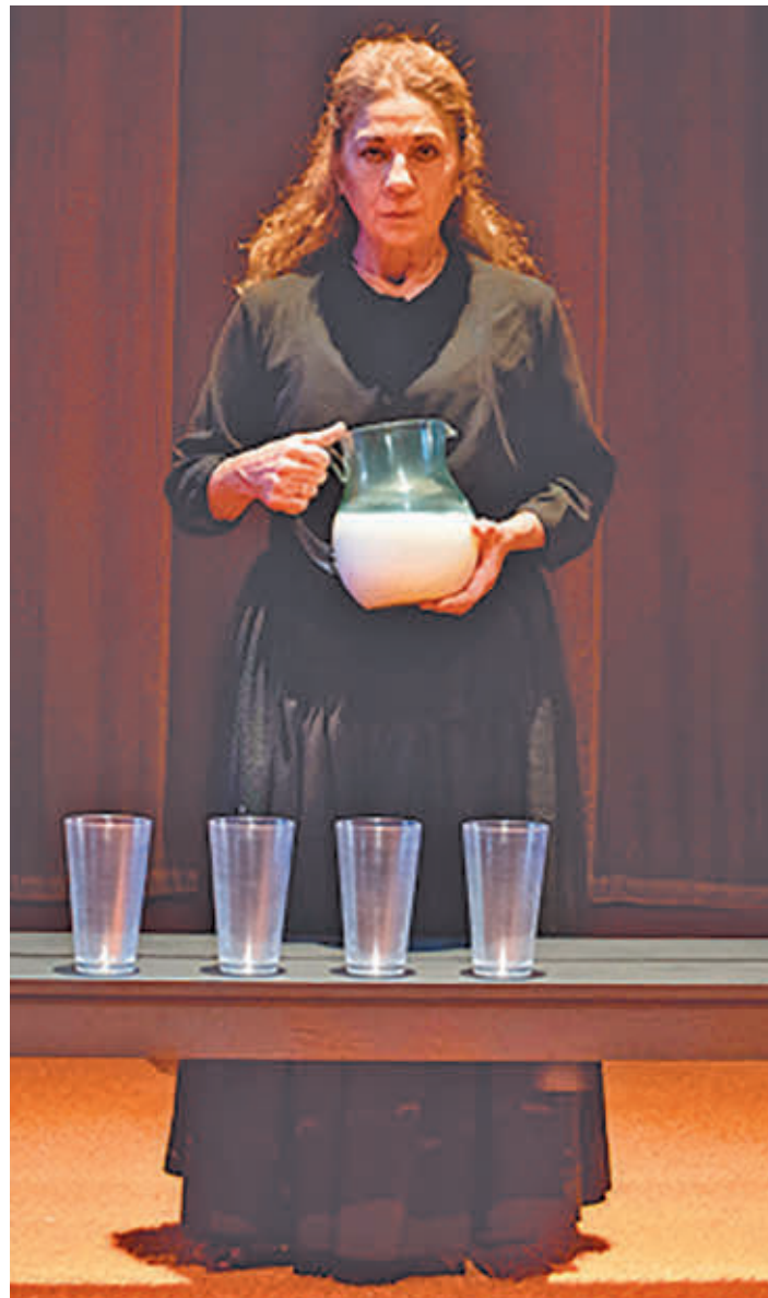
En esta versión Poncia, la criada de Bernarda Alba, es la protagonista

Magüi Mira reinventa la mirada de Poncia, basada en el drama de Lorca • Lolita Flores protagoniza la versión de este clásico • Exposiciones, cine y teatro completan la agenda semanal