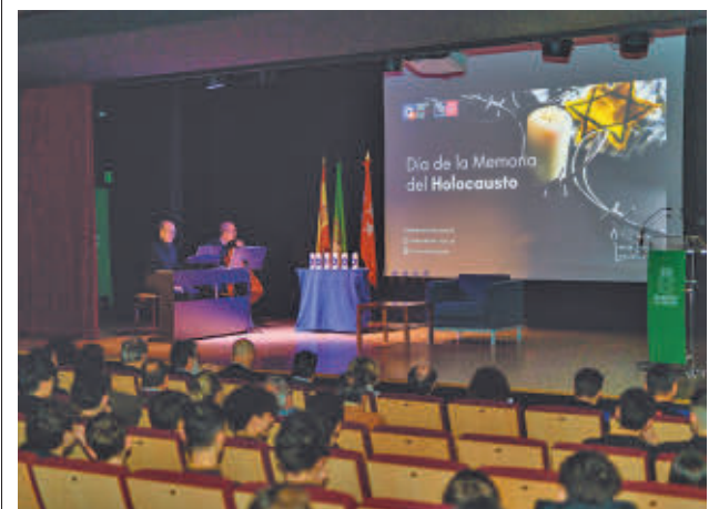
Un momento del acto de recuerdo

El programa continuará en febrero y marzo con la fase de mentorías. Cada entidad social contará con tres sesiones con un mentor que les ayudará a poner en marcha su proyecto, hacer su 'pitch' (presentación corta, atractiva y precisa de su empresa o proyecto) y defender una propuesta de colaboración ante empresas. El programa finalizará con un 'Demoday' de las iniciativas para poner en práctica lo aprendido, exponiendo en público una idea de colaboración empresarial.