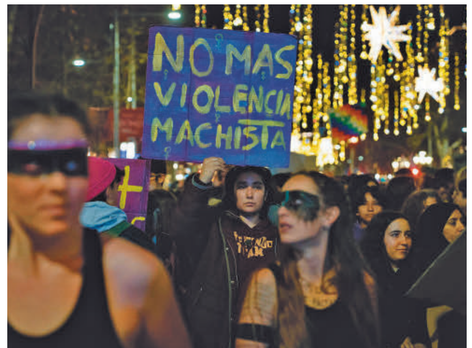
Manifestación contra la violencia machista

El mes de enero con mayor número de mujeres asesinadas fue el del año 2006, cuando