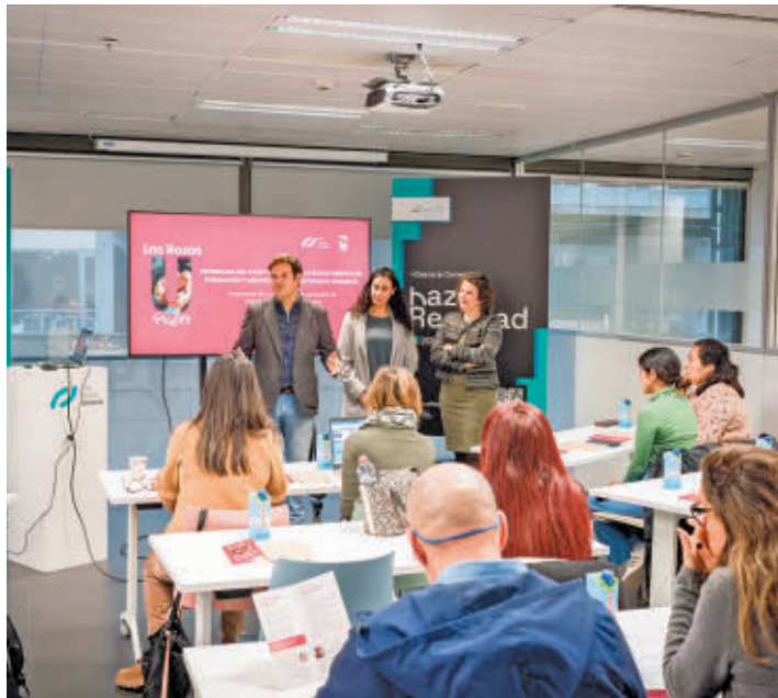
El alcalde asistió a la primera sesión de formación

El Hub de Las Rozas Innova acogió el pasado 29 de enero la primera jornada de 'Las Rozas Unidos', el Programa de Formación y Mentorías de Las Rozas Innova y el Ayuntamiento de Las Rozas para entidades sociales de la localidad, que tiene como objetivo enseñar a las asociaciones a generar alianzas con empresas para desarrollar acciones sociales conjuntas.