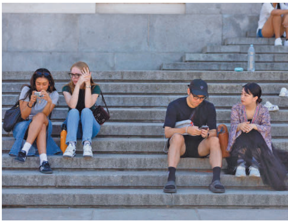
Turistas en Madrid capital