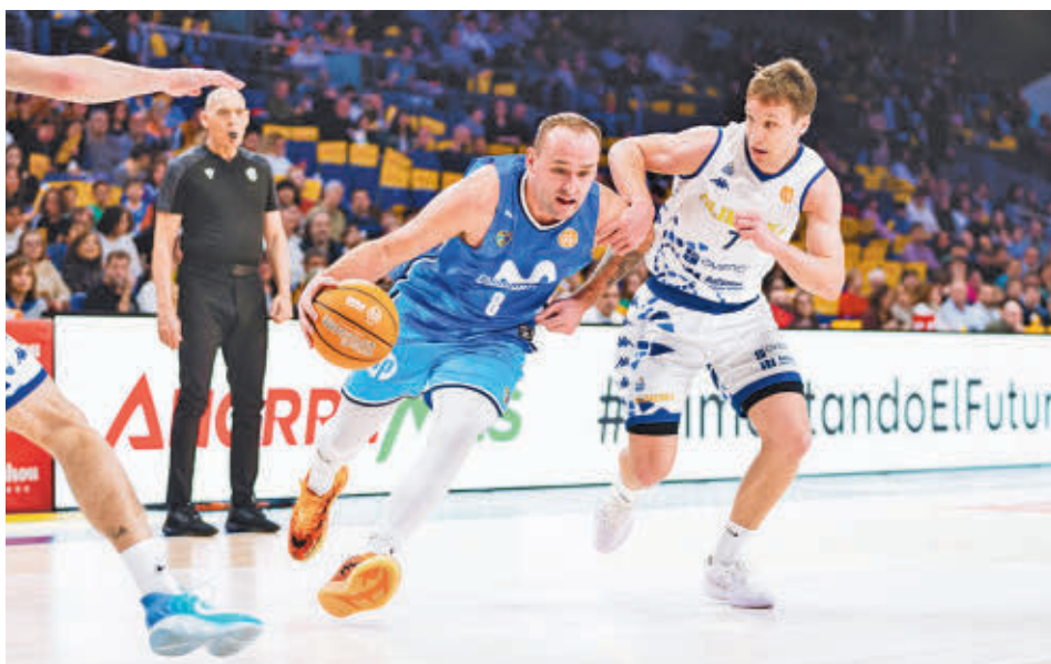
El Alimerka Oviedo dio la campanada en el Movistar Arena (76-81)