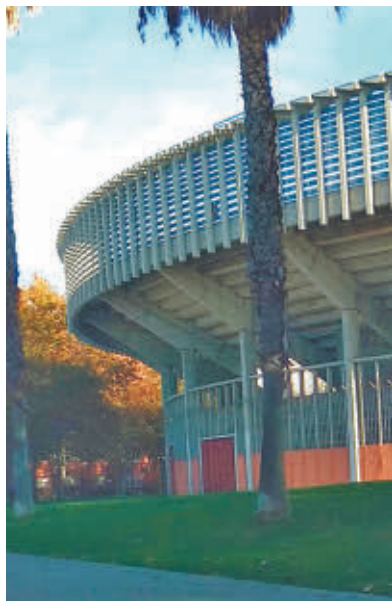
La Plaza de Toros E.P

La transformación de la Plaza de Toros, que lleva en desuso desde 2016 tras detectarse deficiencias en su estructura, saldrá del concurso internacional 'European 18'. La finalidad es convertirla en "un espacio interdisciplinar respetuoso con el descanso en el entorno". En su presentación, el Ayuntamiento ha destacado como algo muy positivo su cercanía a espacios de ocio y encuentro o a la estación