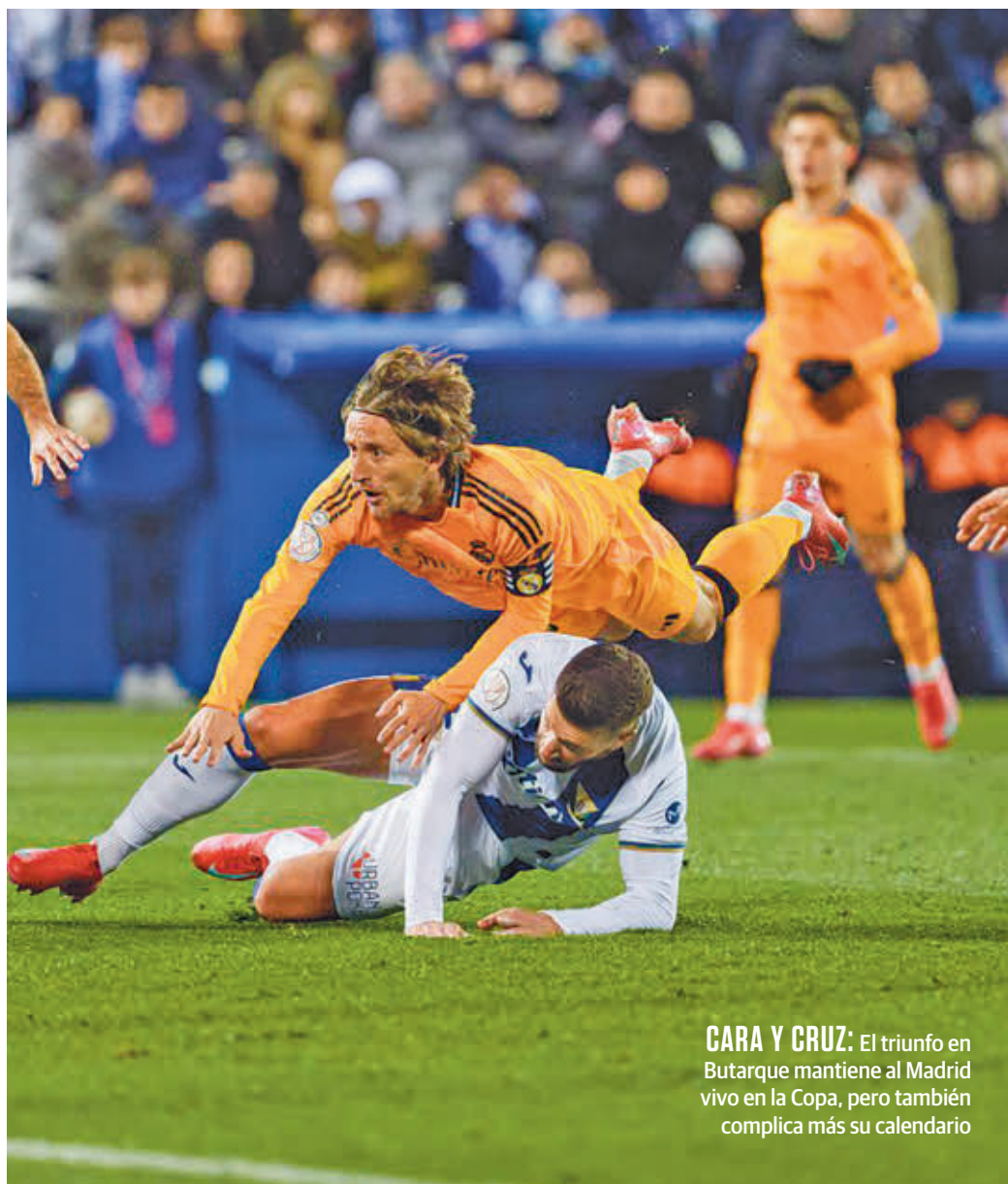
CARA Y CRUZ: El triunfo en Butarque mantiene al Madrid vivo en la Copa, pero también complica más su calendario

Ya el miércoles 19 llegará uno de los partidos que pueden marcar la temporada en la casa blanca, para bien o para mal, la vuelta de Champions League con el Manchester City. A continuación,