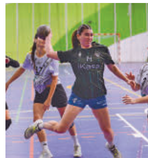
Victoria como locales

La décima jornada de la máxima categoría masculina de rugby depara un choque de rivalidad vecinal. Será este sábado (16 horas) cuando se enfrente Complutense Cisneros y Pozuelo.