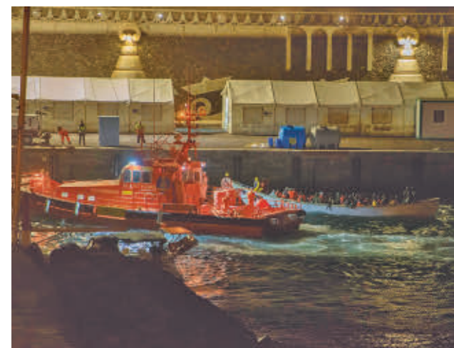
Embarcaciones llegando a las costas canarias

Por otro lado, han aumentado las llegadas por vía terrestre en Ceuta y Melilla, ya que un total de 95 personas entraron de forma irregular, dos menos que en enero del 2024. A Ceuta han arribado 89 migrantes, uno menos que el año pasado, y a Melilla seis, tres más que en 2024.