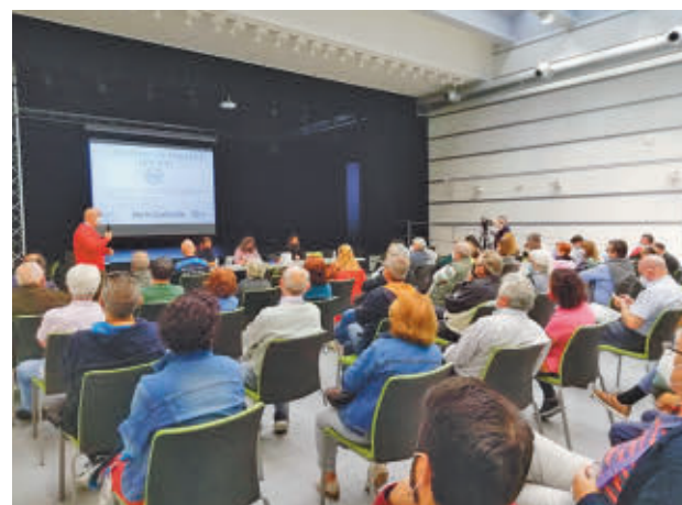
Se retoman los encuentros

Consulte la actualidad regional y local en nuestra página web