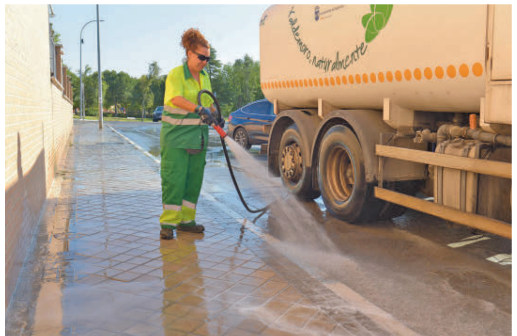
Servicio de limpieza del Ayuntamiento de Valdemoro

Además de retirar los residuos de la vía pública y el vaciado de las papeleras, la nueva empresa será la responsable de trasladarlos a los centros de tratamiento autoriza-