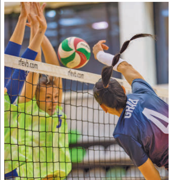
Triunfo importante del Madrid Chamberí RFEVB

ocupa la sexta posición y que, además, llega a este compromiso con el subidón de moral que supuso convertirse en el primer equipo que ha sido capaz de derrotar en la presente temporada al líder, el Heidelberg-Volkswagen. Al margen del resultado que se dé en este partido, el Madrid Chamberí también seguirá con atención lo que suceda en Lugo. Allí se verán las caras el colista, el Barça, y el penúltimo clasificado, el Arenal Emeve.