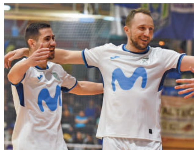
Baño de autoestima en Valdepeñas

viernes 14 regresa la fase regular de la Liga. En ella, al Inter le tocará hacer las maletas de nuevo, en esta ocasión con destino a Jaén, un equipo que ahora mismo es quinto en la tabla y que viene de eliminar en la prórroga al Barça en la Copa del Rey. En el antecedente de la ida, el Inter Movistar se impuso por 6-2 en el Jorge Garbajosa.