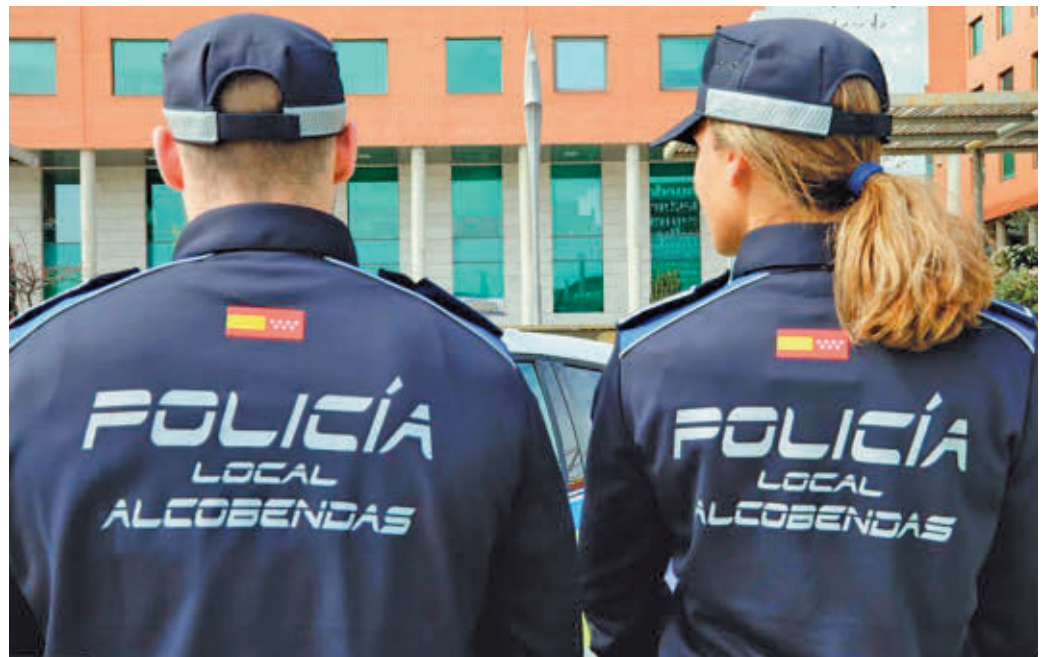
Las actuaciones preventivas son fundamentales

Desde el Gobierno municipal ponen el acento en la creación de un grupo de trabajo transversal en el que se atienden las incidencias desde el punto de vista tanto policial como social. A partir de ahí, el protocolo de actuación de la Policía Local, además de regular las actuaciones operativas, incluye también como eje estratégico