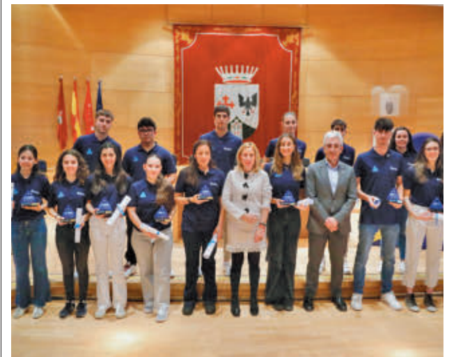
Foto de familia de los becados con la alcaldesa y el concejal

La alcaldesa aseguró estar "muy orgullosa de todos nuestros deportistas locales". "Habéis llevado nuestra ciudad hasta lo más alto y sois una parte fundamental de nuestro título como Ciudad Europea del Deporte 2025", añadió.