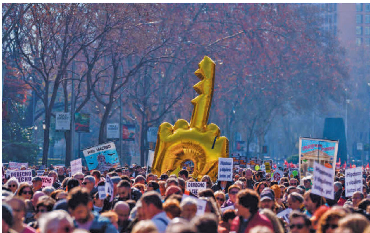
Manifestación del pasado domingo en las calles de Madrid