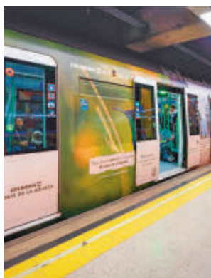
Convoy de Metro

talmente. La víctima llevaba una cartera de mano que quedó enganchada a la puerta del vagón cuando esta se cerraba, provocando que tropezara y cayera a las vías. El agente activó el freno de emergencia para detener el convoy, logrando alzar al varón hasta el andén para po-