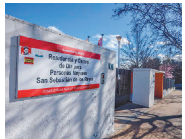
La cifra asciende a los 9 millones de euros

Las inscripciones, obligatorias para poder participar en este programa, se realizarán hasta el día 24. Eso sí, debido a un cambio en el software del Servicio de Atención Ciudadana, hasta las 14 horas de este 14 de febrero se cursarán vía online y desde el martes 18 y hasta el día 24 se tramitarán por teléfono, llamando al 010 o al 91 296 90 88.