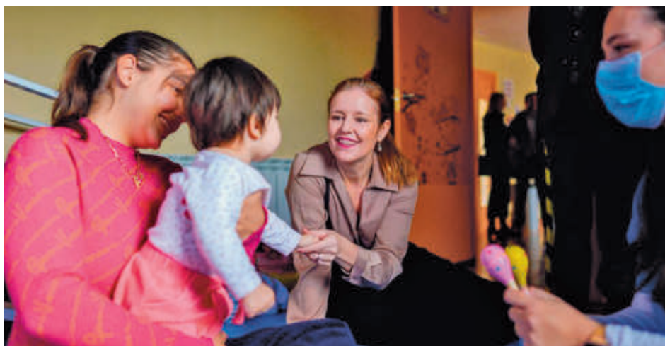
Visita de la consejera al centro