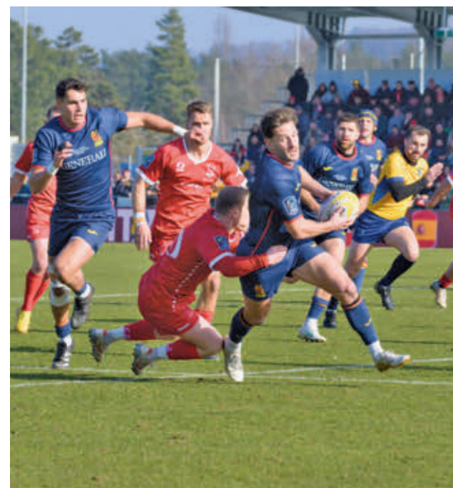
El triunfo en Suiza dio la clasificación para el Mundial de 2027

Además, el Silbó San Pablo Burgos defenderá su liderato en casa ante otro ilustre, el Monbus Obradoiro.