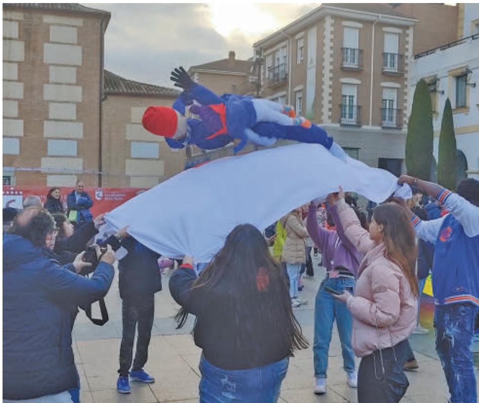
El manteo del Pelele será el martes 4 de marzo