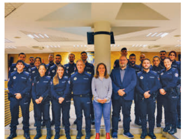
La Policía Local incorporó en diciembre a 19 nuevos agentes

El Cuerpo de la Policía Local reforzó su plantilla el pasado diciembre con 19 nuevos agentes, lo que ayuda a incrementar la seguridad en la localidad.