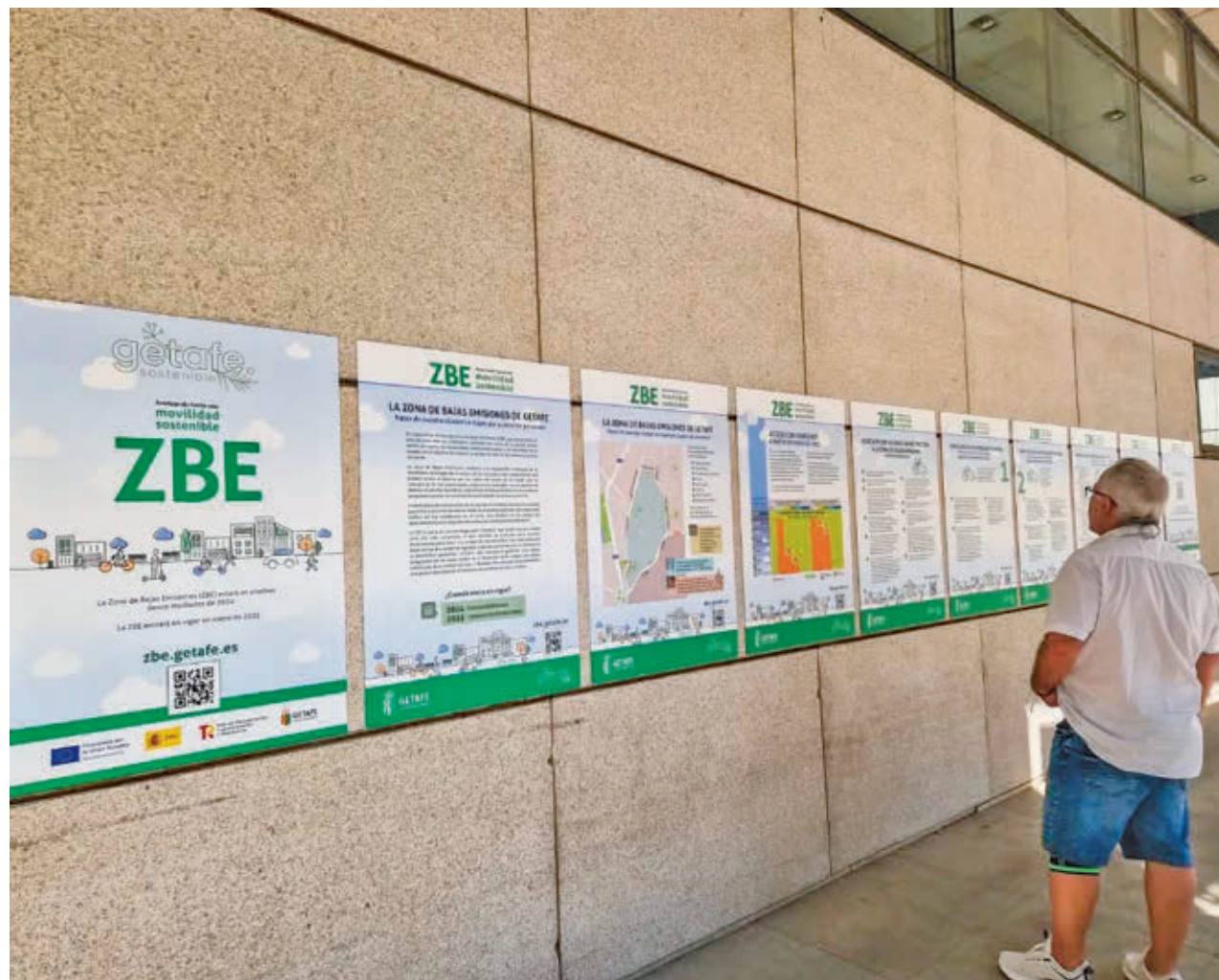
AYTO DE GETAFE