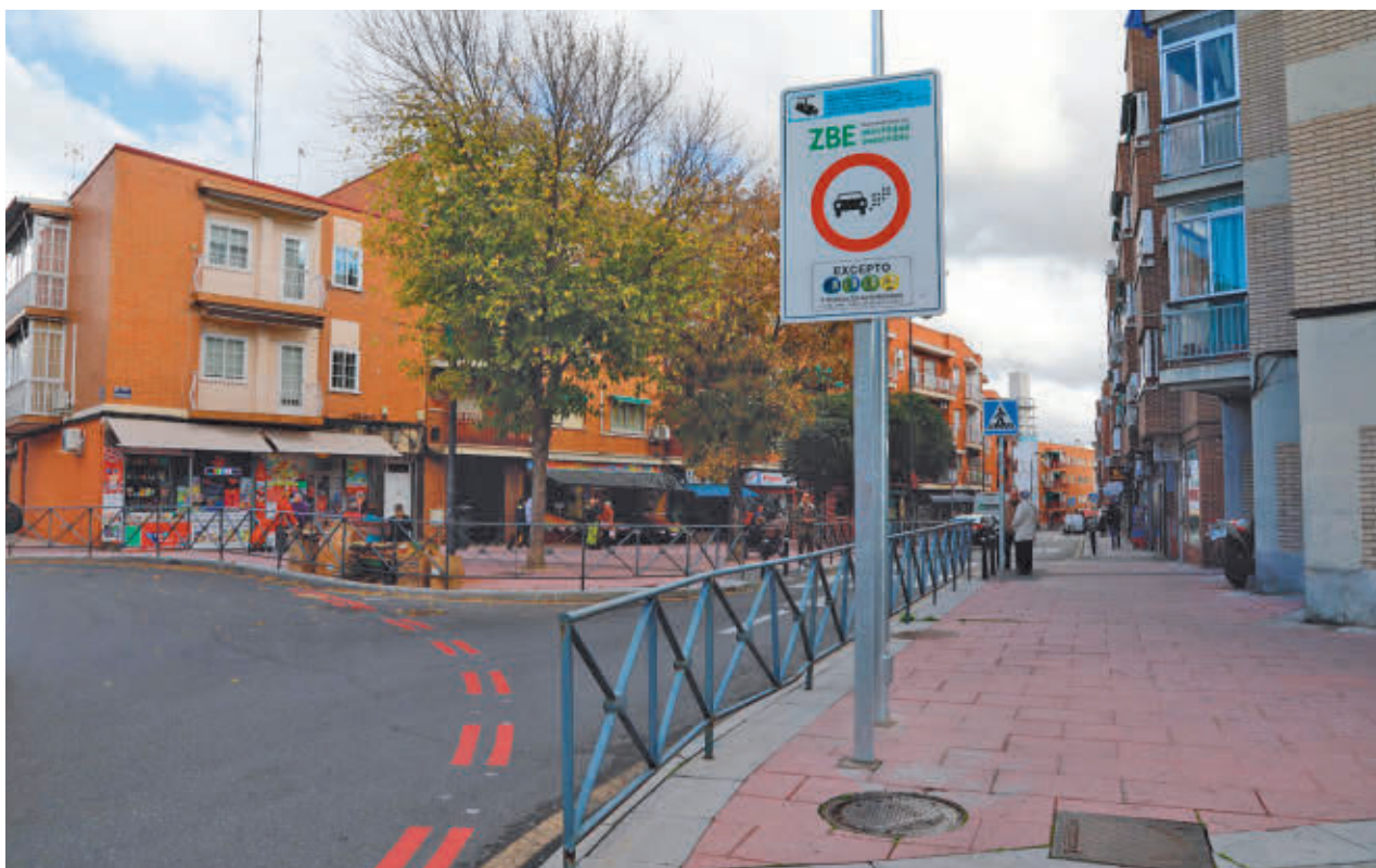
Getafe dará más tiempo a los vecinos para sus trámites con la ZBE AYUNTAMIENTO DE GETAFE