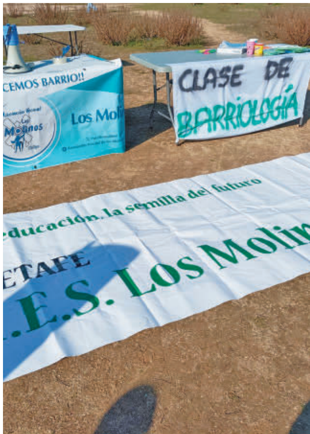
Clase de 'barriología' IESLOSMOLINOSGETAFEYA

LA COMUNIDAD SEÑALA QUE LA REDACCIÓN DEL PROYECTO HA SIDO ADJUDICADA