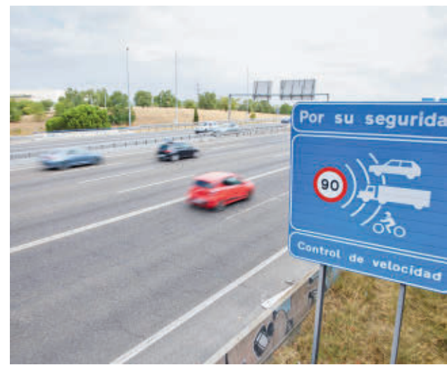
Un cartel anuncia un radar en Madrid