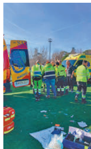
La intervención del Samur

El hombre finalmente recuperó la consciencia y fue trasladado al Hospital Gregorio Marañón.