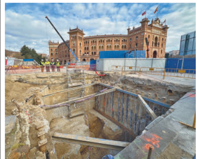
Los trabajos de mejora de la accesibilidad en Ventas

Los trabajos se añaden a la reciente remodelación de la calle de Condesa Vega del Pozo, muy próxima a estas dos calles. El proyecto, que contó con un presupuesto de casi medio millón de euros, tuvo por objeto la consolidación de la peatonalización de la calle junto con la naturalización del ámbito.