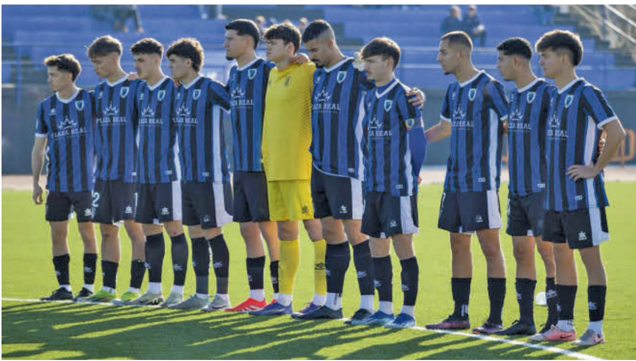
Un triunfo y un empate consecutivos han colocado al Parla cerca de los puestos de salvación AD PARLA