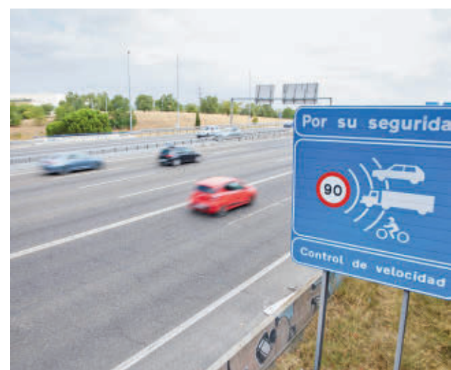
Un cartel anuncia un radar en Madrid