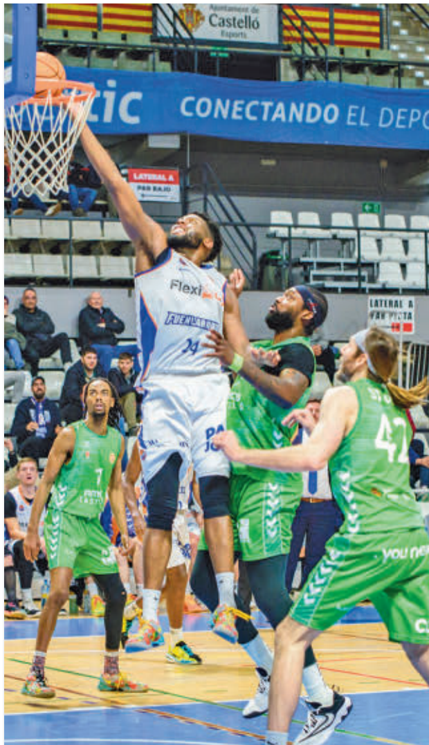
Victoria del Fuenlabrada en Castellón

Hasta el momento parece que esa vorágine no le ha pasado factura al líder, el Silbó San Pablo Burgos, quien, eso sí, tuvo que sufrir para llevarse este pasado miércoles el triunfo de la pista del Súper Agropal Palencia (85-87). A pesar de esos apuros, los bur-