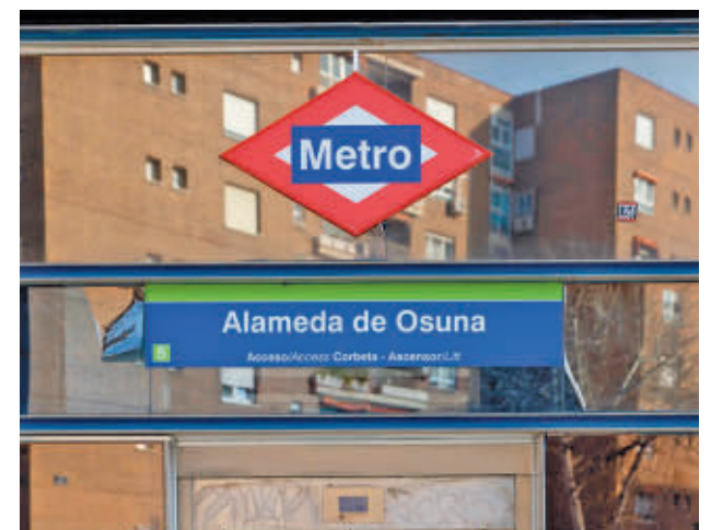
Estación de Metro de Alameda de Osuna

Estos trabajos financiados con fondos europeos beneficiarán a los más de 66 millones de personas que han utilizado este año el aeropuerto civil más importante de España y tercero de Europa.