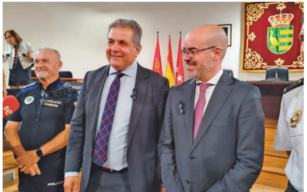
El delegado del Gobierno, durante una visita a Parla

"Parla es una ciudad segura con una evolución negativa en los últimos años que hemos abordado. Y eso se ha visto ya reflejada con una mejora en los resultados del