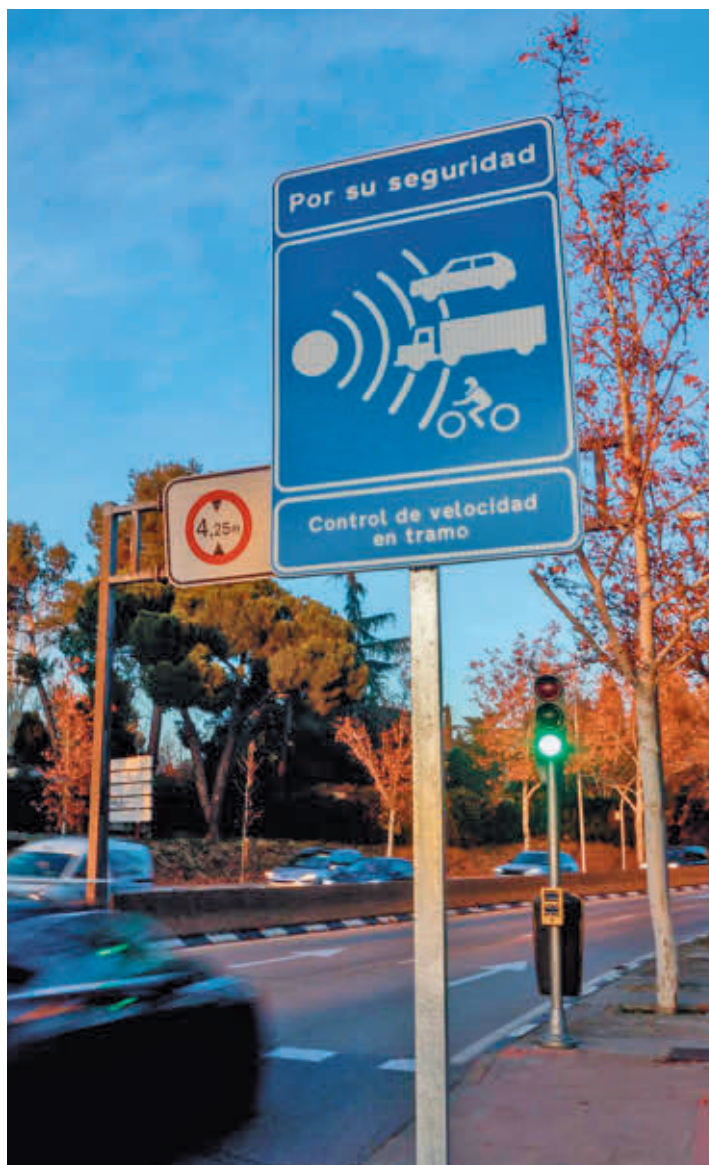
Radar de velocidad en Madrid

Además, la Comunidad de Madrid lidera el ranking de denuncias en función de la extensión de su red de carreteras, con 187 denuncias por kilómetro, mientras que el número de multas formuladas en función del parque au-