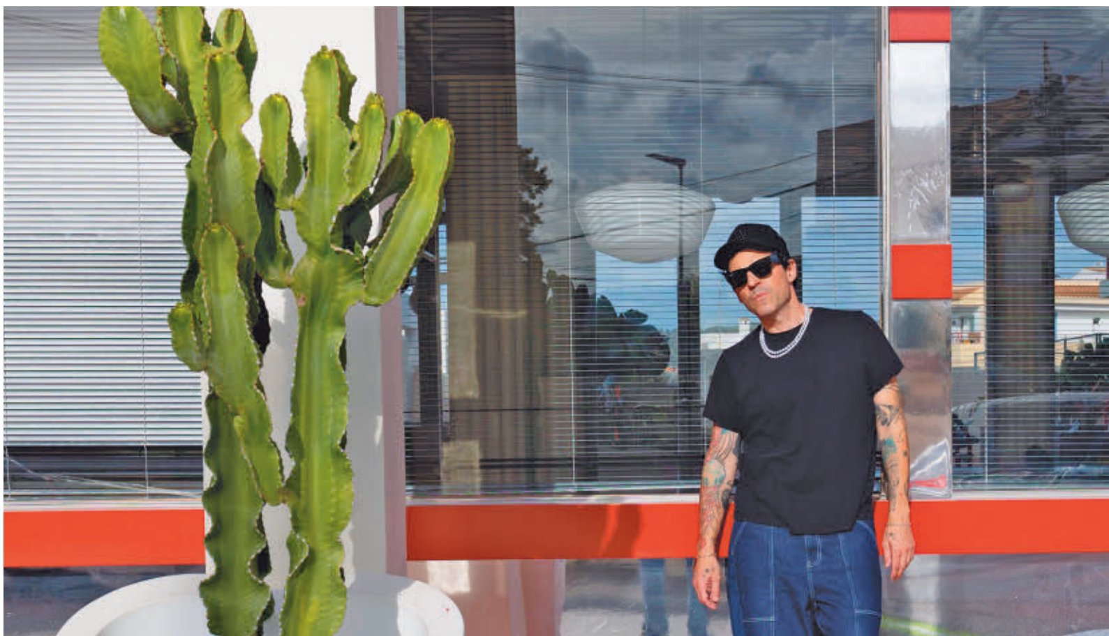
En la gira se mezclarán las canciones del nuevo disco "con clásicos revisitados"

"SENTIR LA EXCITACIÓN DE HACER ALGO NUEVO NO ESTÁ PAGADO"