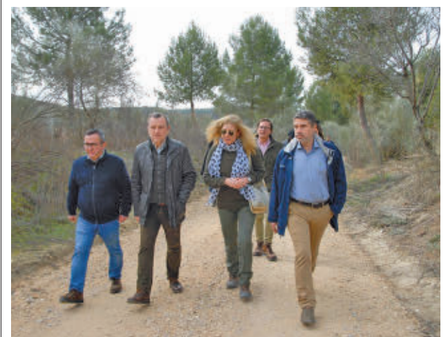
Presentación de la iniciativa