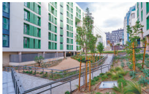
Una promoción de vivienda pública construida en la capital

En concreto, Madrid cuenta con un parque residencial de 9.082 pisos sociales destinados a arrendamiento asequible, un 44% más en solo