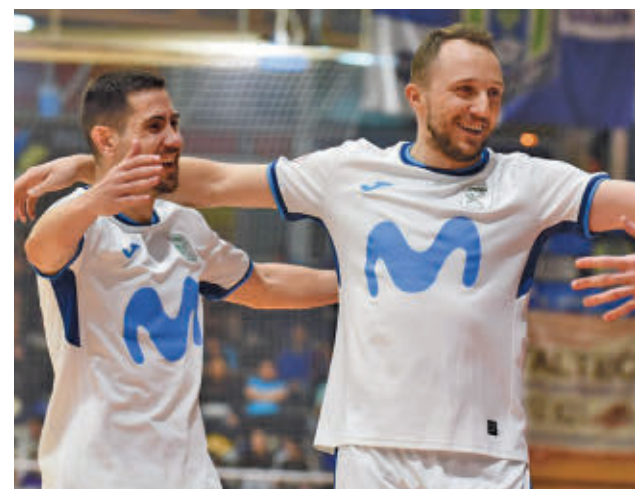
Baño de autoestima en Valdepeñas

viernes 14 regresa la fase regular de la Liga. En ella, al Inter le tocará hacer las maletas de nuevo, en esta ocasión con destino a Jaén, un equipo que ahora mismo es quinto en la tabla y que viene de eliminar en la prórroga al Barça en la Copa del Rey. En el antecedente de la ida, el Inter Movistar se impuso por 6-2 en el Jorge Garbajosa.