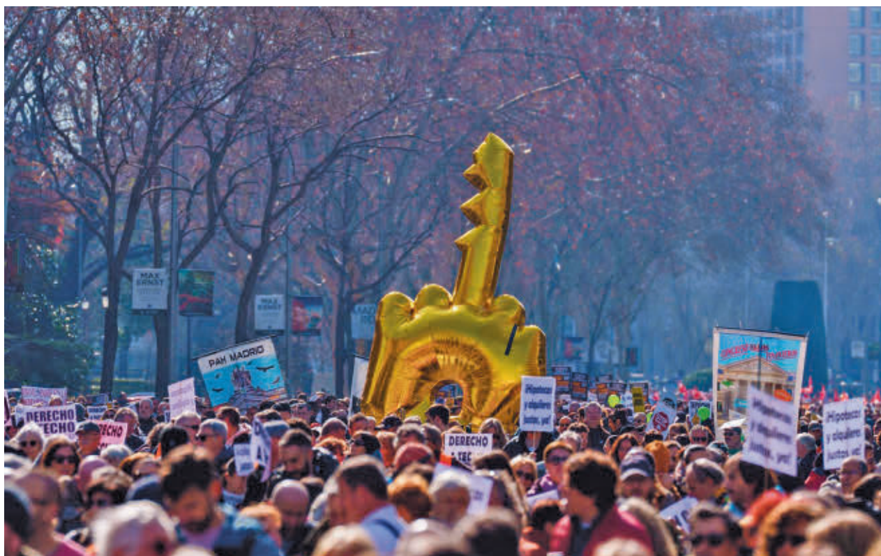
Manifestación del pasado domingo en las calles de Madrid