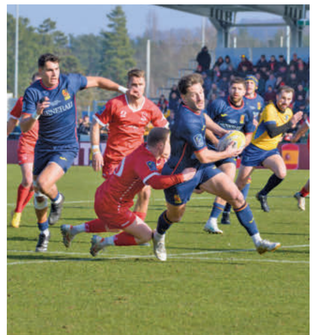
El triunfo en Suiza dio la clasificación para el Mundial de 2027

Además, el Silbó San Pablo Burgos defenderá su liderato en casa ante otro ilustre, el Monbus Obradoiro.