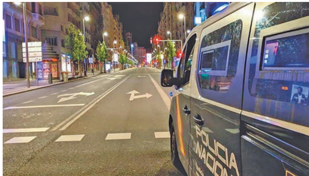
Un vehículo policial patrulla por las calles de la capital

En cambio, los delitos contra la libertad sexual subieron en la capital en 2024, como en el resto de la región y del país. Así, se registraron 1.753, 407 de ellas violaciones. El tráfico de drogas también se incrementó significativa-