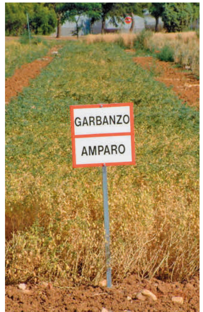
Una de las variedades que se cultivan en la región

como la almorta, la alholva o la algarroba, que aportan nutrientes importantes para la salud. También evalúa el rendimiento de la rotación de trigo y garbanzo en condiciones de bajos insumos.