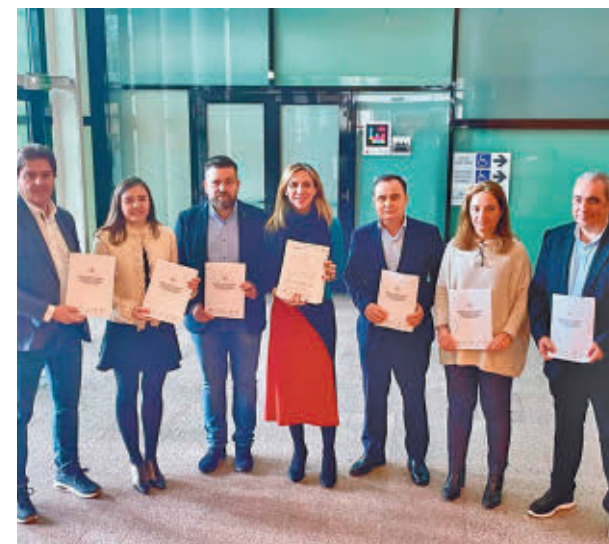
Los alcaldes registraron la iniciativa

Si la propuesta se tumba (como es previsible por la mayoría del PP en la Asamblea), los regidores irán "donde sea necesario", citando al Tribunal Constitucional o al Defensor del Pueblo.