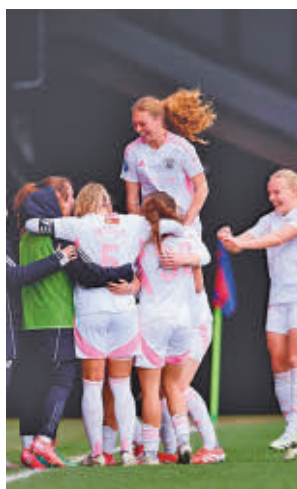
Triunfo en Eibar (1-2)

na intensa ante el rival más complicado. Así, este miércoles 12 caía eliminado en los cuartos de final de la Copa de la Reina a manos del Bar-