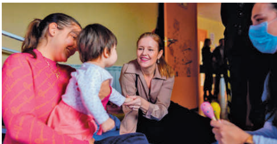
Visita de la consejera al centro