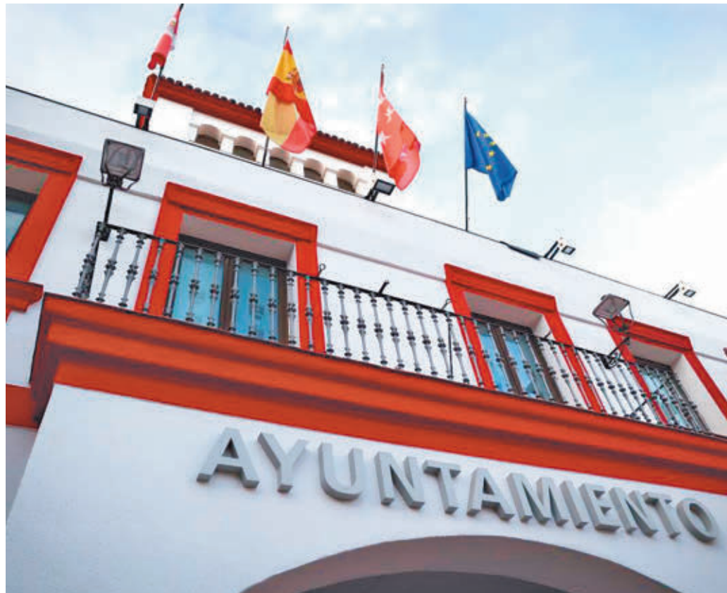
La oposición forzó una sesión extraordinaria del consejo de la EMSV

Lejos de llegar a un acuerdo, la sesión extraordinaria enfrentó aún más las posturas. Todos los grupos de la oposi-