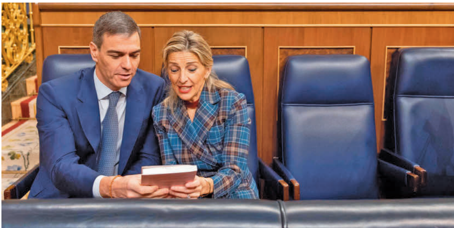
Pedro Sánchez y Yolanda Díaz, durante una sesión en el Congreso de los Diputados