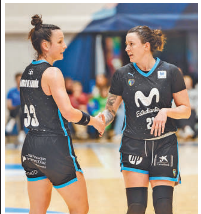
El 'Estu' viaja a Lleida este domingo