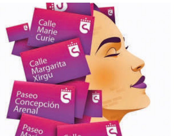
Imagen del cartel ganador

A partir de ahora, la línea 159 de autobús entrará en el Soto de la Moraleja por la calle Caléndula, dando servicio a los desarrollos empresariales de las avenidas de Bruselas y del Arroyo de la Vega. El recorrido inverso lo realizará girando en la glorieta de intersección de la avenida de la Vega con la avenida de la Transición Española. Tras la ampliación recorrerá la avenida de Rafa Nadal, la de Fernando Alonso y el polideportivo José Caballero.