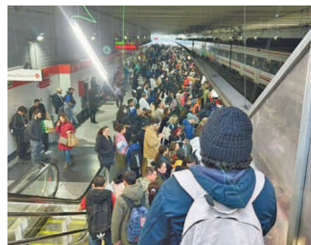
Aglomeraciones en los andenes

La incidencia se registró sobre las 7:50 horas y afectó a los trenes de la línea C-4a (Parla-Atocha-Sol-Chamartín-Cantoblanco-Alcobendas-San Sebastián de los Reyes), según informaron a Europa Press fuentes de Adif. La avería en la estación de Atocha quedó solucionada sobre las