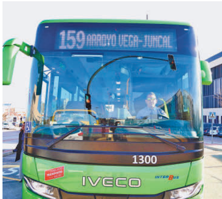
Uno de los autobuses del Grupo Interbús

La línea interurbana de autobús 159 se amplía en tres nuevas paradas para llegar a la zona residencial El Juncal para dar servicio a la Universidad Europea de Madrid. El Ayuntamiento de Alcobendas ha alcanzado un acuerdo con el Consorcio Regional de Transportes para la ampliación de la línea, que hasta ahora unía Plaza Castilla con la zona del Arroyo de la Vega