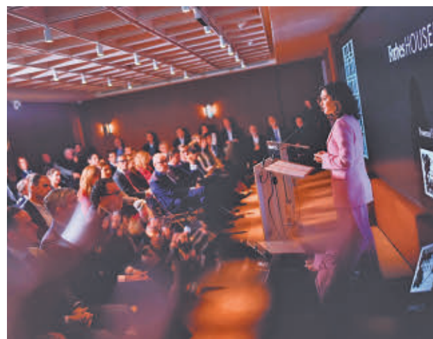
Isabel Díaz Ayuso, durante un acto

El objetivo, según Ayuso es que todas las familias, empezando por vulnerables o