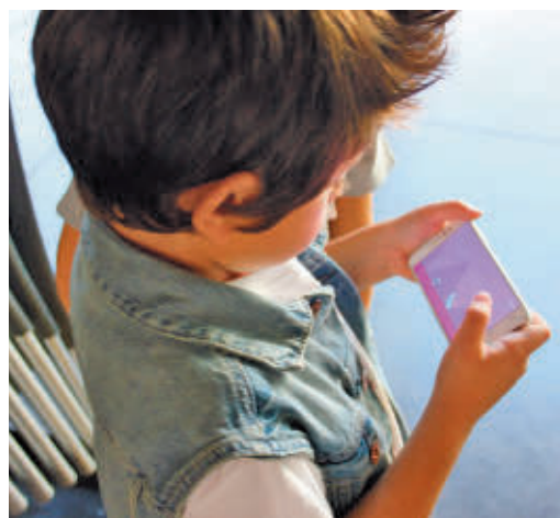
El uso de las pantallas, a debate

EL PERIÓDICO GENTE NO SE RESPONSABILIZA NI SE IDENTIFICA CON LAS OPINIONES QUE SUS LECTORES Y COLABORADORES EXPONGAN EN SUS CARTAS Y ARTÍCULOS