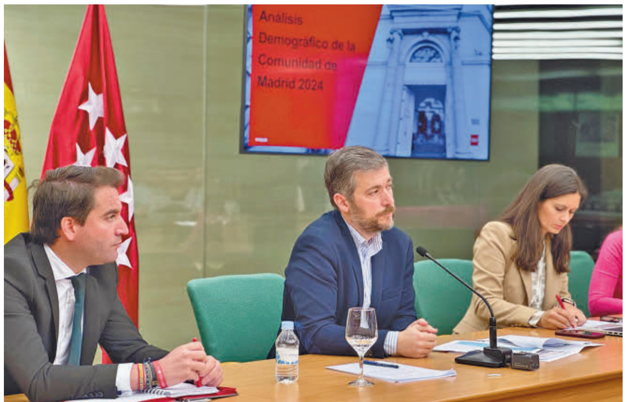
Presentación del informe demográfico de la Comunidad de Madrid

En cuanto a la distribución geográfica, el consejero ha explicado que prácticamente la mitad de los madrileños vive en la capital (49%), mientras que el 42% lo hace