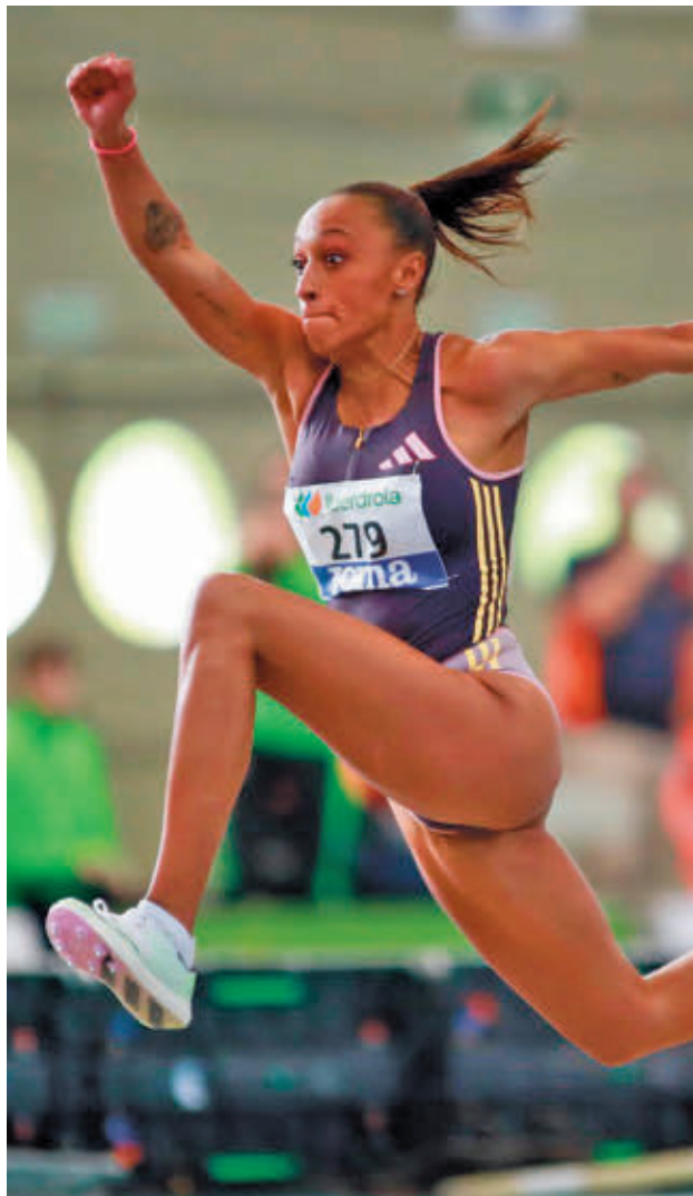
Peleteiro busca su noveno título RFEA

Por cartel, una de las competiciones que más interés