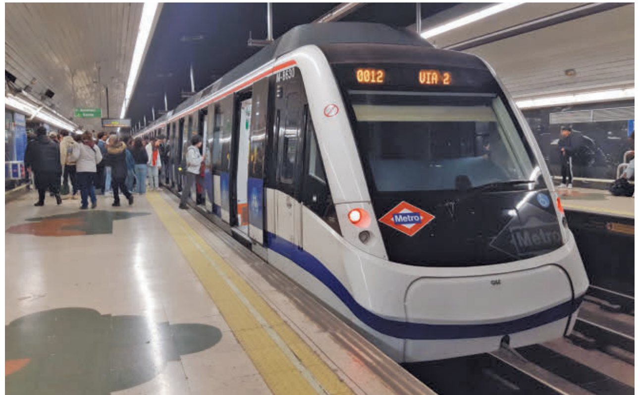
Metro de Madrid se consolida como el medio de transporte más utilizado

Durante el año pasado se registraron 1.722 millones de desplazamientos, superando la marca que se estableció en 2007 • Metro, la EMT, los autobuses interurbanos y urbanos y Cercanías fueron los medios más utilizados