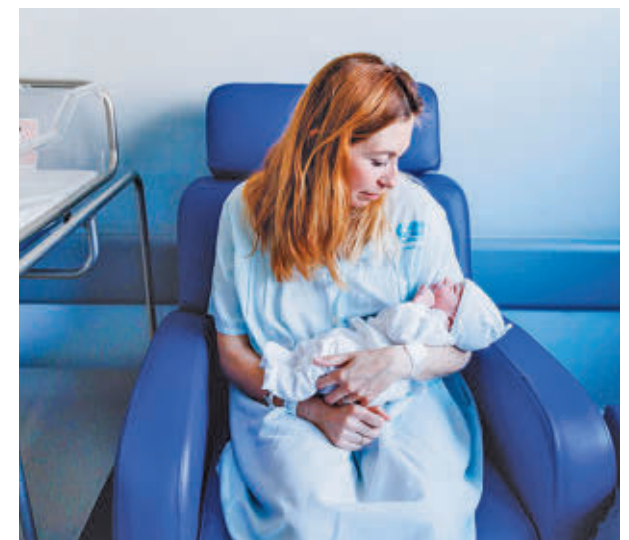
Primera bebé nacida en la Comunidad en 2025

A nivel nacional, por primera vez en mucho tiempo ha habido un incremento del 0,4% en el número de nacimientos.