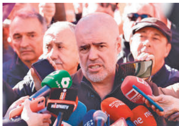
Los líderes sindicales, en un acto

con derechos, con esperanza, se le derrota con cariño". Díaz ha reivindicado que ahora "es el momento de que la democracia llegue a las empresas" porque, en sus palabras, la productividad ha subido mucho más que los salarios en