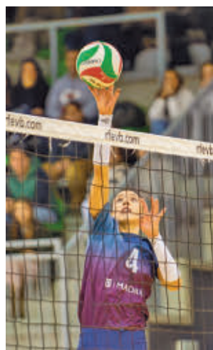
Grazi, en un partido anterior

este fin de semana y lo hace con la disputa de la jornada 19, en la que el Madrid Chamberí afronta una auténtica final con el Arenal Emeve (sáb-